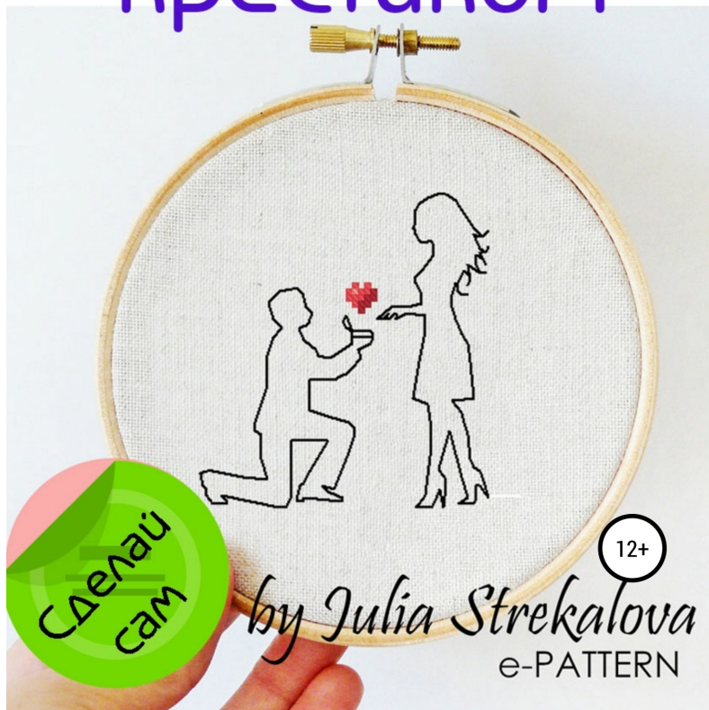
Схема для вышивки крестиком