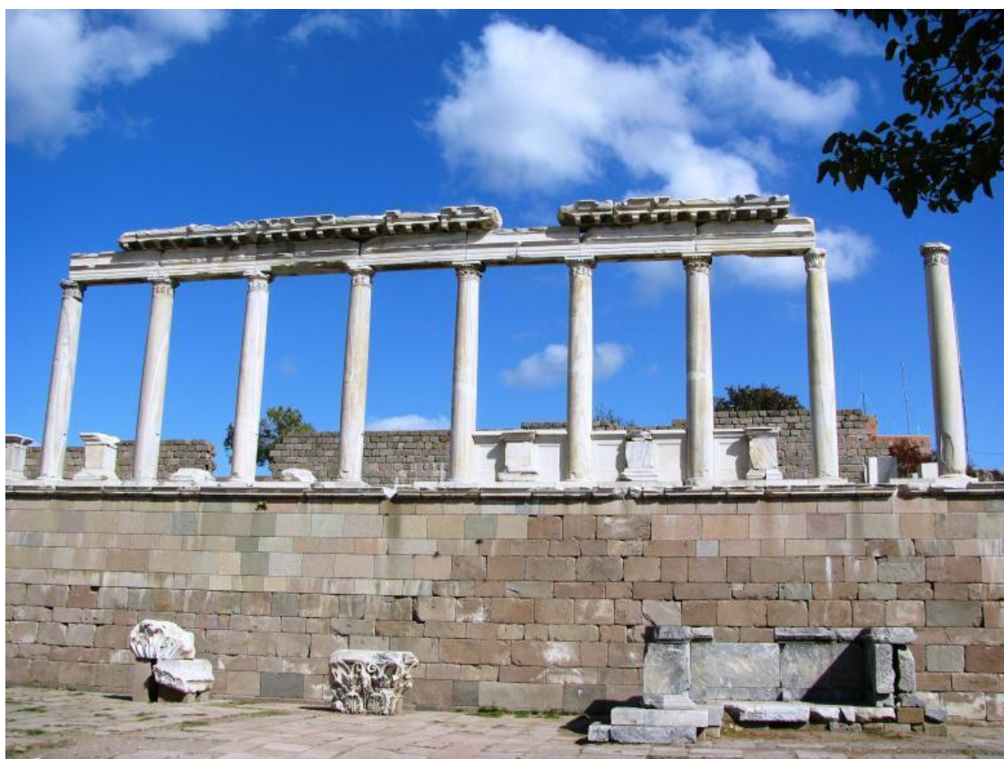
Рисунок 1 Перга́м (Пергамо́н, др.-греч. Πέργamon) – античный город в исторической области Мизия на западе Малой Азии

Как мы видим, мировые религии едины в решительном осуждении этого человеческого порока. (Прит. 14:30; Иак. 3:16; Кор.6,113).