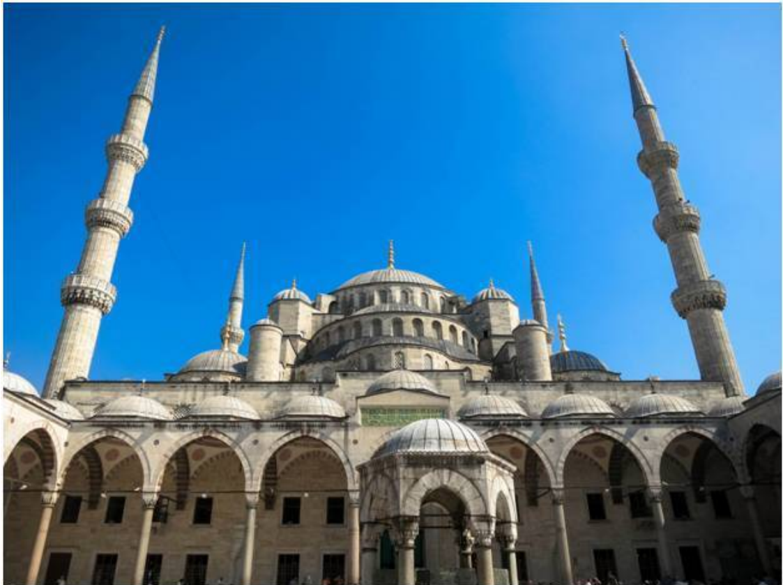
Мечеть Султана Ахмеда, Стамбул, Турция

«Скажи: «Он – Аллах – един; Извечен Аллах один. ... Он не рождает и Сам не рожден, Неподражаем Он и не сравним ни с чем, Что наше виденье объять способно Или земное знание может охватить». (Втз. 6:4; Ис. 43:10-12;45:18; Ос. 11:9; Мк. 12:29; Мтф. 4:10 Кор. 2:163, 112:1-4).