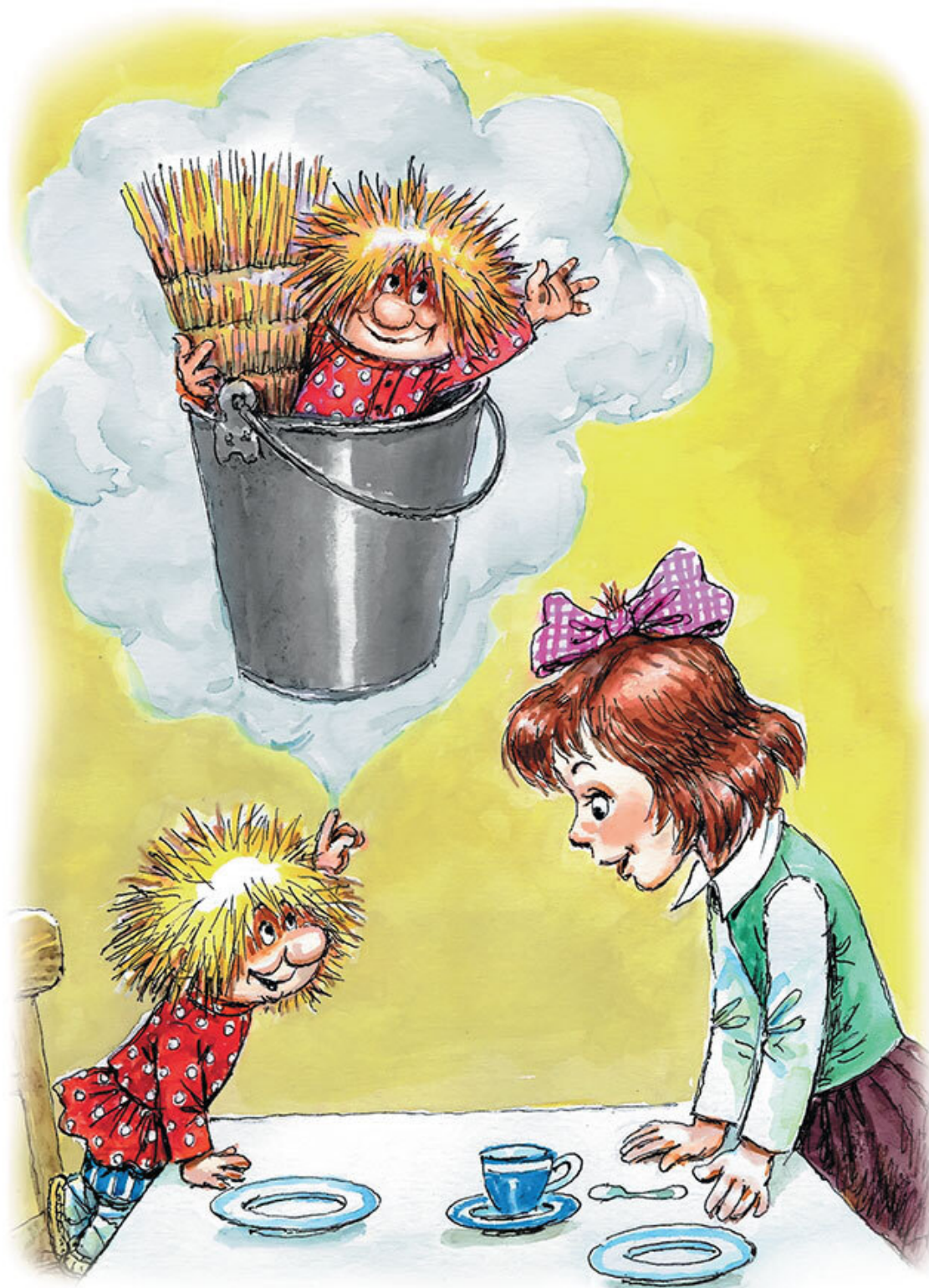
Татьяна Александрова Домовёнок Кузька