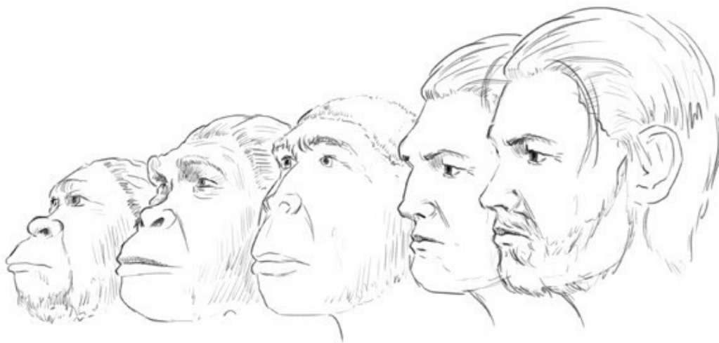
РИС. 3. Изменение черт лица в процессе эволюции

Теперь чуть подробнее приглядимся к нашим прямым предкам. Их лица, как мы уже знаем, эволюционировали вместе с мозгом.