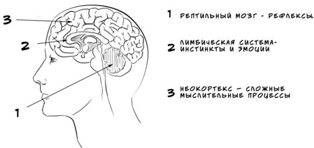
РИС. 2. Этапы развития мозга

Наиболее активное развитие мозга происходит в первый год. Но для полного созревания мозгу требуется более двух десятилетий. В масштабах средней продолжительности жизни это огромный срок – около трети.