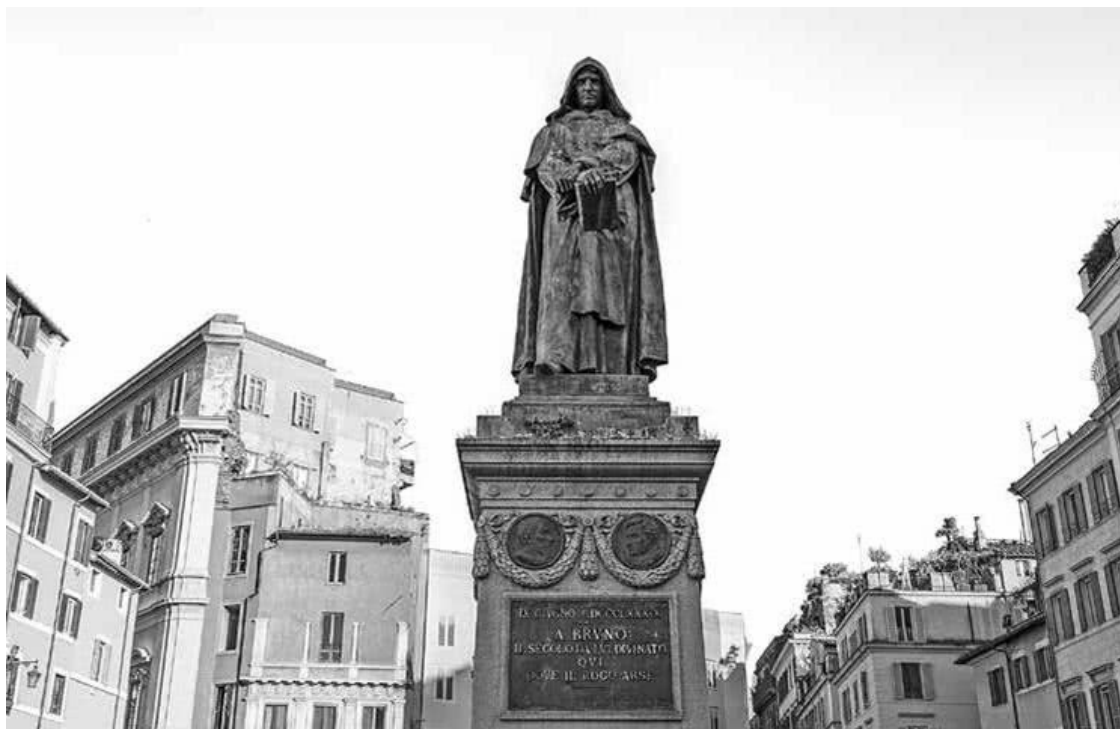
Памятник Джордано Бруно на месте казни в Риме

К моменту «встречи» с Джордано Бруно судебная система святой инквизиции насчитывала почти четыре столетия. За это время был накоплен колоссальный опыт в решении главной задачи любого инквизиционного трибунала – определении, является ли обвиняемый еретиком. Процедура была, как правило, неспешной и предоставляла подсудимому, а затем подсудимому определенные возможности спастись.