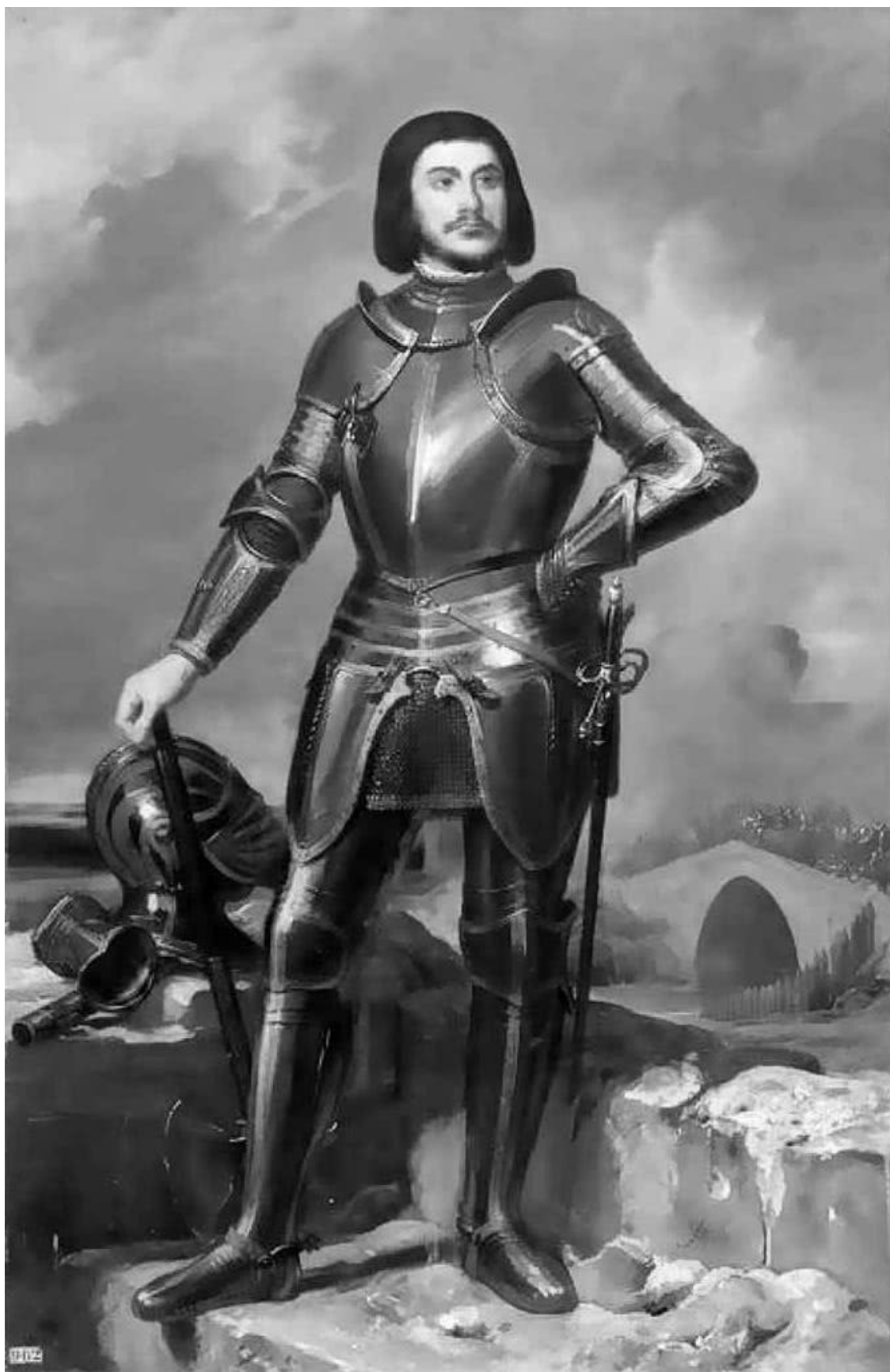
Элуа Фирмин-Ферон. Жиль де Лаваль, сир де Ре, соратник Жанны д'Арк, маршал Франции