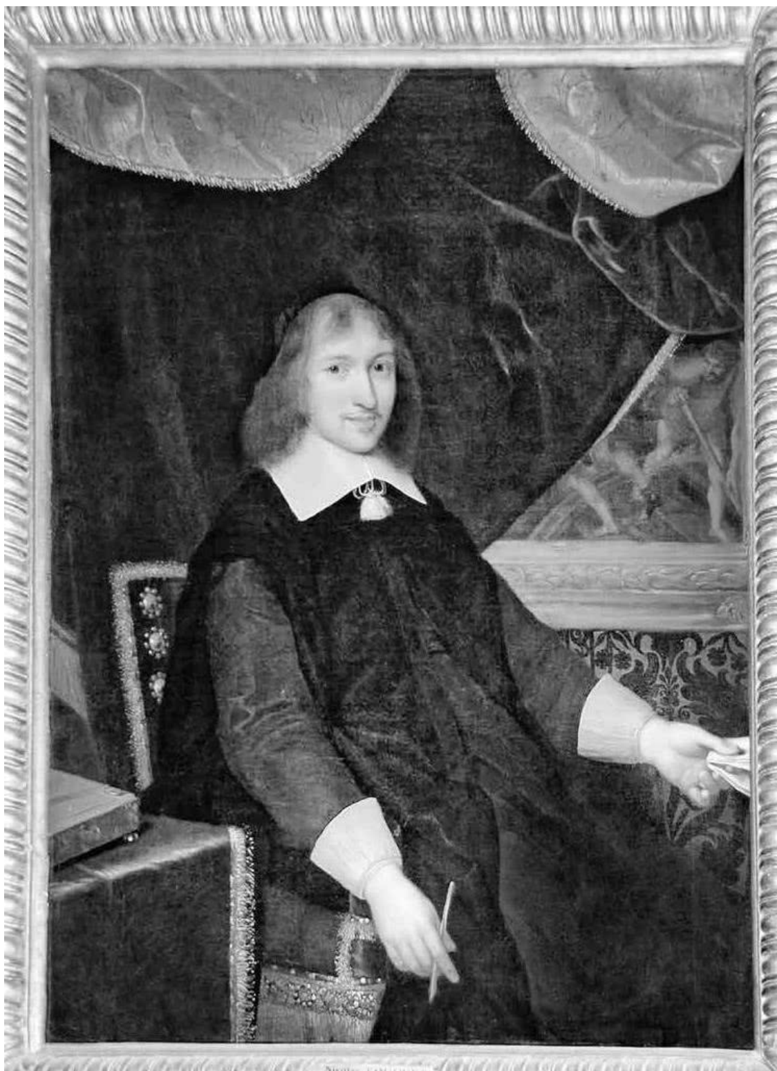
Эдуар Лакретей «Портрет Николя Фуке»

Несмотря на то, что специально «под Фуке» была создана особая Правовая палата из 28 судей, которых тщательно отбирали и инструктировали, судебный процесс шел «не гладко». В результате отпало обвинение в оскорблении величества: адвокаты Фуке убедили суд в том, что он планировал заговор не против монарха, а против Мазарини. Сумма предъявляемых злоупотреблений также сократилась, хотя и осталась внушительной. Все это повлияло на итоги голосования: девять голосов было подано за смертную казнь и 13 – за ссылку; конфискация