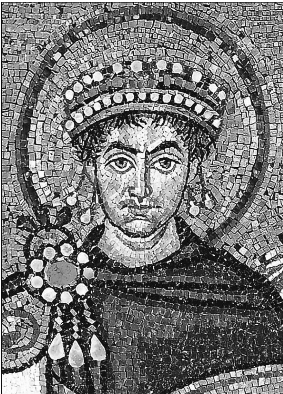
Юстиниан Великий. Фрагмент мозаики из Равенны

В свою очередь «склавины» тоже объединились в конфедерацию во главе с племенем дулебов, обитавшим на Воляни. Их вождь-жрец носил титул мусок (у арабских историков он превратился в имя Маджак). По догадке Г.В. Вернадского, слово «мусок» – арийское, (точнее, аланское) и означает что-то вроде «мудрец». Вернадский вообще любил проводить параллели между славянами и аланами.