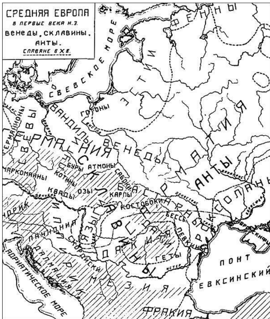
Средняя Европа в первые века нашей эры. Карта-схема

Против жужаней восстали тюркюты . Это монголоидное племя, говорившее по-тюркски и жившее в горах Алтая. Жужани в ходе короткой жестокой войны были истреблены, а тюркюты создали свой каганат и начали завоевания. Лишь с этого времени, к слову сказать, началась тюркизация западной части Великой Степи. До этого в Поднепровье, на Кубани, на реке Урал преобладали угры.