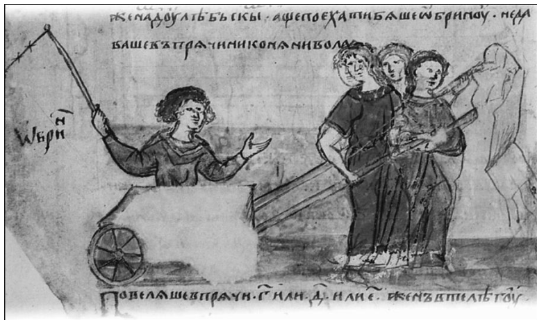
Славянские женщины везут дубеба. Радзивилловская летопись

Другая часть хорватов отправилась по приказу кагана в Чехию и поселилась в Судетах, которые напоминали славянам родные Карпаты, да и были, в общем, ответвлением этой горной системы. Жили они и в верховьях Вислы вокруг позднейшего Кракова. Этих славян называли черные хорваты . Черный – цвет подчинения у кочевников и славян. Подчинялись, конечно, аварам.