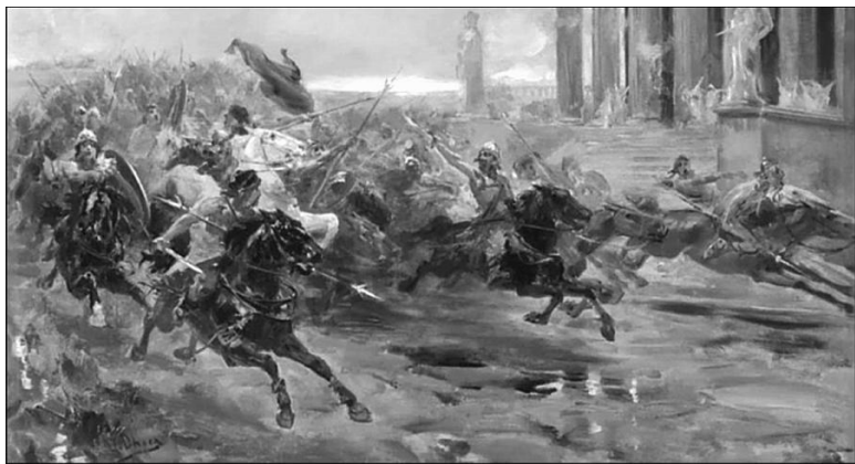
Гунны идут на Рим. С картины У. Фернандеса-Чека-и-Сауса

однажды, как обычно, дичь на берегу внутренней Мэотиды, заметили, что вдруг перед ними появился олень» (Гетика. 123). Животное вошло в морские воды и, «то ступая вперед, то приостанавливаясь», перебежало на другой берег пролива. Для гуннов это стало сюрпризом: пролив считали непроходимым. По мнению античных географов, в это время Меотиды обмелела и превратилась в болото, получив из рек много ила. «Я полагаю, – наивно пишет Иордан, – что сделали это, из-за ненависти к скифам [готам и аланам], те самые духи, от которых гунны ведут свое происхождение» (Гетика. 125).