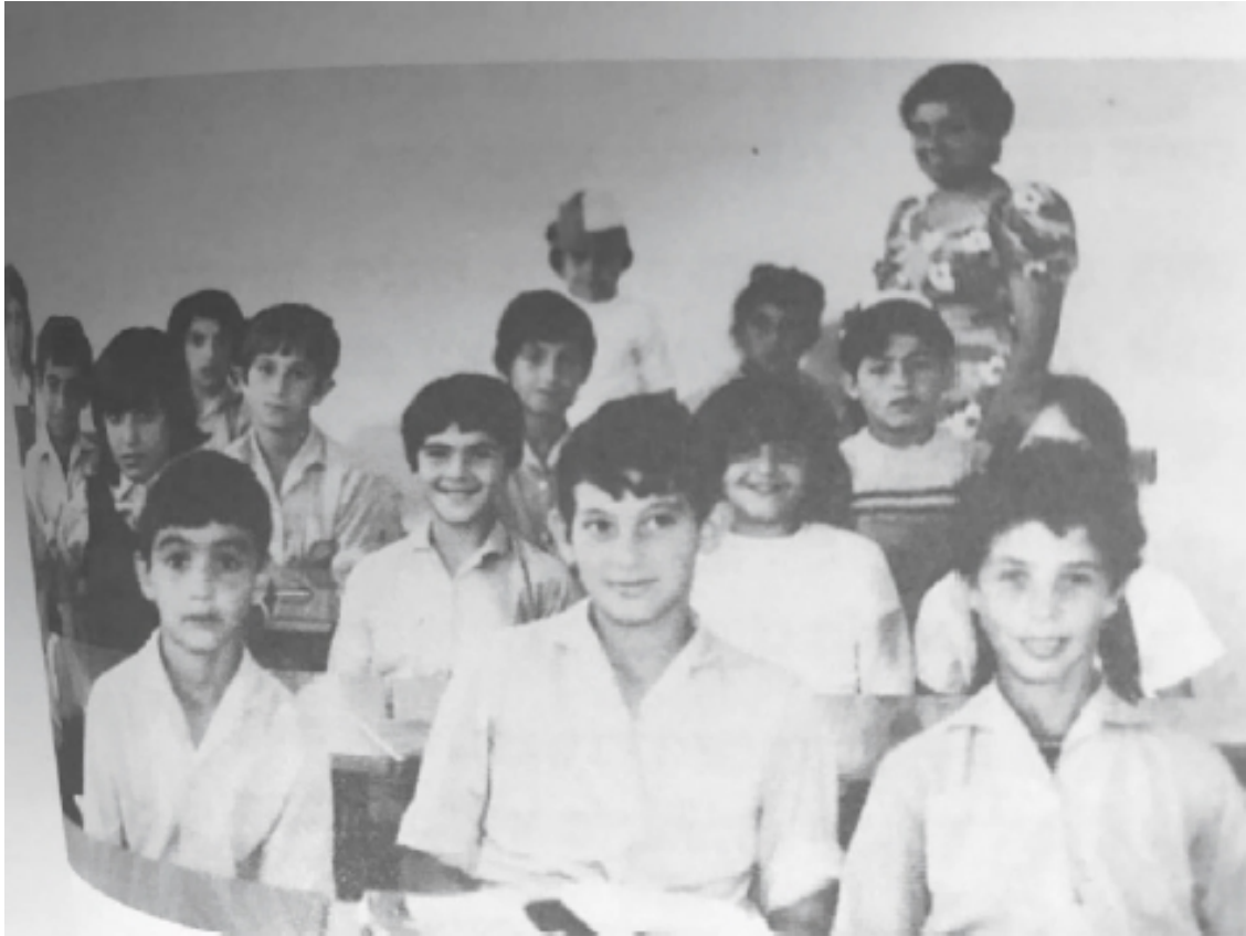
«Классная фотография 4 класс»

Разве я не был для вас веским поводом сделать открытие века? Видимо, для великих и добрых дел мало воображения, дальновидности и таланта. Нужно еще кое-что. Например, Бог, который сотворит для нас чудо.