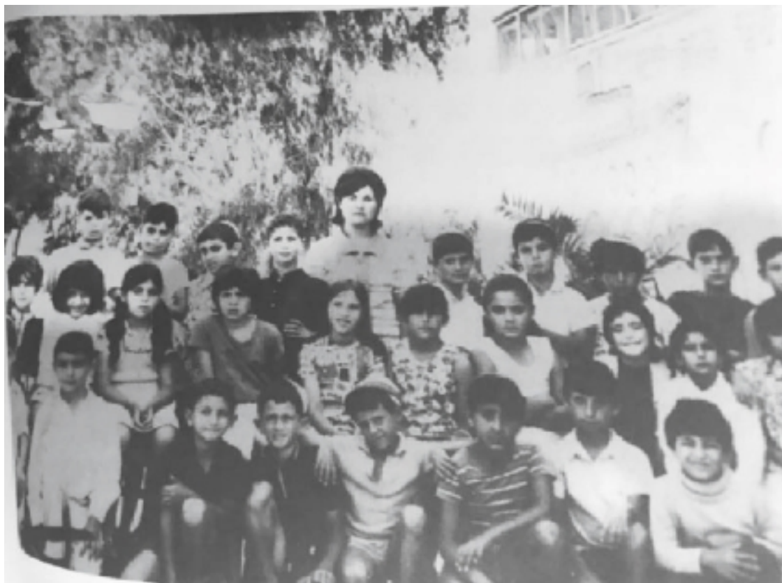
классная фотография, 3 класс