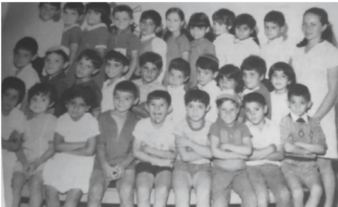
На фото: первый класс

Как кучка матросов, на паруснике с парой весел, отправляемся мы, ученики «Йешурун», в море детских воспоминаний.