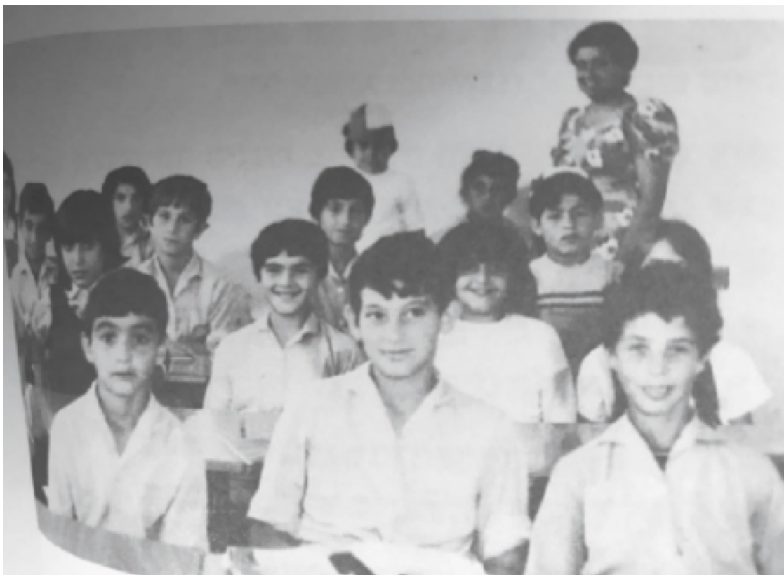
классная фотография, 4 класс

Мы были разумным классом. Таким разумным, что любая фраза начиналась с «как бы» и им же оканчивалась. И еще одно «как бы» маячило в середине.