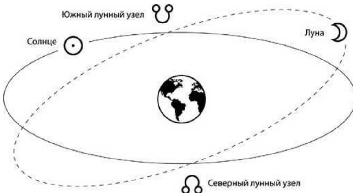
Рим. 1. Пути Солнца и Луны пересекаются в двух точках, образуя лунные узлы

Пути Солнца и Луны пересекаются в двух точках, и именно эти точки называют лунными узлами. Та точка, в которой Луна пересекает эклиптику, двигаясь в направлении Северного полюса, – это Северный, или Восходящий, лунный узел 1 . В европейской астрологической традиции этот узел называют Головой Дракона, а в индийской – Раху. Точка же, в которой Луна пересекает эклиптику в направлении Южного полюса, называется Южным, или Нисходящим, узлом. В европейской традиции это Хвост Дракона, а в индийской – Кету.