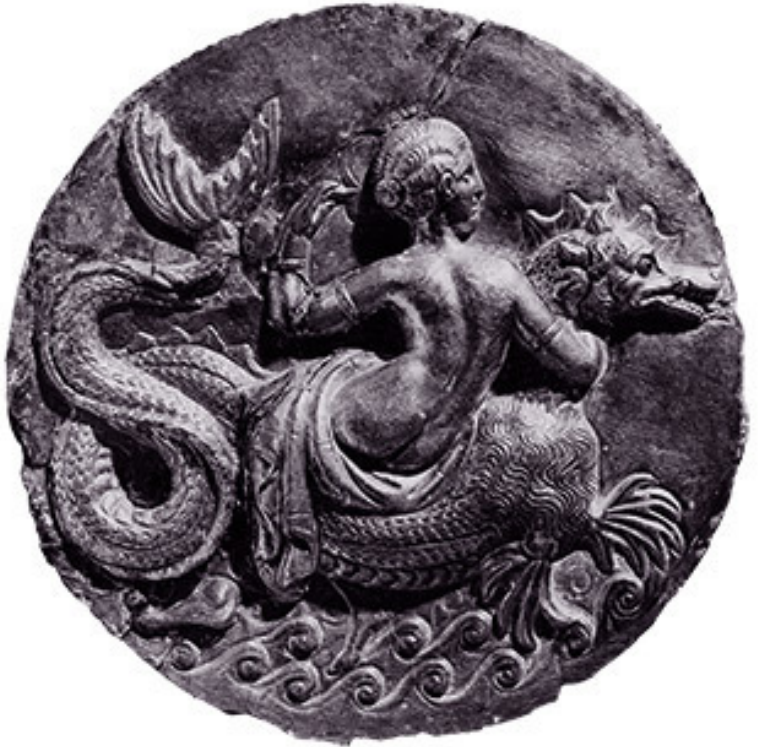
Нереида верхом на ketos (морском чудище)

держивать мир между людьми и богами. Мифология же очеловечивала богов и объясняла, как возникла Вселенная и как она устроена. А кроме того, была еще магия, которой пользовались самые обычные люди, чтобы напрямую взаимодействовать с незримыми силами.