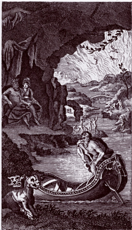
Потусторонняя идиллия: по Стиксу в лодке плывет Ха-