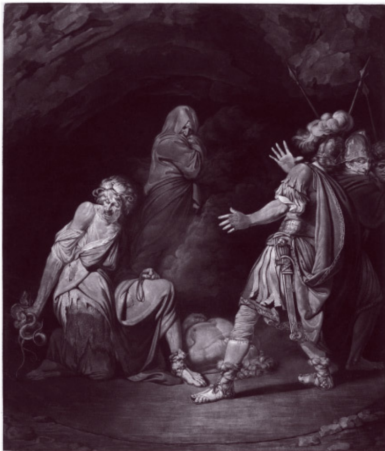
Эрихто собирает ингредиенты для зелья, за ней в ужасе наблюдает юный Помпей Rijksmuseum, Amsterdam