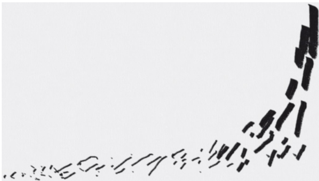
Распределение по принципу «победитель получает все»

Один – звездная система, или распределение по принципу «победитель получает все». «Звезд», например кино или спорта, в ней может быть очень мало. На графике подобного распределения есть возвышающийся над общим изгибом пик, на котором находятся крайне немногочисленные победители, а есть длинный «хвост» менее успешных людей. Между звездами и теми, кто мечтает попасть в их число, людей не так много.