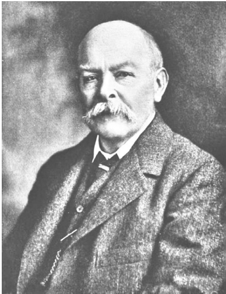
Джон Генри Пойнтин