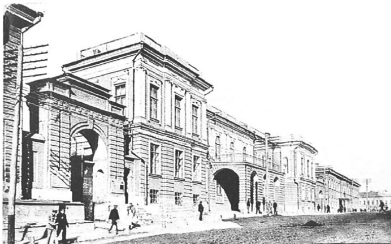
Харьков начала XX века. Императорский университет

И в 1820 г. Михаил заканчивает физико-математическое отделение Харьковского университета, ректором которого был (с 1813 по 1820 гг.) известный ученый Осиповский, издавший четырехтомный «Курс математики». Это было первое отечественное полное руководство по математике, не уступающее многим иностранным сочинениям того времени. Большинство наших преподавателей и ученых, занявших в первой половине XIX в. кафедры математики в университетах Российской Империи, учились по этому руководству.