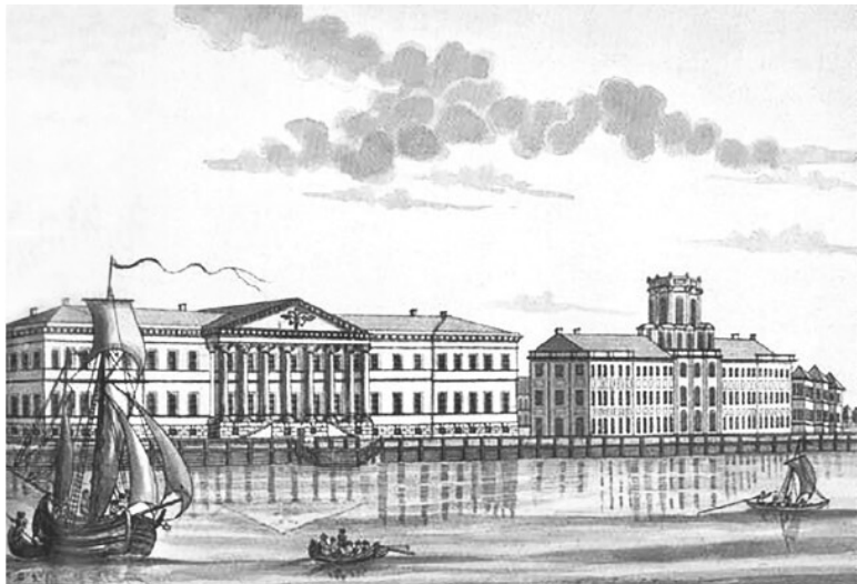
Здание Академии наук со стороны Невы. Ф. Дюрфельдт, 1792 г.

Характерной чертой Остроградского было то, что он всегда брался за коренные вопросы предмета, не останавливаемый никакими трудностями. Пытливый ум ученого не замыкался в пределах одной только чистой математики. Он постоянно работал и над проблемами из области практической физики и механики, а также небесная механика и астрономии. Он с одинаковым успехом работал в разных областях, зачастую опережая своих европейских коллег. Важнейшие работы русского ученого относятся к области интегрального и дифференциального исчисления. Некоторые