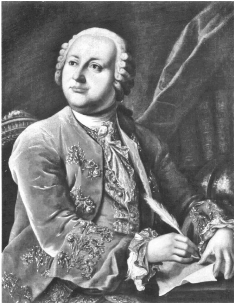
Портрет М.В. Ломоносова. Неизвестный художник, ко-