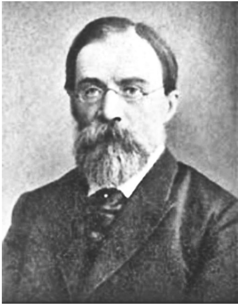
Александр Григорьевич Столетов