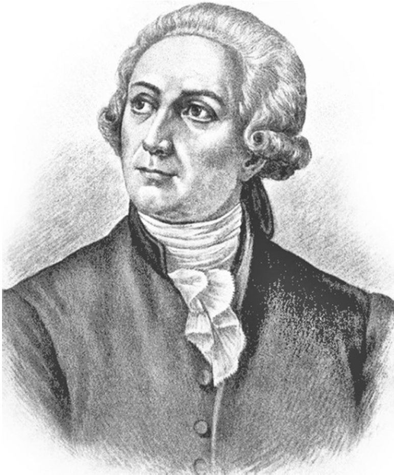
Антуан Лоран Лавуазье

К слову, Юлиус Лотар Мейер (1830–1895) опубликовал