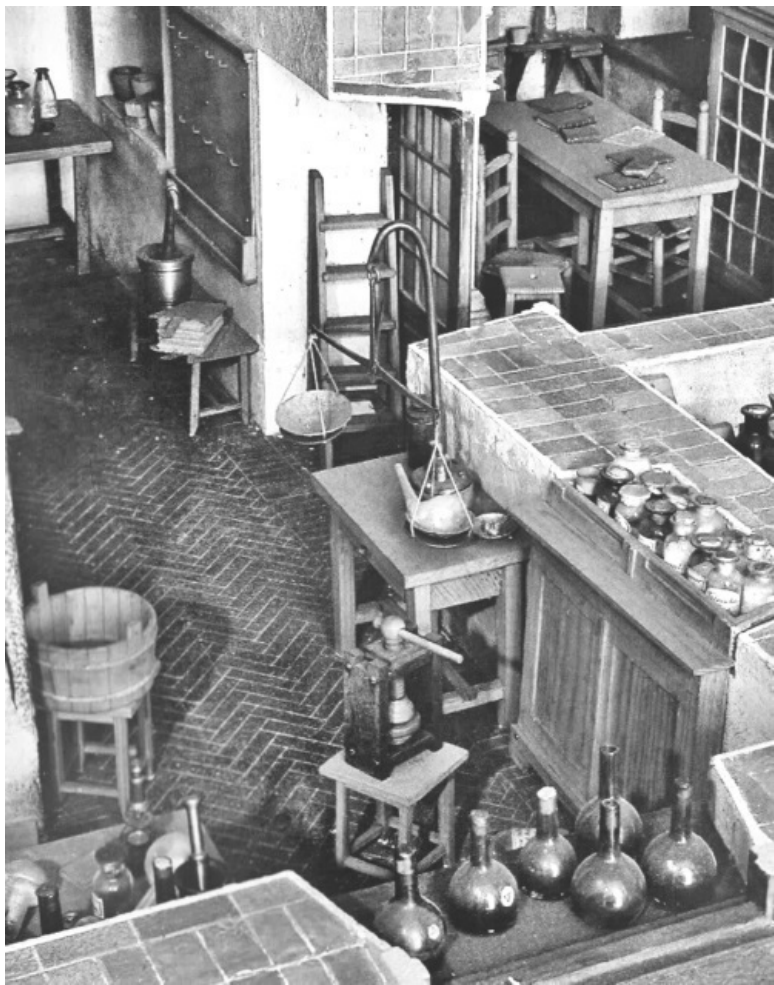
Макет Химической лаборатории М.В. Ломоносова, 1948 год