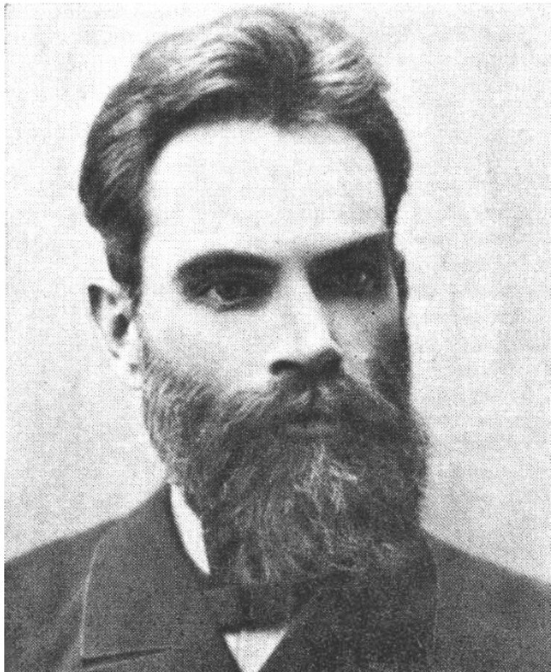
Александр Михайлович Ляпунов