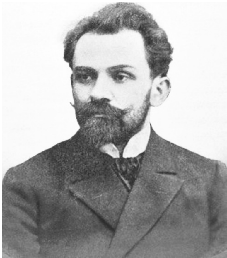
Русский химик, воздухоплаватель Яков Дмитриевич Захаров

Уже говорилось, что Михаил Васильевич Ломоносов со-