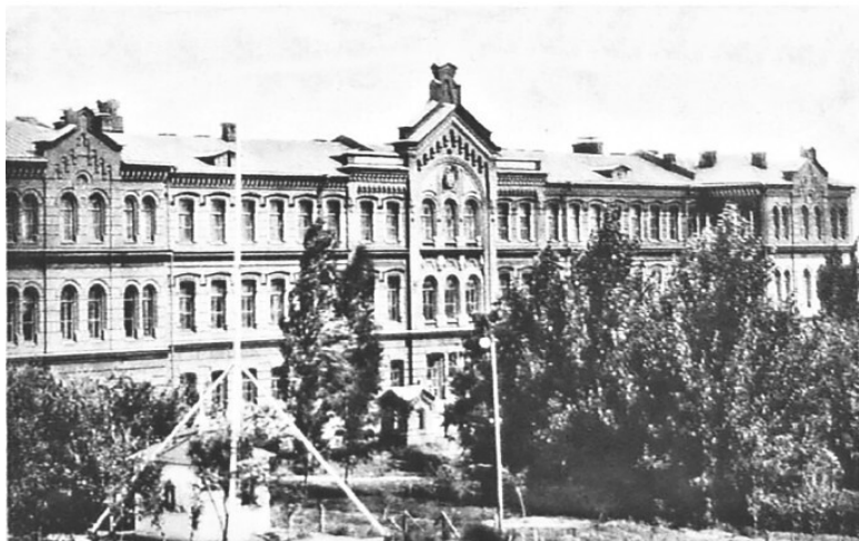
Харьков начала XX века. Главный корпус Технологического института