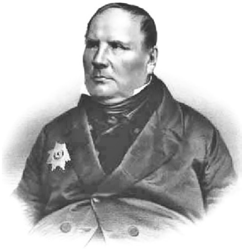
Михаил Васильевич Остроградский

Михаил Васильевич Остроградский (1801–1862) уроженец деревни Пашенная Кобелякского уезда Полтавской губернии. В восемь лет он был определен в пансион