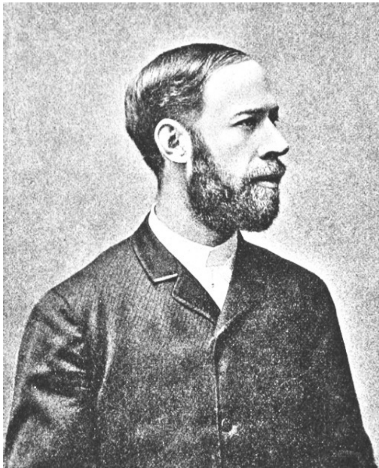
Генрих Рудольф Герц