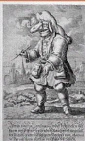
Карикатура на чумного доктора в Марселе, конец XVII века. Заметьте, что халат, маска, сапоги и шляпа сделаны из кожи