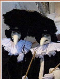
Маски чумного доктора на современном карнавале в Венеции