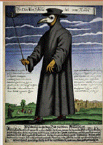
Доктор Шнабель фон Ром («Доктор Ключ Рима»), гравюра Поля Фюрста, 1656