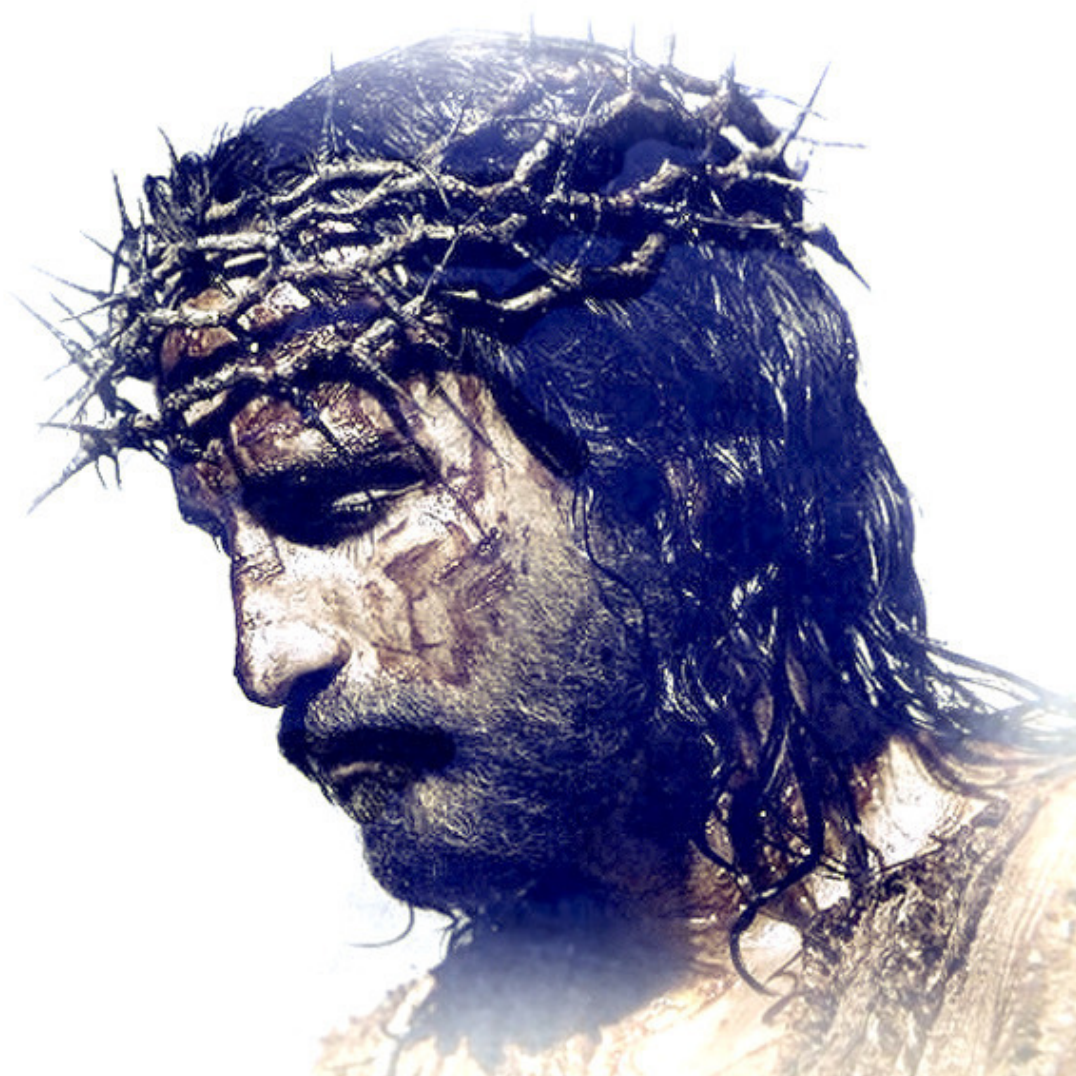
Образ Иисуса Христа с терновым венцом

В австралийских тюрьмах в конце XIX века маски использовались для пресечения разговоров и отчуждения. Они были сделаны из белой ткани и покрывали лицо, оставляя открытыми лишь глаза.