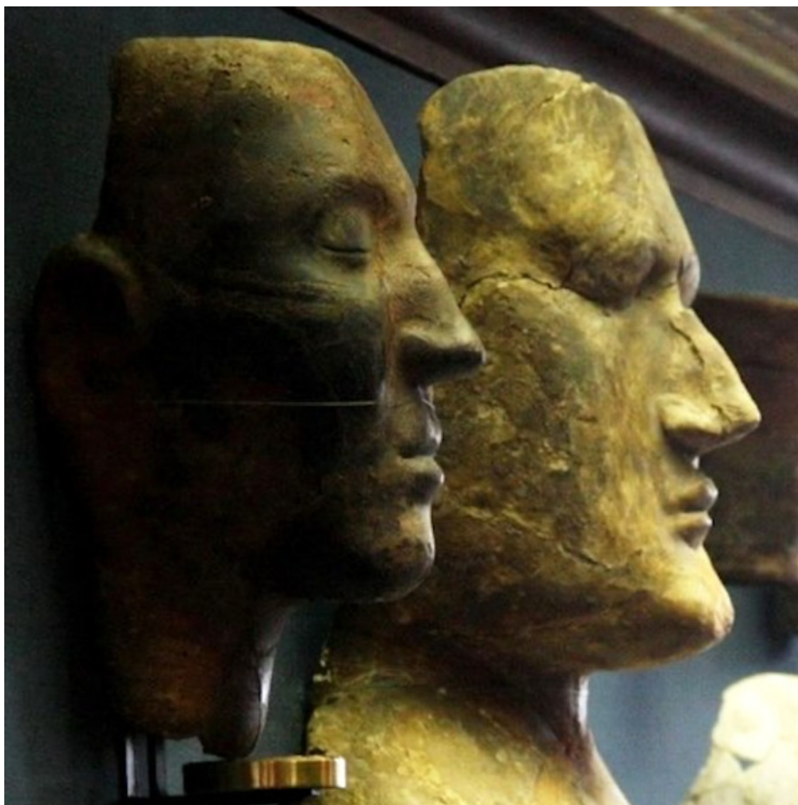
Маски Таштыкской культуры

В погребальных церемониях у римлян принимал участие архимин, который, надев на себя маску, воспроизводящую черты усопшего, разыгрывал и добрые, и злые деяния покойного, представляя мимически нечто вроде надгробного слова.