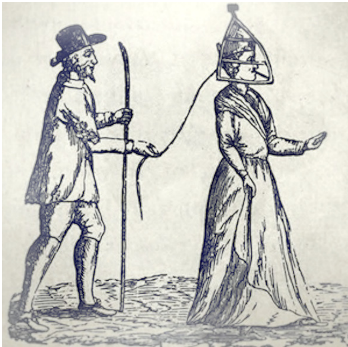
Женщина в маске позора

Маска позора как орудие пыток была изобретена в XVI веке в Великобритании.