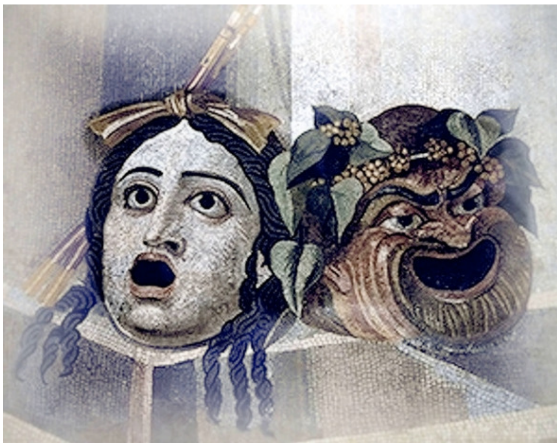
Античные маски трагедии и комедии

Изобретение театральных масок ставят в заслугу Эсхилу. Аристотель же утверждает, что предания о введении масок в театральный обиход теряются во мраке давно прошедшего.