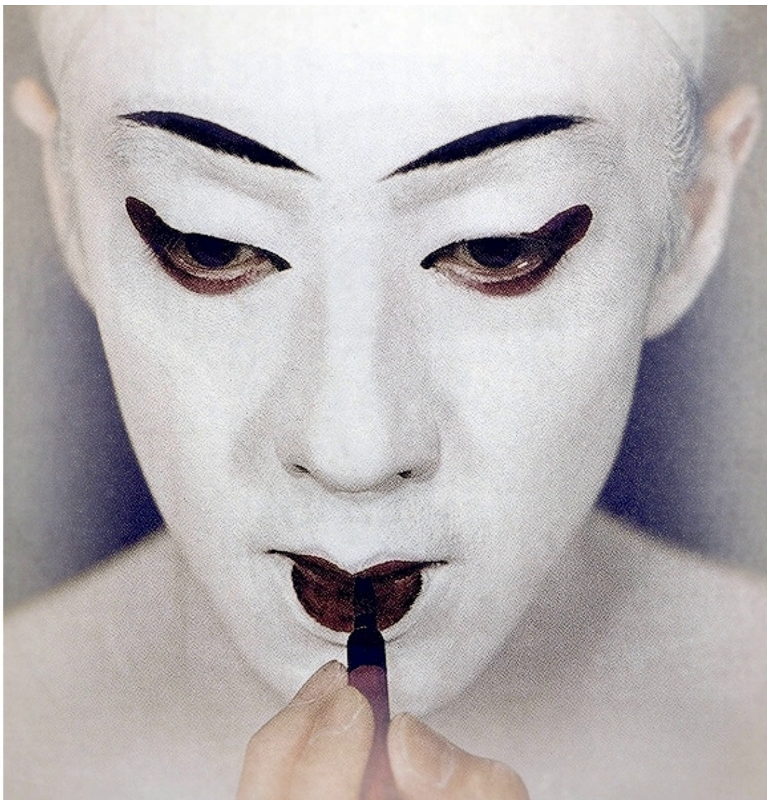
Грим театра кабуки

К концу XIX века маски на Западе употреблялись почти исключительно во время карнавала. Во Франции обычай этот регулировался указом короля 1835 года. Несмотря на то что в Европе маски начали выходить из употребления уже в XVII веке, они изредка применялись и в театральных постановках XX века.