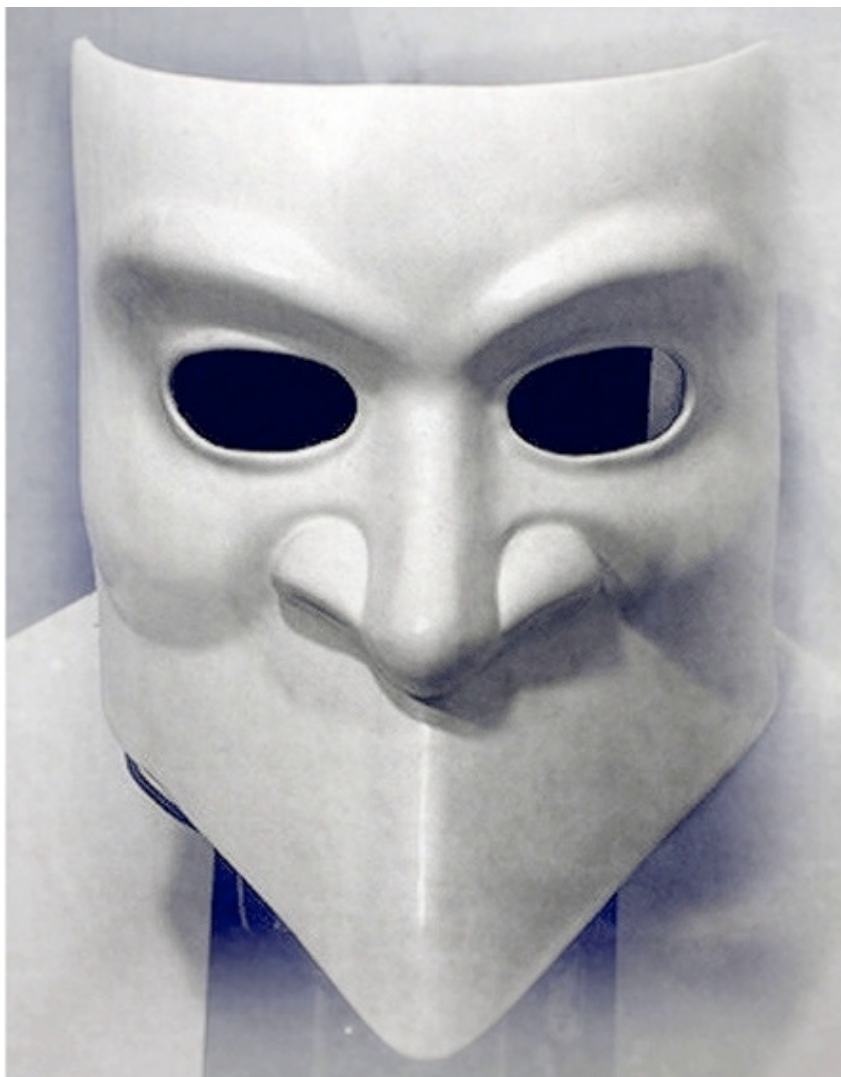
Баута – одна из самых популярных венецианских масок

Некоторые исследователи возводят карнавал к римским сатурналиям.