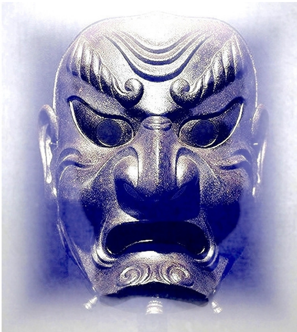
Японская маска менгу

Боевая личина – часть шлема в виде металлической маски. Полностью закрывает лицо, защищая его от не очень сильных ударов, к тому же оказывает психологическое воздействие на противников. Использовалась, например, самураями.