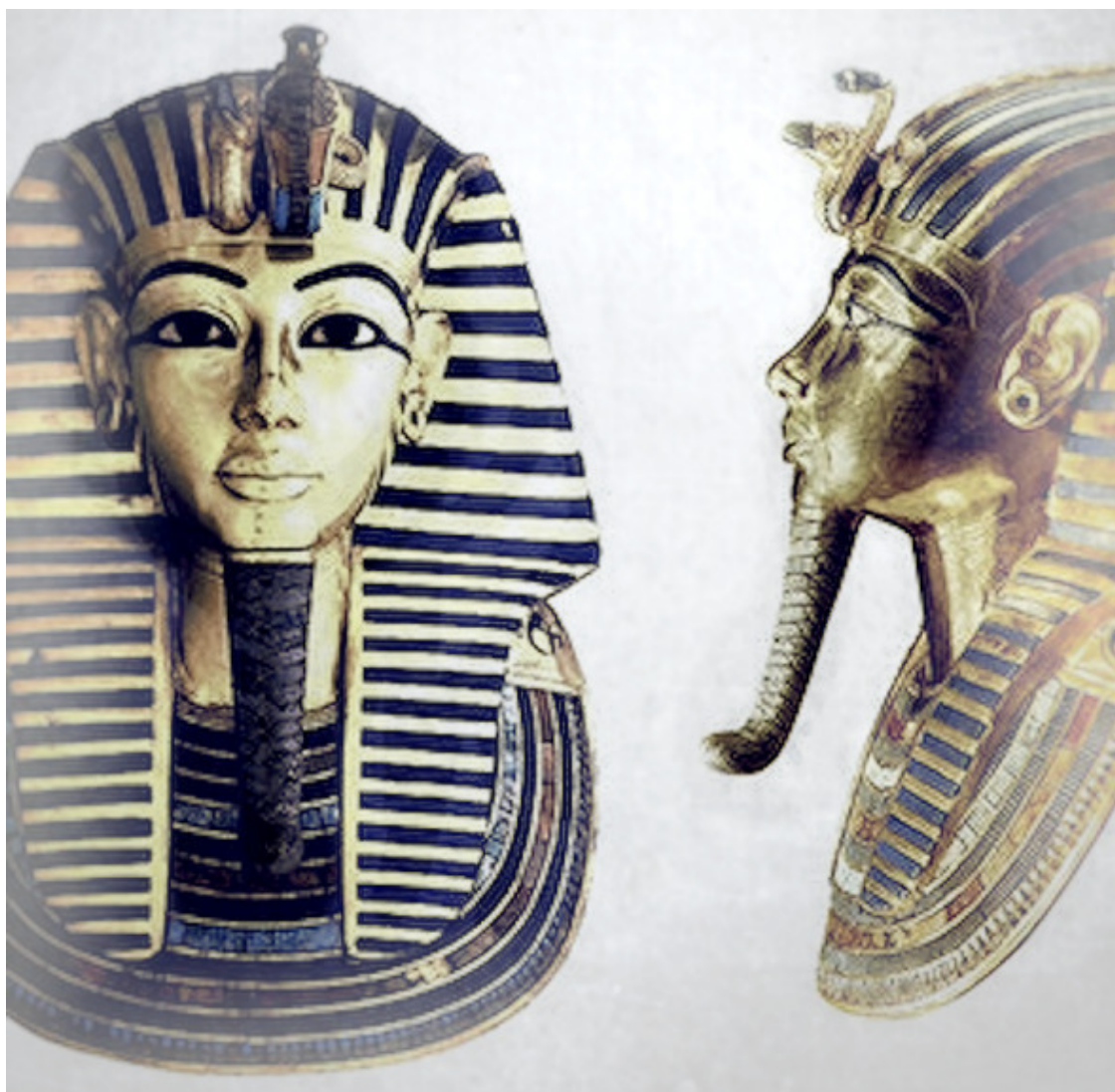
Посмертная золотая маска Тутанхамона

Распространенность физических масок во всех культурах и временах заставляет задуматься об их особой значимости.