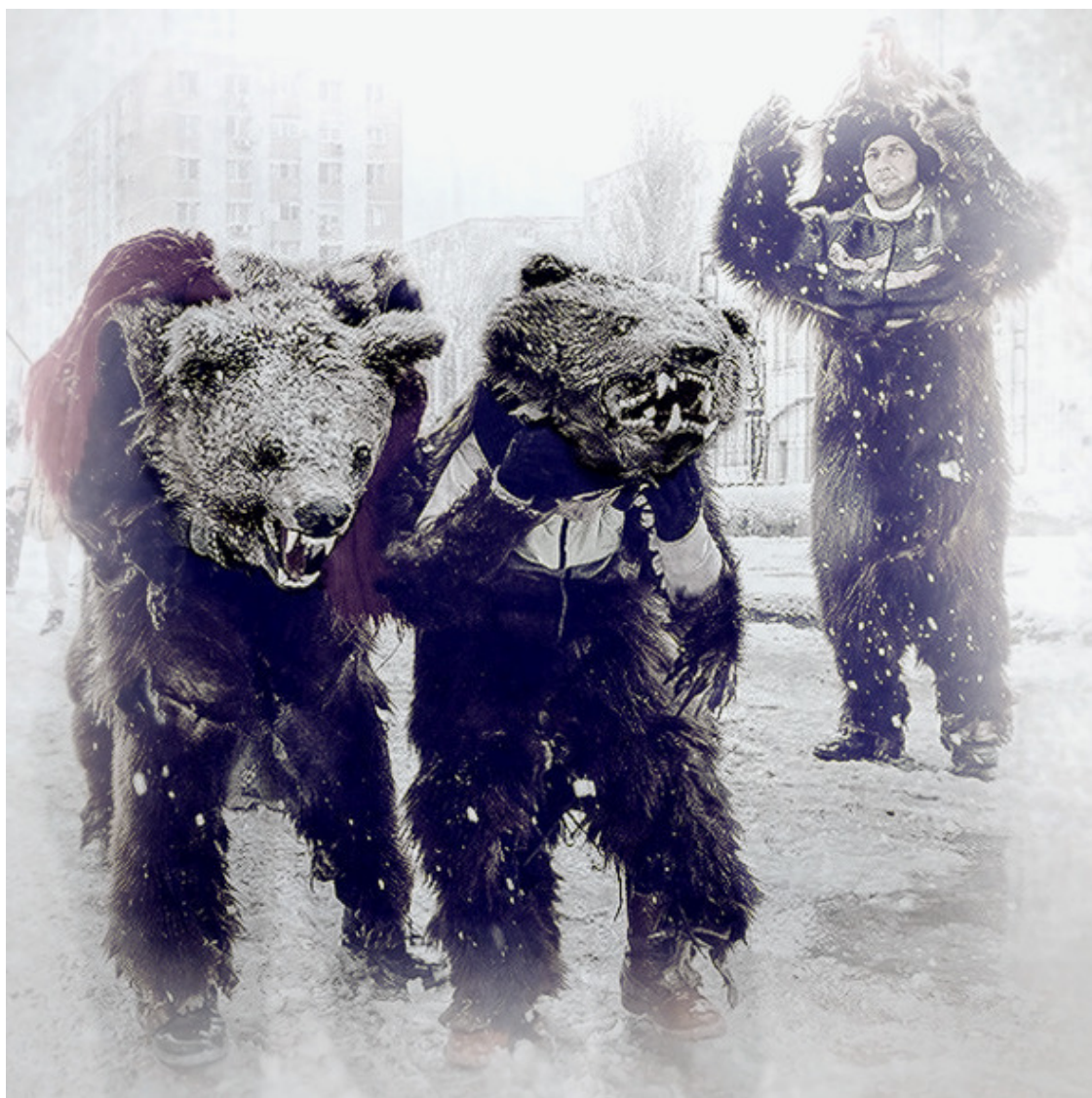
Праздник «Урсул» (Медведь) в Румынии

Ритуальные маски широко известны с древнейших времен у многих племен и народов мира. Изготавливались из древесной коры, дерева, травы, кожи, материи, кости и других материалов и изображали человеческие лица, головы животных или какие-либо фантастических или мифологических существ. Например, праздник «Урсул» (Медведь) в Румынии обязывает его участников надевать шкуры с головой медведя.