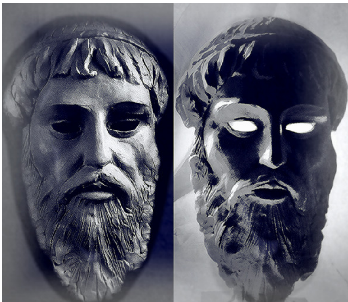
Маска Зевса на стене и на окне.

Когда маска висит на стенке и смотрит на нас пустыми и темными глазницами, как это мы можем видеть в древнегреческой маске Зевса, то в ее исключительно декоративной функции не возникает сомнений. Но если вы разместите маску на оконное стекло и пустые глазницы заполнятся светом, то невольно приходят иные мысли. А именно сквозь глазницы мир смотрит на нас. Мир сквозь маску не просто смотрит на нас, но безликий мир приобретает лицо в маске.