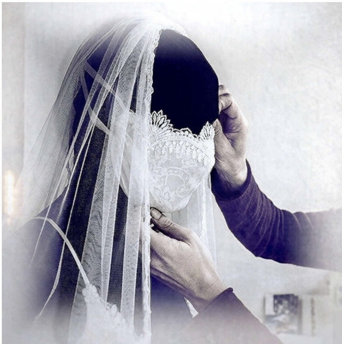
Роль всем известной маски выполняет фата невесты

Самая древняя обрядовая маска на территории России, обнаруженная в новгородской земле, сделана из бересты и датируется концом X века – началом XI века.