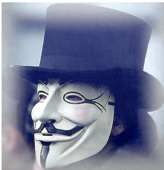
Маска протеста и борьбы – Маска Гая Фокса

В последнее время маска Гая Фокса была замечена и в Белоруссии во время маршей протеста.