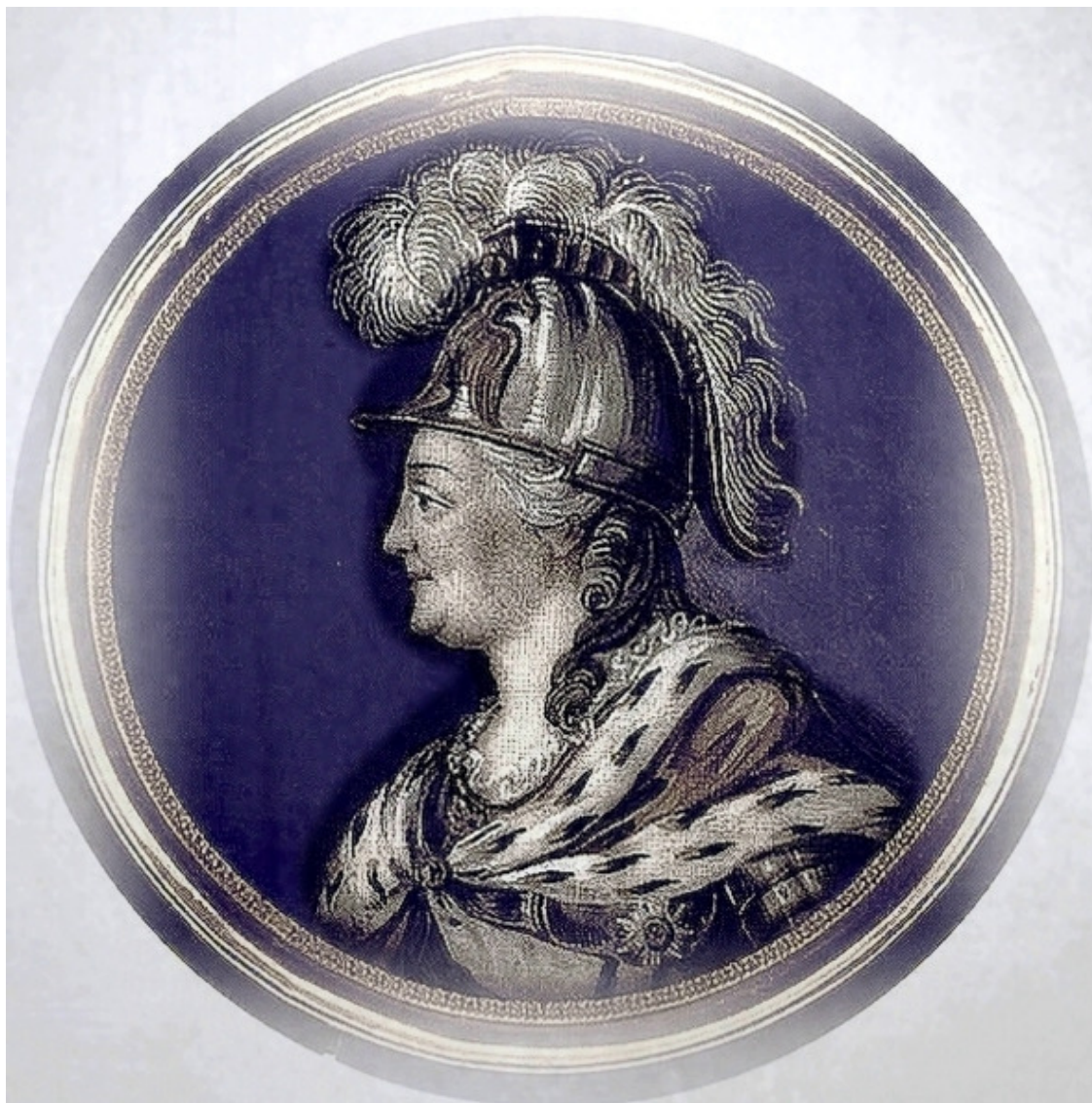
Екатерина II в образе Минервы

Маскарады часто устраивали и в загородных резиденциях. Петр III часто устраивал разгульные празднества, которые превращались в вакханалию.