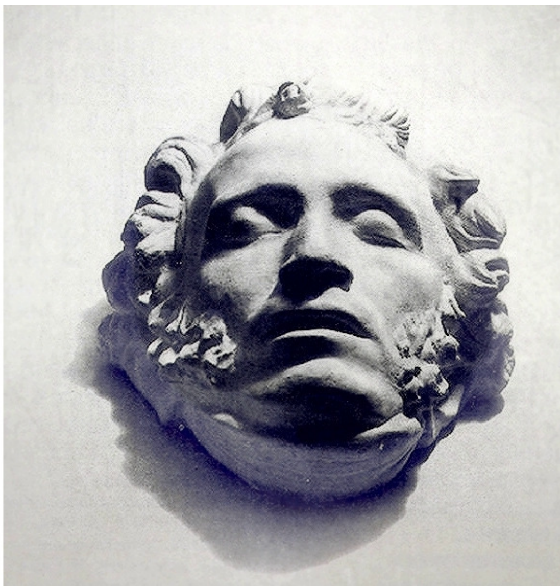
Посмертная маска А. С. Пушкина

Посмертные маски, сделанные профессиональными скульпторами, считаются предметом искусства, который, на наш взгляд, должен иметь ограничения в распространении и демонстрации.