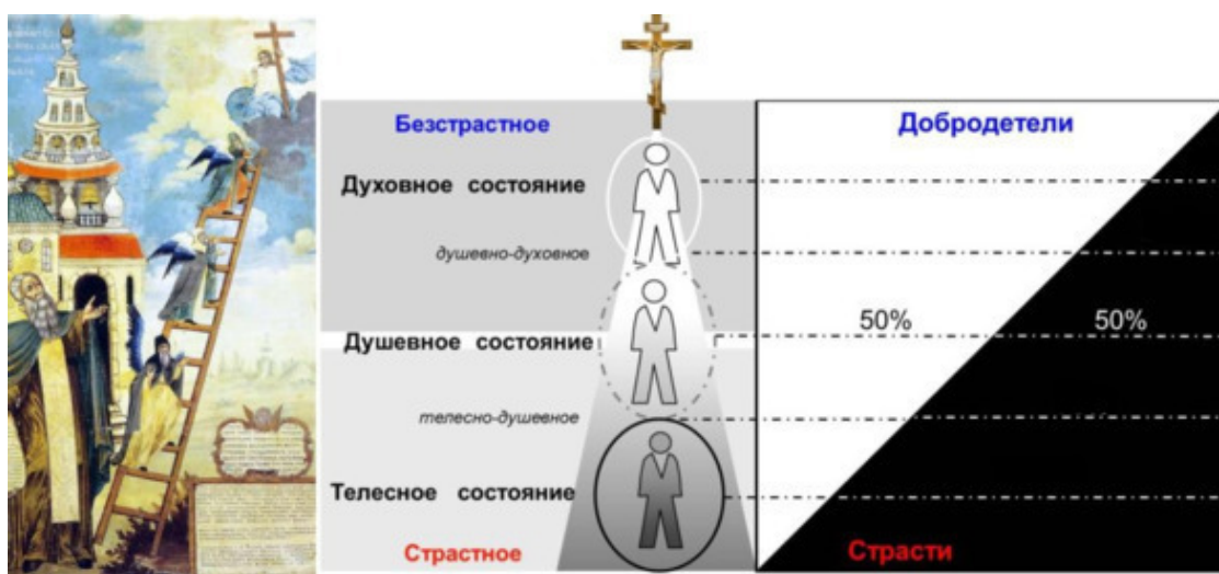
Схема перехода от страстного состояния души к безстрастному

Существует возможность схематического выражения данного процесса в виде схемы изменения соотношения света и тени, как соотношения добродетелей и страстей по мере духовного возрастания.