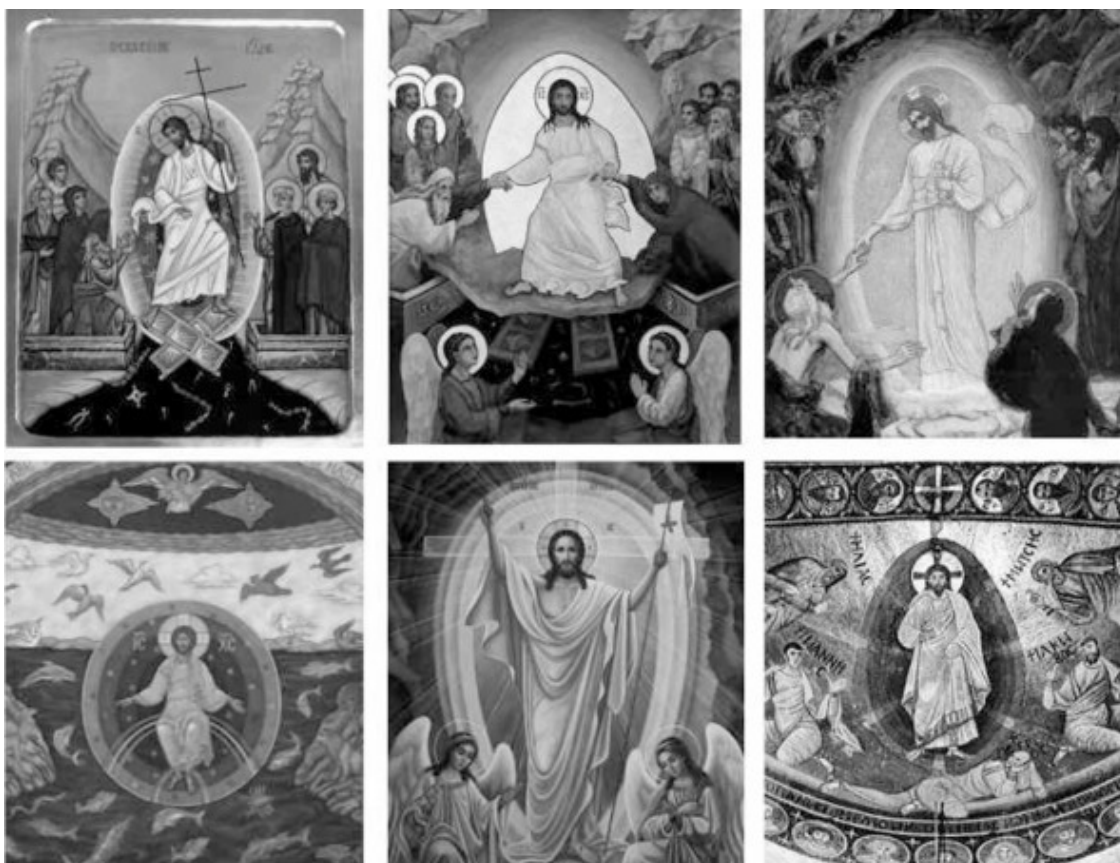
Христос в светящемся яйце

Из святоотеческого предания известно то, что «новый» духовный человек практически полностью повторяет человека «ветхого» и телесного, но имеет целый ряд отличительных и непостижимых свойств.