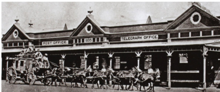
Здание клуба в Булавайо 1890-е годы

Наше жилище находилось по соседству со зданиями клуба, и теперь использовалось, как казарма для скаутов (разведчиков) и защищалось небольшим бастионом из жестяных ящиков из-под печенья и мешков с землей. После завтрака я исследовал Булавайо.