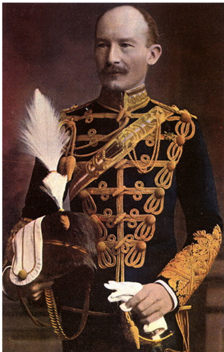
Роберт Стефенсон Смит Баден-Пауэлл (будущий генерал-лейтенант и Генеральный инспектор британской кавалерии) в мундире капитана 13-го гусарского полка