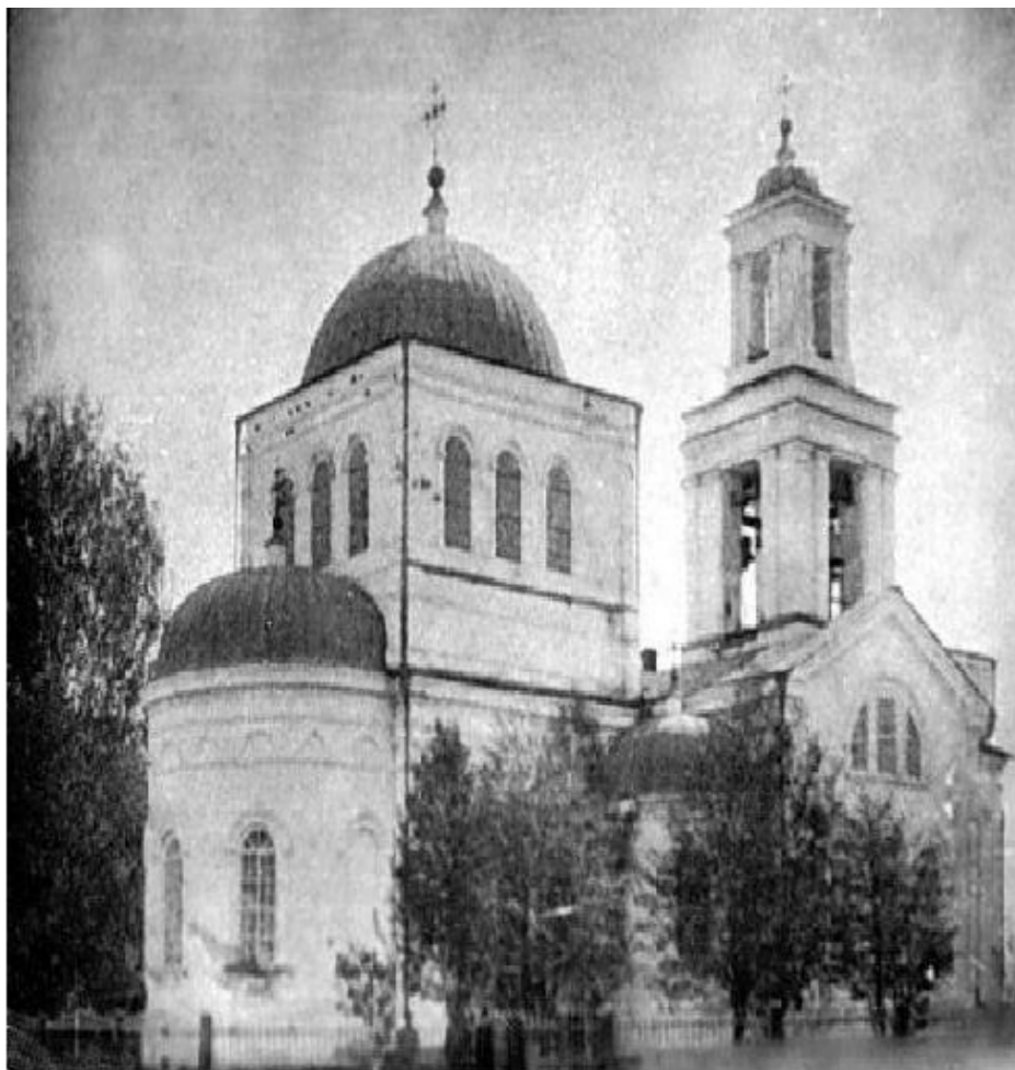
Церковь Успения Пресвятой Богородицы