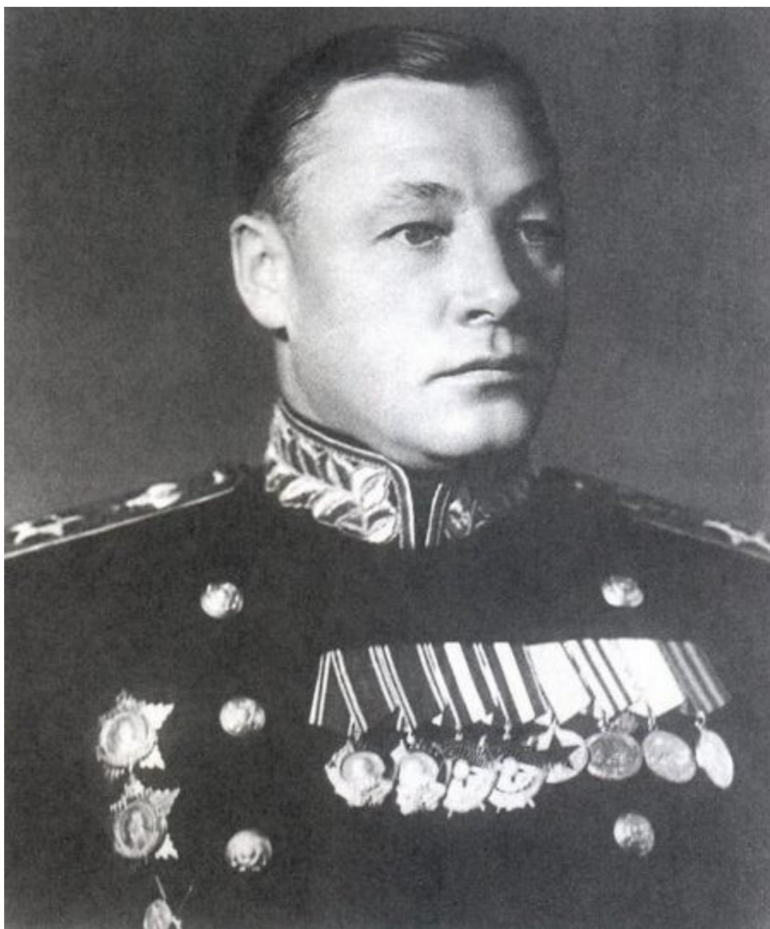
Адмирал Флота Советского Союза Н.Г. Кузнецов

На этом служба заслуженного офицера в действующем флоте завершается. В октябре 1941 года Н.П. Египко получает назначение в аппарат военно-морского атташе (замыкающегося на ГРУ) при посольстве СССР в Лондоне. Некоторое время он является наблюдателем на кораблях британского флота.