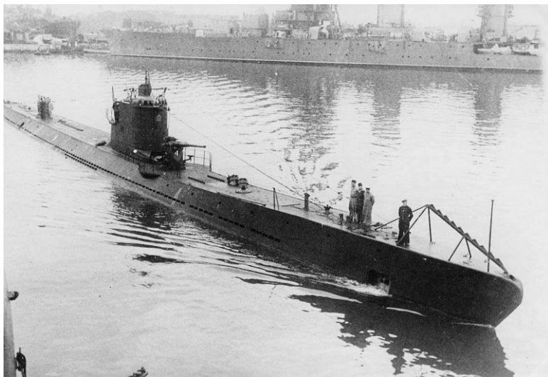
Средняя подводная лодка типа "С"