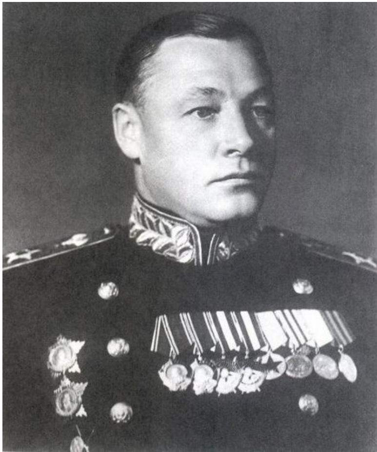
Адмирал Флота Советского Союза Н.Г. Кузнецов