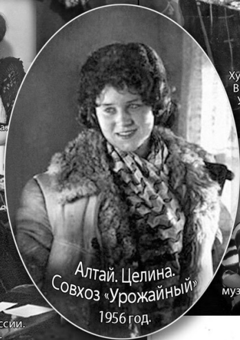
Алтай. Целина. Совхоз «Урожайный» 1956 год.