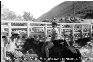
На Катюни. Моя Алтайская целина. 1956.