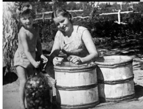
Урал. Эвакуация. Голода избежали. 1943