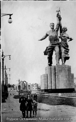
Родное Останкино. Мама, папа и я. 1945.