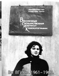
Во ВГИКе. 1961-1967.