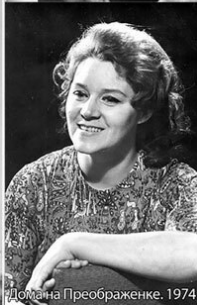
Домана Преображенке. 1974.