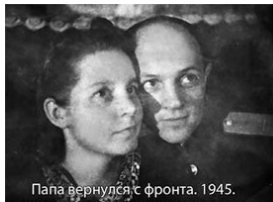
Папа вернулся с фронта. 1945.