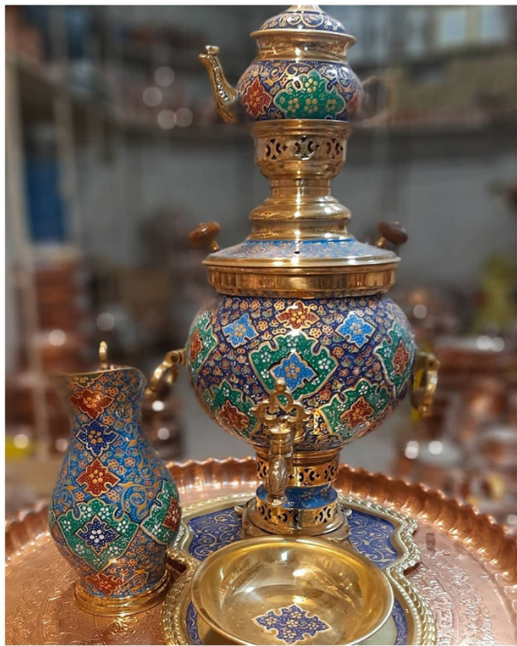
Иранский самовар в технике мина кари.