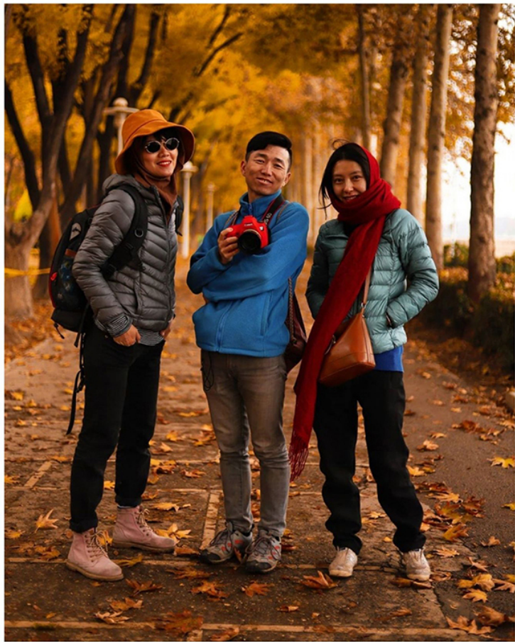
Китайские туристы в Исфахане.