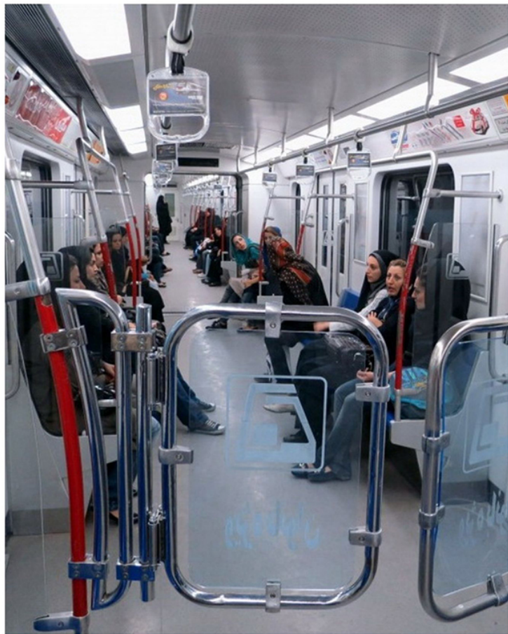
Вагон метро с женской половиной. Вагоны метро в Тегеране смешанные, но два из них отведены исключительно для женщин