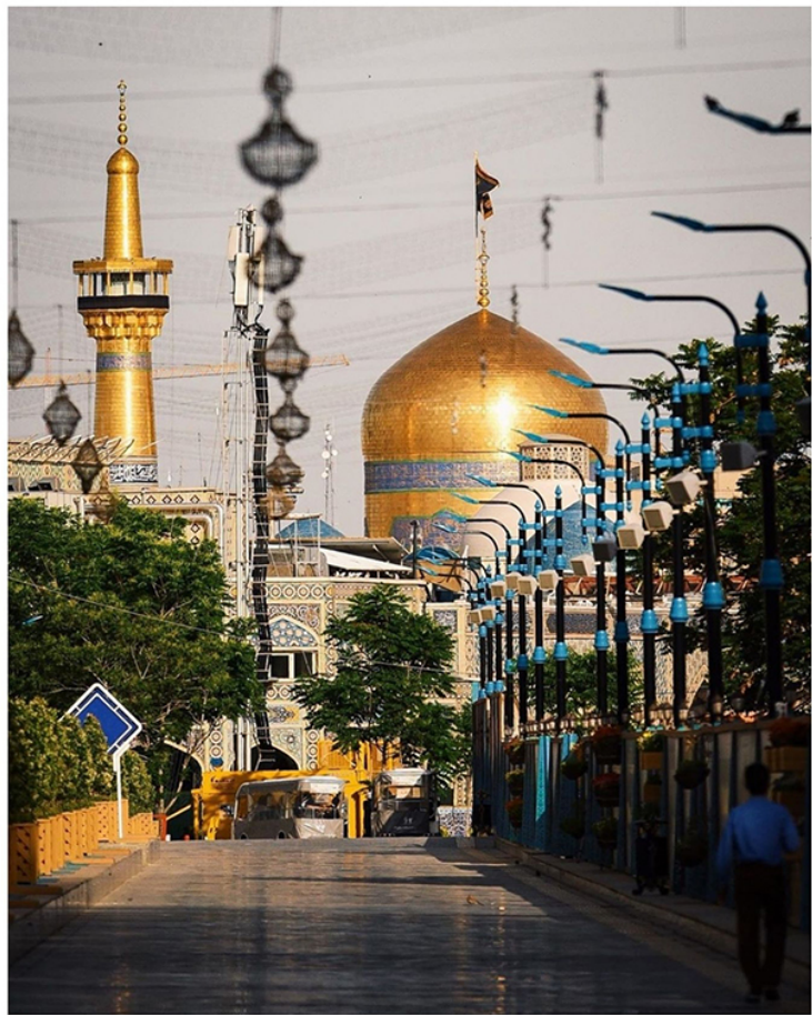
Мавзолей Имама Резы (Остане-Кудсе-Разави или «харам») г. Мешхед