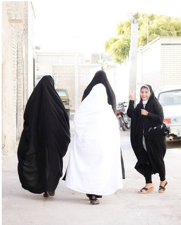
Иранки в чадре на выходе из мечети. Такая одежда обязательна только при посещении мечетей и священных для мусульман мавзолеев.