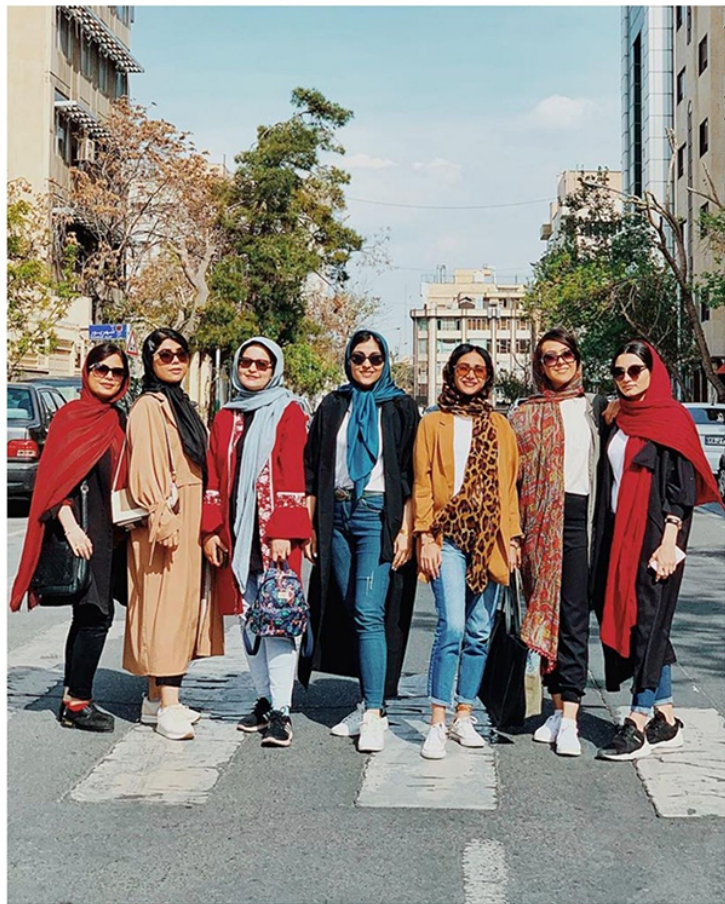
Иранки в современных манто на улице в Тегеране. Еще 10 лет назад все манто были однотонными и одинаковыми. Сейчас они самых разных цветов и их можно носить и в расстегнутом виде.