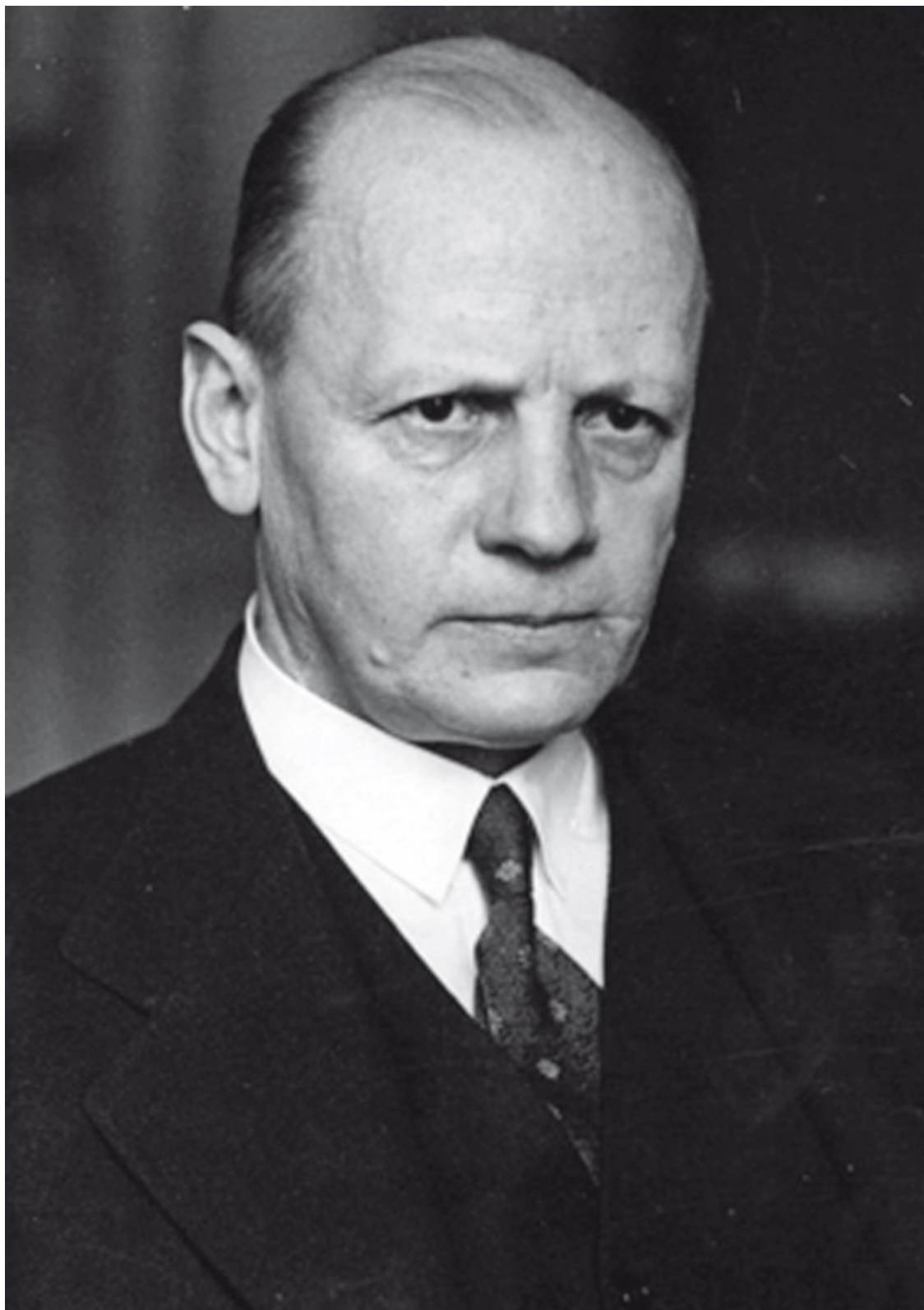
Ганс-Адольф Гельмут Людвиг Эрдманн Вальдемар фон Мольтке (29 ноября 1884, Оппелън, Германская империя – 22 марта 1943, Мадрид, Испания) – немецкий дипломат

После заупокойной службы гроб Пилсудского был установлен на лафет и провезен через всю Варшаву на Мокотовский плац. Похоронная процессия была очень впечатляющей, и потребовалось четыре часа, чтобы пройти по улицам польской столицы. Стоял месяц май, и было уже очень тепло, почти жарко, поэтому медленное продвижение с процессией и продолжитель-