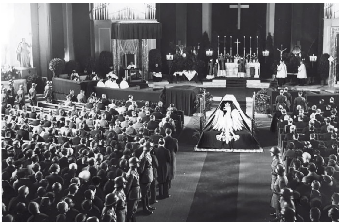
Похороны маршала Пилсудского

На следующее утро состоялась еще одна трехчасовая процессия в Кракове, завершившаяся окончательным опусканием гроба в могилу, подготовленную в Вавельском замке. Министр иностранных дел Бек дал завтрак для иностранных делегаций в «Отель де Франс», на котором я помогал Герингу в нескольких коротких беседах с Петеном, англичанами и Лавалем. Лаваль и Геринг договорились о продолжительном разговоре во второй половине дня.