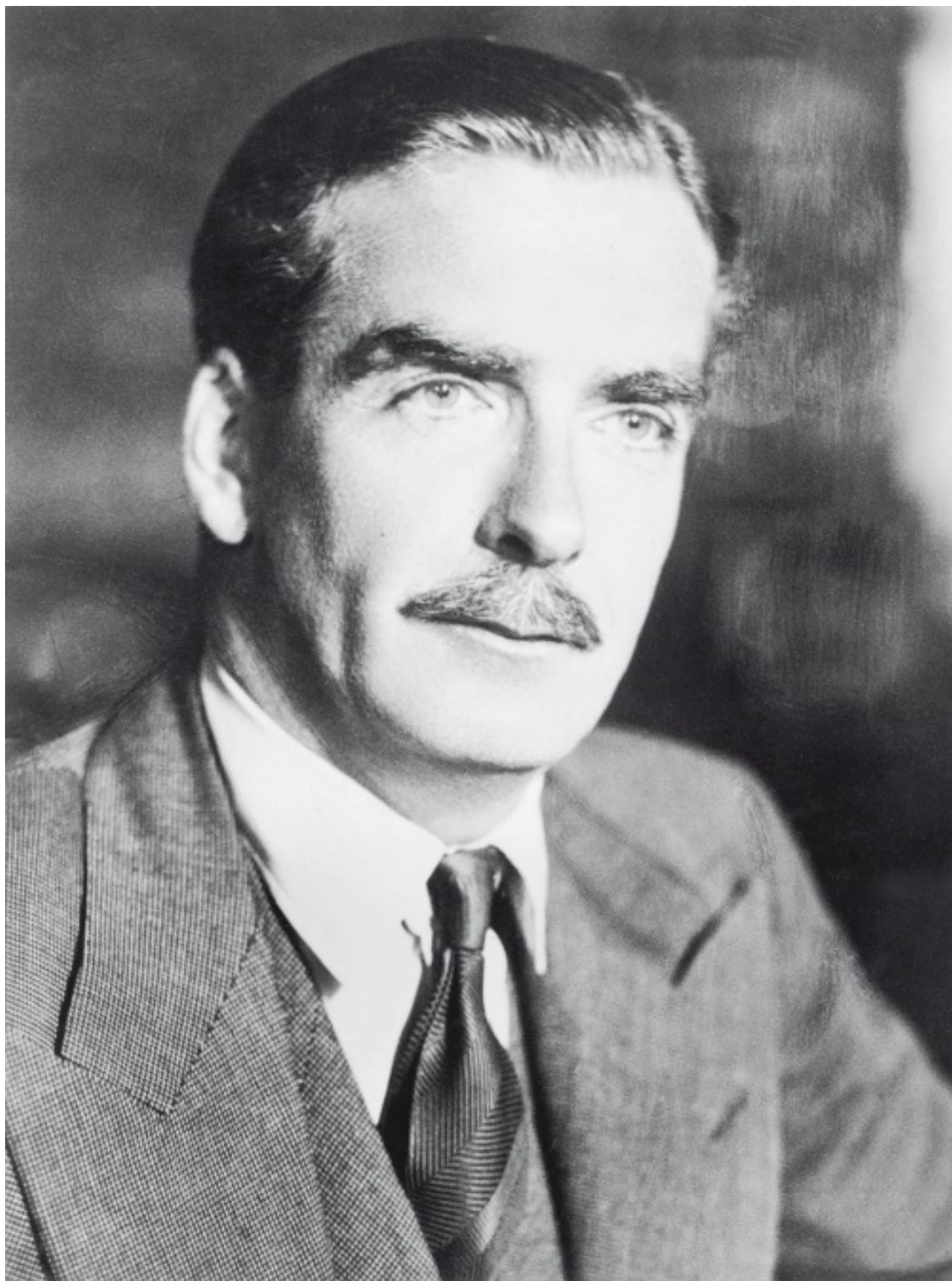
Энтони Иден, 1-й граф Эйвон (12 июня 1897 – 14 января 1977) – британский государственный деятель, член консервативной партии Великобритании

«Вы сегодня были в хорошей форме», – сказал Иден, когда я встретился с ним в холле; мы знали друг друга по многим трудным совещаниям в Женеве.