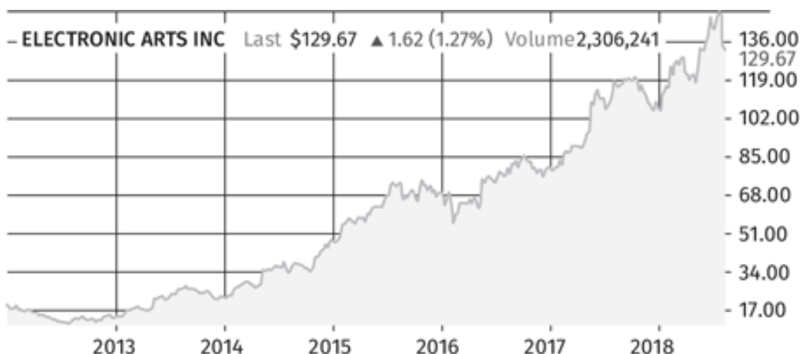
Рис. I.1. Курс акций EA на NASDAQ, январь 2012 г. — июль 2018 г.