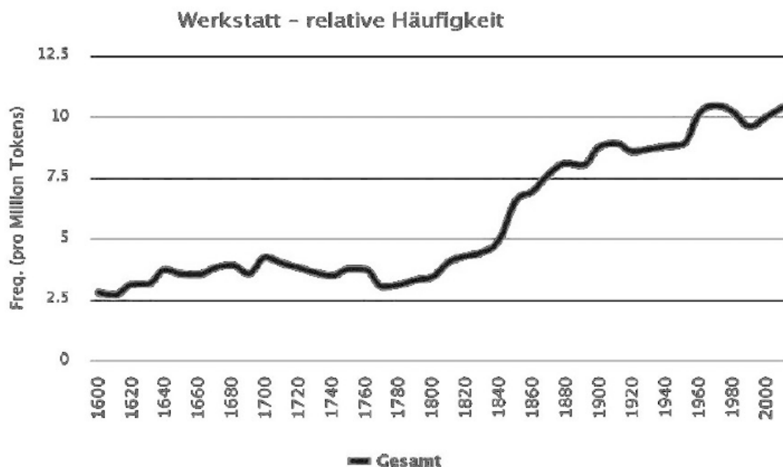
Диаграмма 2: Среднестатистическая частотность употребления слова «Werkstatt» (ремесленная мастерская) в немецком языке на 1 млн. токенов, 1600–2000 гг. 258

Линии роста числа ремесленников в российских цехах с 1722 по 1919 гг. и среднестатистической частотности употребления словосочетания «ремесленная мастерская» в немецком языке на 1 млн. токенов за указанный период времени совпадают в основной своей тенденции динамики и роста.