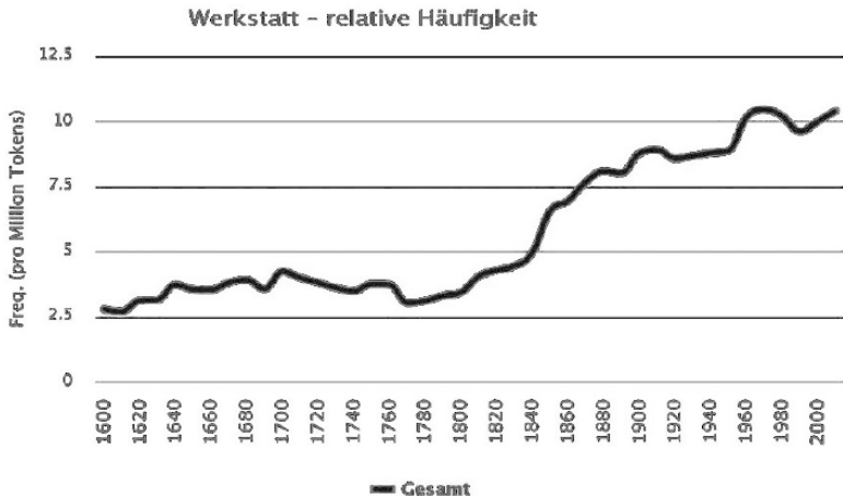
Диаграмма 2: Среднестатистическая частотность употребления слова «Werkstatt» (ремесленная мастерская) в немецком языке на 1 млн. токенов, 1600–2000 гг. 258

Если «Капитал» К. Маркса, а вслед за ним и работа В. И. Ленина «О развитии капитализма в России» (1899) закрыли тему ремесла для истории развития промышленности 259 , то