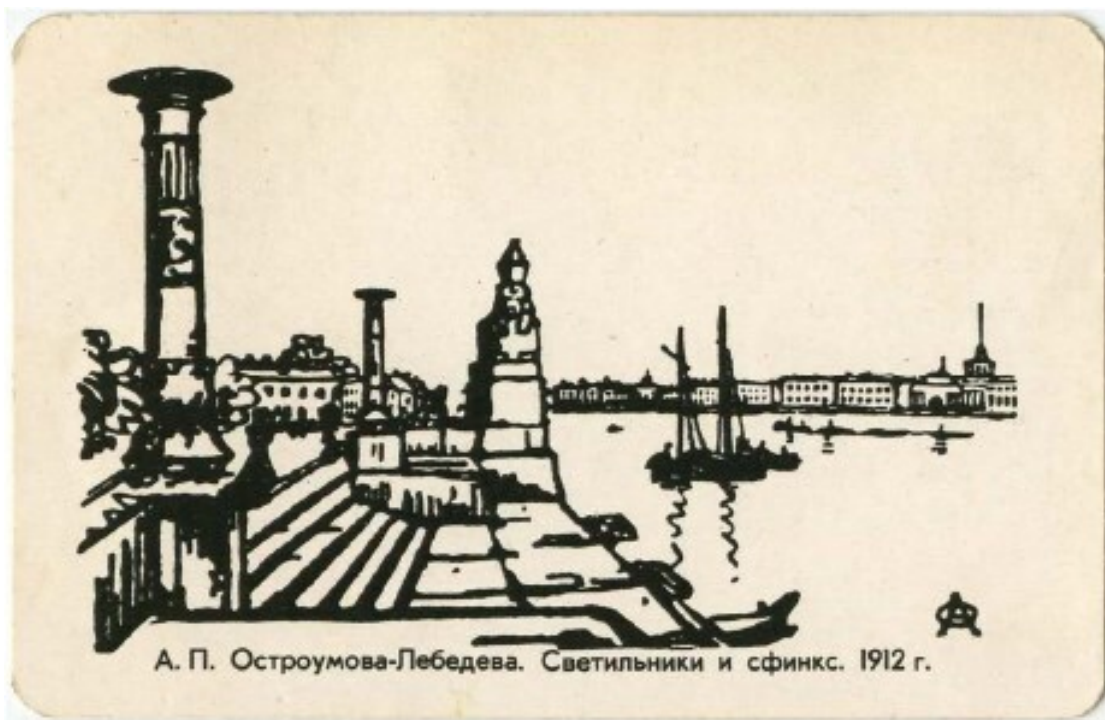
А.П. Остроумова-Лебедева «Светильники и сфинкс»

Жизнь в Духе и служенье Долгу Откроют в Шамбалу дорогу.