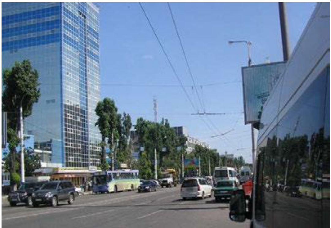
Ленинский проспект на пересечении с ул. Димитрова.