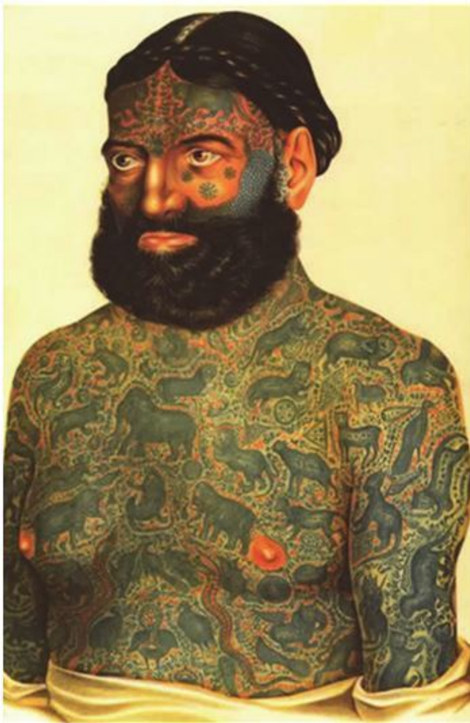
Рис. 1.4. Татуировка. Абориген с Маркизских островов

В тюрьмах всего мира татуировки и сегодня играют серьезную роль, это часть тюремной субкультуры. Они обозначают принадлежность к определенной общности, характеризуют человека, несут информацию «для своих» буквально обо всем: роде занятий, отношении к окружающему, некоторых характерологических особенностях, даже о сексуальных предпочтениях, и, конечно, о самом главном для своей «общности» – причине и длительности наказания, о месте его отбывания. В современном преступном мире «за заслуги» перед криминальным сообществом преступник поощряется нанесением почетной татуировки; в то же время «опускание» сопровождается нанесением позорных татуировок. Таким