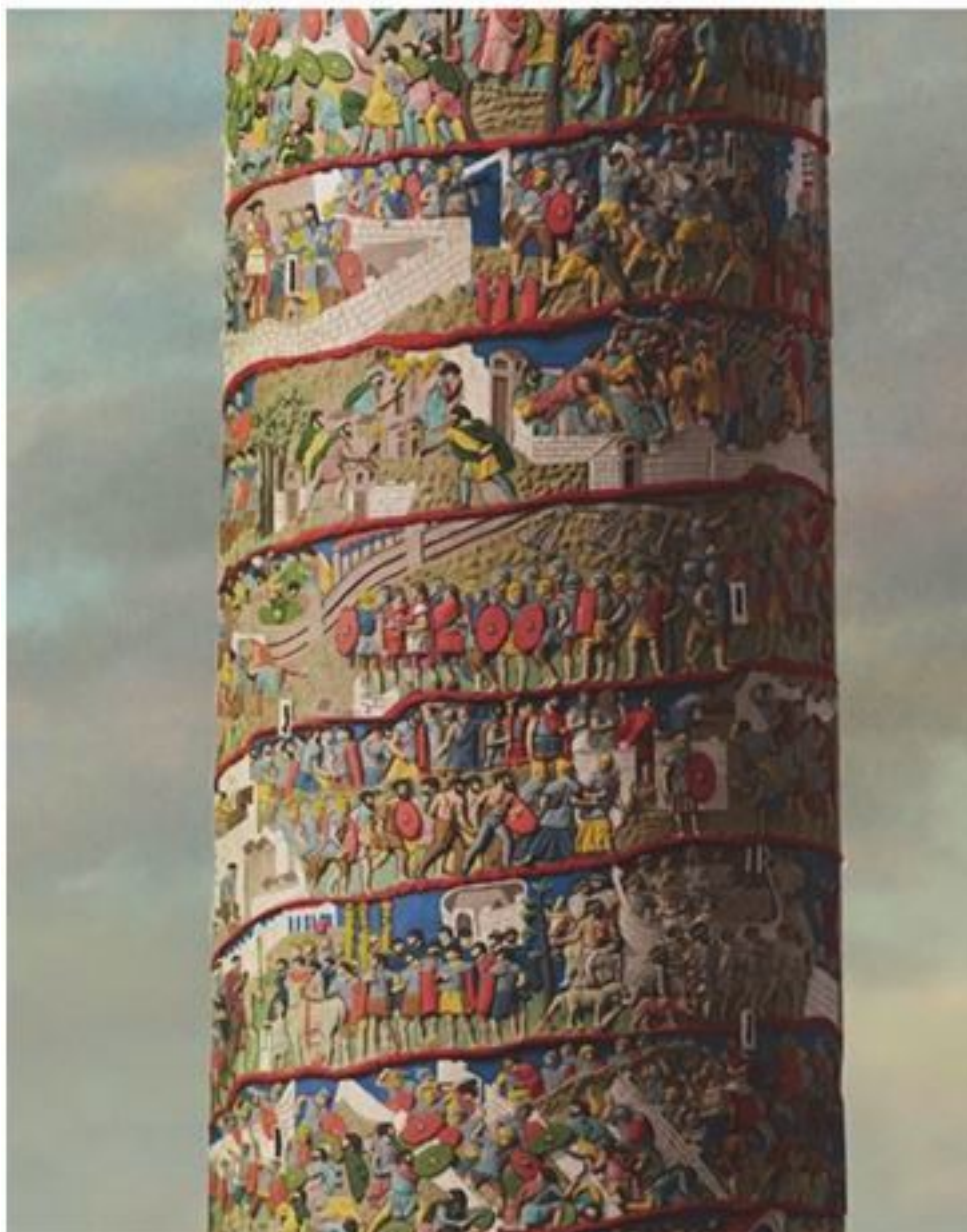
Рис. 2.8. Раскрашенные мраморные барельефы на колонне Траяна (реконструкция). Рим. 113 г. н. э.

Традиция создания «восхвалительных» монументов, скульптур сохранилась до нашего времени, достаточно посмотреть на улицы современных городов и даже сел 20 .