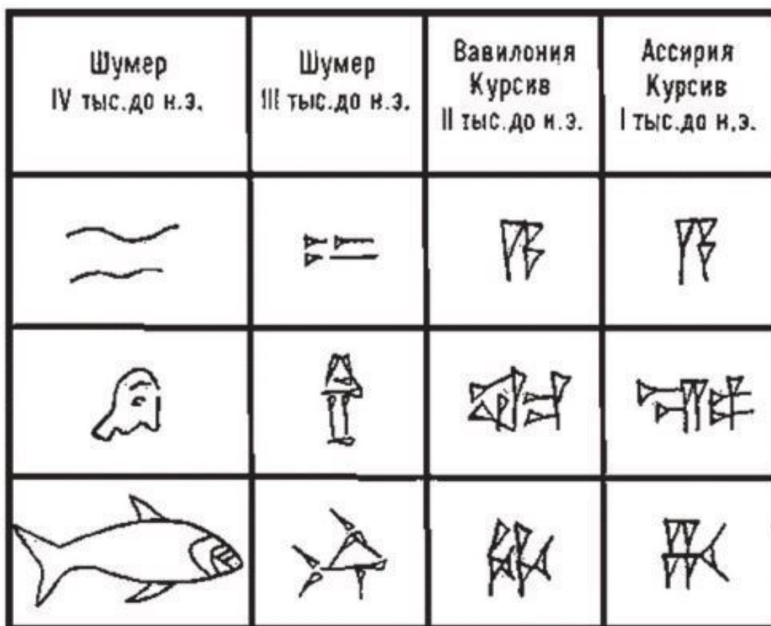
Рис. 2.1. Усиление абстрактности пиктограмм

1. Пиктографическое письмо. Этапом на пути формирования письменности стало письмо на основе изображений (пиктограмм). Зарождение изобразительного искусства произошло еще во времена первобытного общества, до появления государственности (рис. 2.1). Сущность пиктографического письма заключается в том, что с помощью определенного знака выражается некоторое понятие. Например, понятие «человек» может быть передано изображением человека.