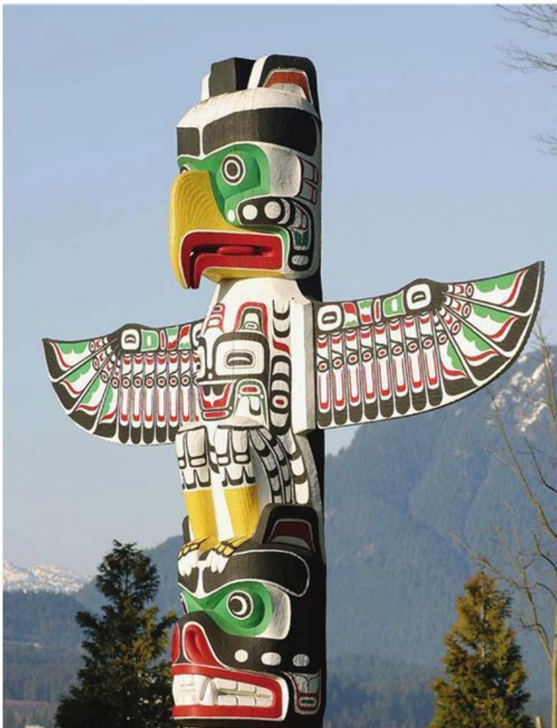
Рис. 1.6. Тотемный столб

Фетиш (от фр. fetich – талисман, амулет, идол) – неодушевленный предмет, который, по представлениям верующих, наделен сверхъестественной магической силой. Фетишизм (поклонение фетишам) является разновидностью магии. Слово «фетиш» появилось в европейских языках в XV в. Изначально в Голландии так называли принадлежности католического обихода: реликвии святых, чудодейственные четки и прочие религиозные святыни. После освоения Западной Африки голландские путешественники стали применять этот термин ко всем объектам (столбам, кускам дерева, камешкам и большим камням, когтям, перьям и т. п.), к которым африканцы относились как к божествам, с верой в их чудодейственную силу. Фети-