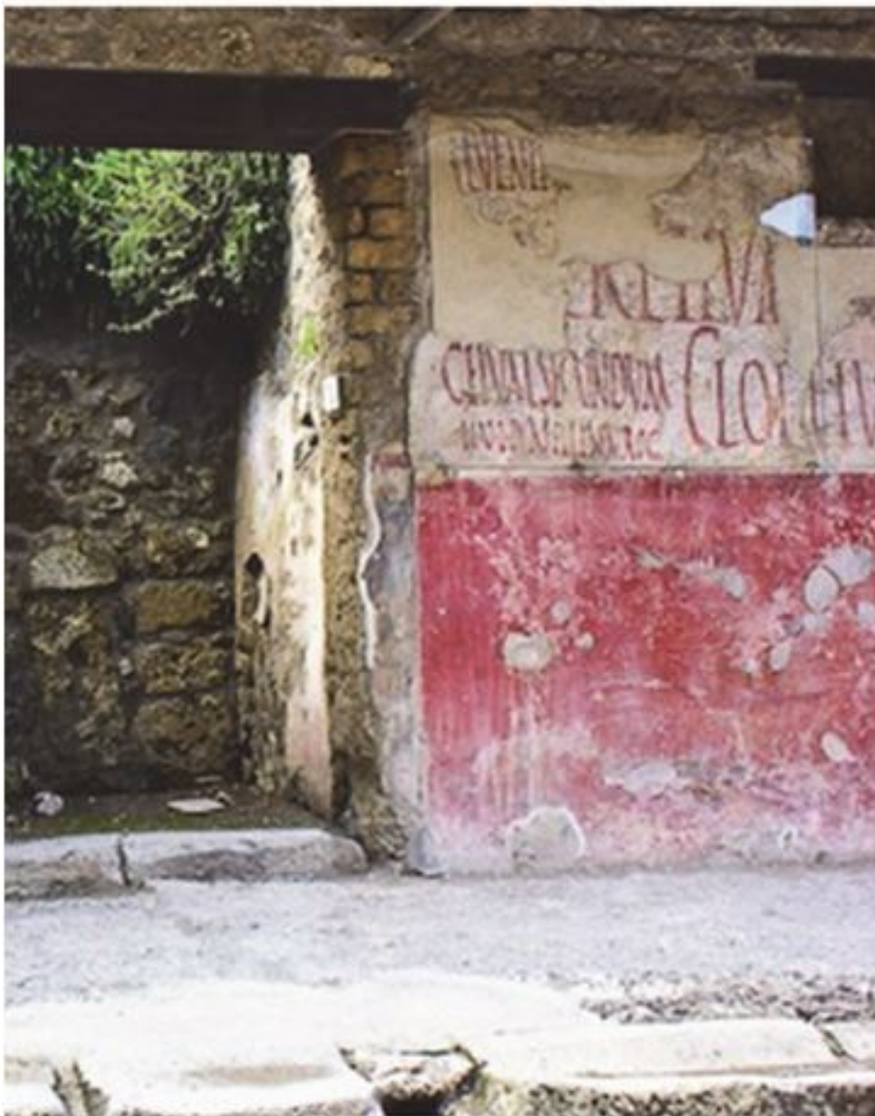
Рис. 2.10. Граффити в древних Помпеях. Современная фотография

Помимо коммерческой, в Помпеях нашли много образцов политической рекламы: город готовился к выборам главы городской администрации – эдила.