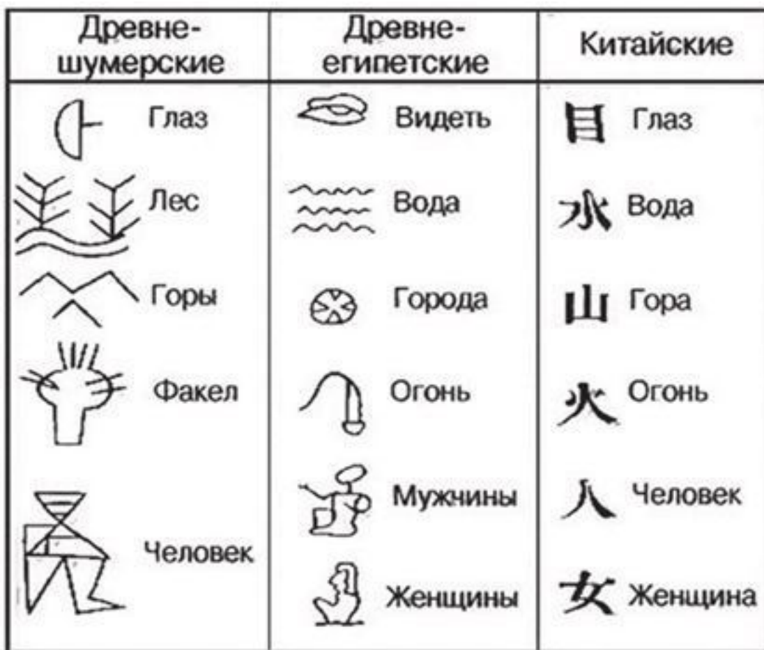
Рис. 2.2. Трансформация знака: от пиктограммы к иероглифу

4. Слоговое письмо. Значительным шагом на пути сближения устной и письменной речи стало формирование слоговой письменности. Наиболее известными слоговыми письменностями являются клинописные (древнеперсидская, аккадская) и другие наследники шумерского письма.