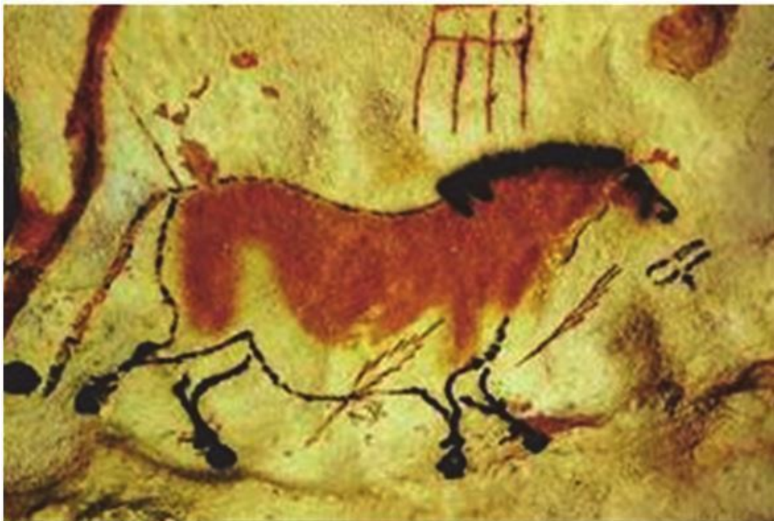
Рис. 1.2. Наскальная живопись в пещере Альтамира (Испания)

Итак, в древности, на пересечении полей магии и коммуникации, возникла протореклама как технология демонстрации социально значимых качеств объекта в целях информирования окружающих и оказания влияния на их сознание и поведение. Это была начальная точка генезиса рекламы. Презентационные технологии, основанные на использовании знаков и символов, еще не выполняли одну из основных экономических функций – социальный обмен продуктами труда. Но они помогали людям решать ряд социальных задач: идентифицировать партнера по взаимодействию, налаживать коммуникацию с ним, выстраивать иерархию в отношениях, заявлять свои права и претензии, обозначать зоны ответственности и т. д.