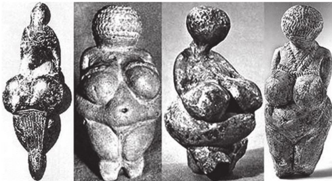
Рис. 1.1. Палеолитические Венеры

Необходимость в такой наглядной презентации возникла в связи с ростом численности людей, все более частыми контактами с чужаками, вольным, а чаще – невольным расширением круга общения. Рост объема коммуникаций требовал совершенствования коммуникационных возможностей. Наглядная демонстрация социально-значимых свойств объекта посредством знаков и символов – одна из таких возможностей. «Демонстративность... упрощает коммуникацию, в одно мгновение делая понятным по особенностям одежды, украшений, прически и символики с кем предстоит иметь контакт» 7 , – пишут современные исследователи. Но знако-символическая демонстрация имела целью не только идентификацию человека или группы, но и воздействие на поведение окружающих. Например, человеку со знаками высокого социального статуса должно было быть оказано особое почтение, при виде воина со множеством скальпов у пояса встречные должны были испытывать страх и т. п.