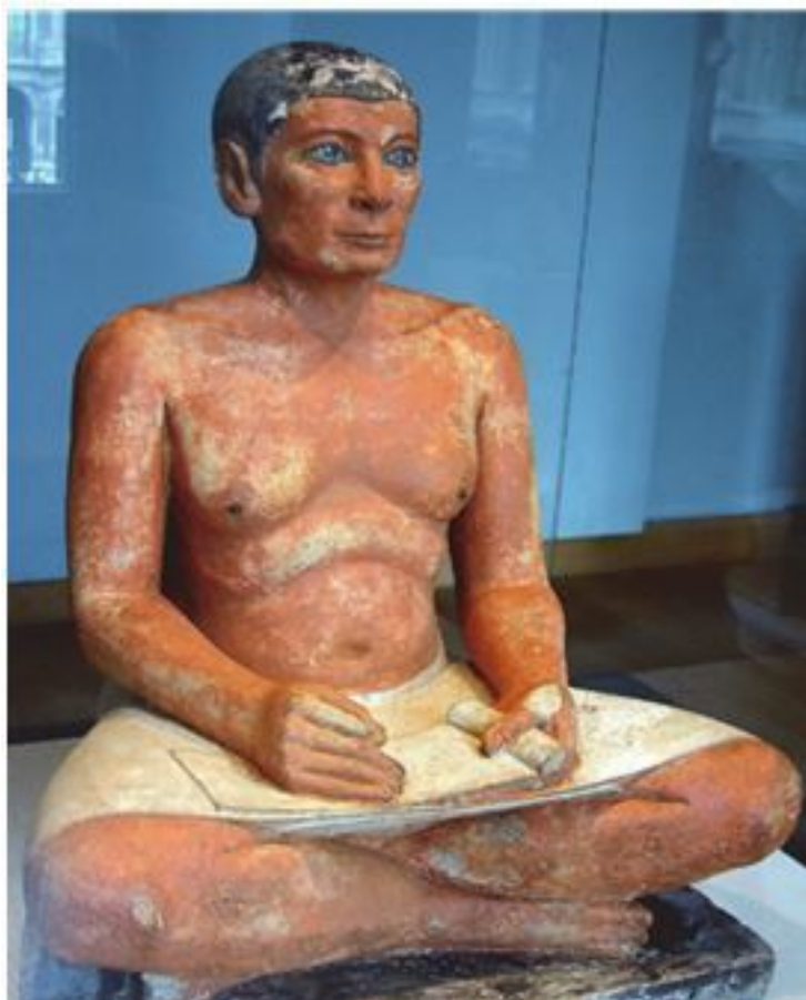
Рис. 2.5. Статуя царского писца Кай из Саккары. Раскрашенный известняк. Середина третьего тыс. до н. э. Париж. Лувр