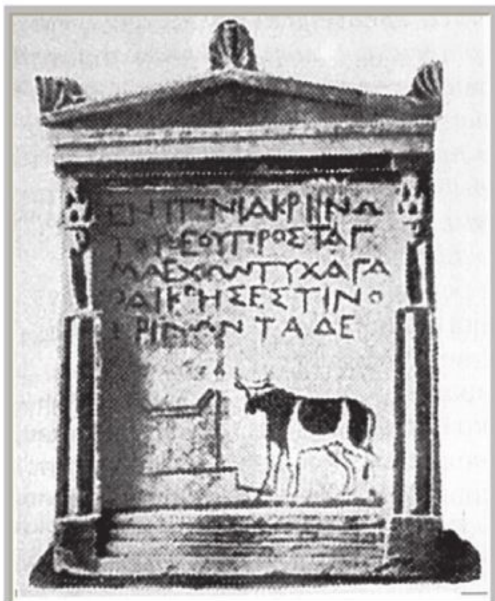
Рис. 2.9. Вывеска гадателя. Мемфис. III в. до н. э.

Существовали рекламные объявления и на бумаге (точнее – папирусе). Первое из известных – египетское объявление о продаже «честного и покорного раба, соблюдающего умеренность в пище», хранящееся ныне в Британском музее. Настоящий рекламный текст написали на папирусе египетские торговцы слоновой костью: «Дешев, очень дешев в этом году благородный рог исполинов девственных лесов и долин Экехто. Идите ко мне, жители Мемфиса, поглядите, полюбуйтесь и купите!». Этот текст построен, фактически по формуле эффективной рекламы AIDA (внимание – интерес – желание – действие), предложенной рекламистами в конце XIX в. Особенно выразительна последняя фраза, призывающая к прямому действию.