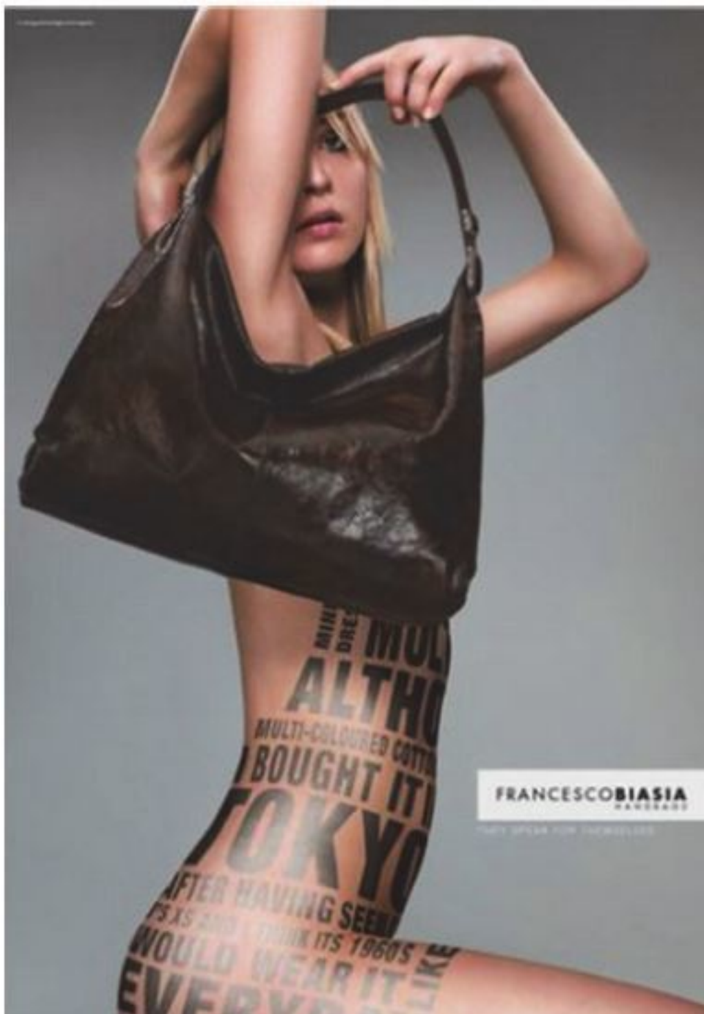
Рис. 1.5. Использование татуировок в рекламе сумок Francesco Biasia

Власть в первобытном обществе в отличие от власти в государственном образовании была потестарной (от лат. potestas – мощь); значительную роль в получении значимого социального статуса играли физическая сила, способность переносить боль, нагрузки. Вожди, взрослые мужчины с гордостью выставляли напоказ боевые шрамы, полученные на охоте повреждения. Молодой же человек должен был доказать свою силу и терпение во время обряда инициации (вхождения во взрослый статус). Нередко обряд сопровождался нанесением особых шрамов на теле, которые потом специально растравляли, чтобы сделать этот предмет гордости более заметным.