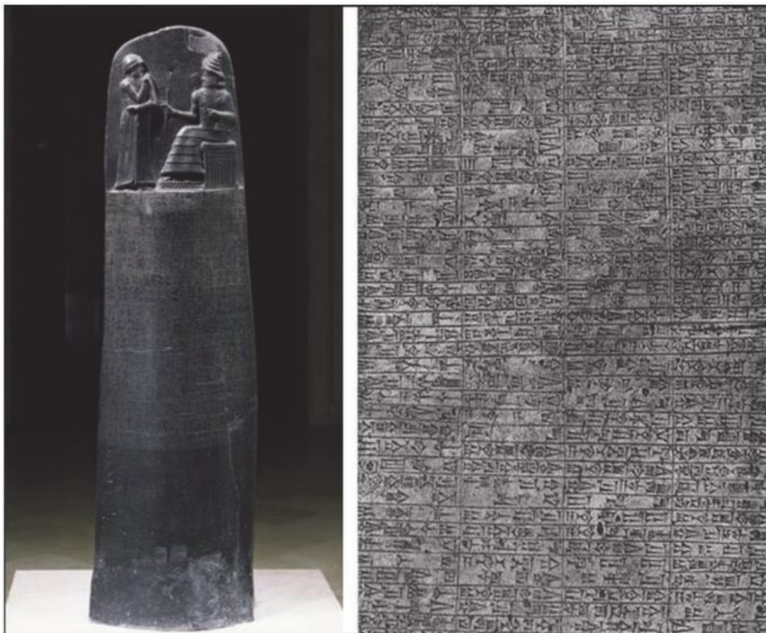
Рис. 2.4. Стела с высеченными клинописью законами Хаммурапи. Клинописный текст занимает обе стороны монумента. На барельефе изображен царь Хаммурапи, стоящий перед богом Шамашем. Бог передает ему свиток с законами. Париж. Лувр

Развитие экономики в этот период шло в направлении роста так называемой товарности хозяйства. Рассмотрим этот процесс на примере Древней Греции. Хозяйство гомеровского периода (XI–IX вв. до н. э.) основывалось на семейном натуральном хозяйстве. Мерилом богатства был скот. Почти все произведенное потреблялось на месте самими производителями, членами их семей или использовалось для натурального обмена, в основном с соседями. Причина натуральности хозяйства – низкая производительность труда из-за несовершенных технологий, слабой специализации труда (одно семейное хозяйство занималось и земледелием, и скотоводством, и ремеслом). Прибавочный продукт был невелик, обмен излишков носил эпизодический характер, поэтому налаживать связи с дальними контрагентами не было смысла. В укрепленных поселениях – полисах – жили в основном земледельцы и скотоводы, торговцев и ремесленников почти не было.