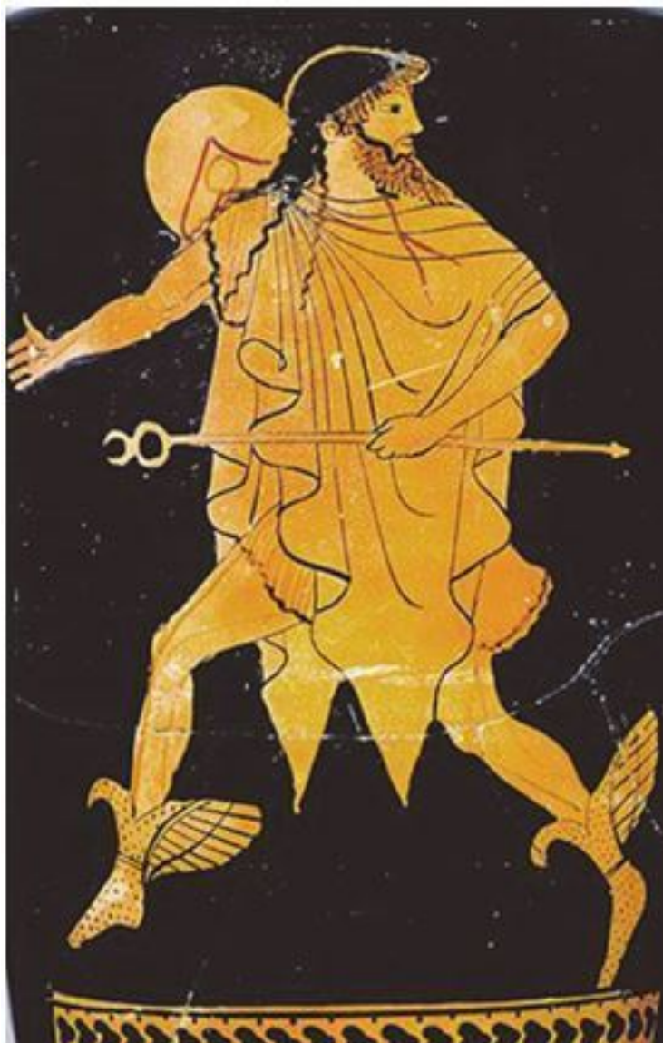
Рис. 2.6. Бог Гермес – глашатай олимпийских богов. Рисунок на вазе. Древняя Греция

Но к концу этого периода произошла технологическая революция – греки освоили выплавку железа (на 400 лет позже, чем египтяне). Этот твердый металл, ранее использовавшийся только для украшений, вошел в жизнь людей сначала в виде оружия, затем – как прочные сельскохозяйственные (плуг, серп) и ремесленные орудия (молоток, сверло, долото и т. д.). Новые приемы обработки земли позволили распахать новые площади, резко повысили сбор урожая; стало возможным внедрить новые культуры (например, оливки). Ускоренными темпами развивалось ремесло (металлургия, кузнечное дело, производство керамики, строительство и др.), оно стало выделяться в особые отрасли. Семейные хозяйства предпочитали ориентироваться не на производство всех нужных для собственного потребления продуктов, а на максимальное производство продуктов, изначально предназначенных для обмена. Появился слой людей (торговцев), которые сами не производили продукцию, однако профессионально организовывали ее обмен сначала на другие продукты, затем – на деньги (продажа). Так сформировался рынок (в экономическом смысле слова): пространство социальных взаимодействий, в рамках которого происходит обмен продуктами, произведенными для продажи (товарами). По мере развития рынка возникла необходимость в рыночной инфраструктуре (видах деятельности) и в организациях, которые способствуют товарному обмену.