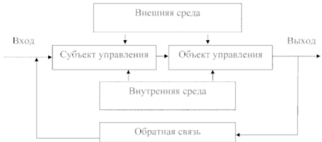
Рис. 1.5. Схема системы с механизмом управления

При этом любая система управления должна иметь четыре основных элемента: