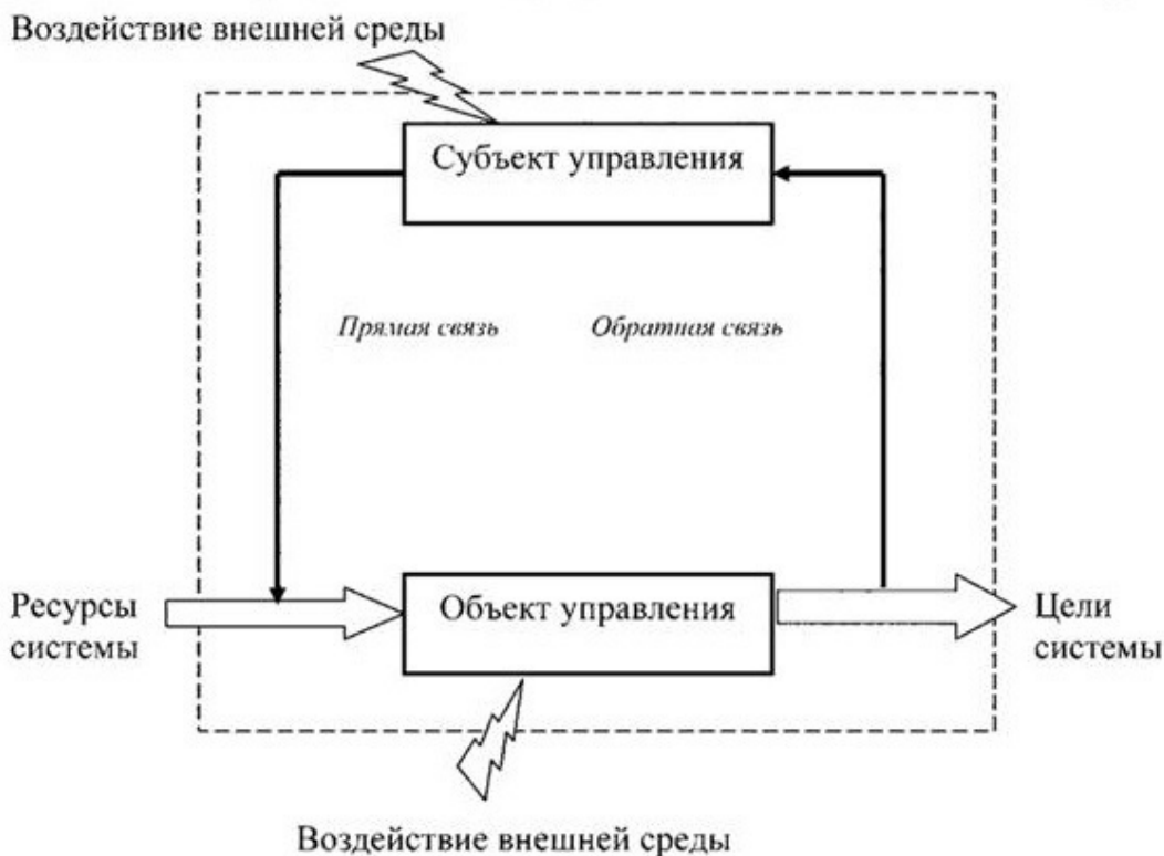
Рис. 1.2. Система управления организации в виде контура управления

Управленческое взаимодействие может только в случае, если объект управления выполняет команды системы управления.