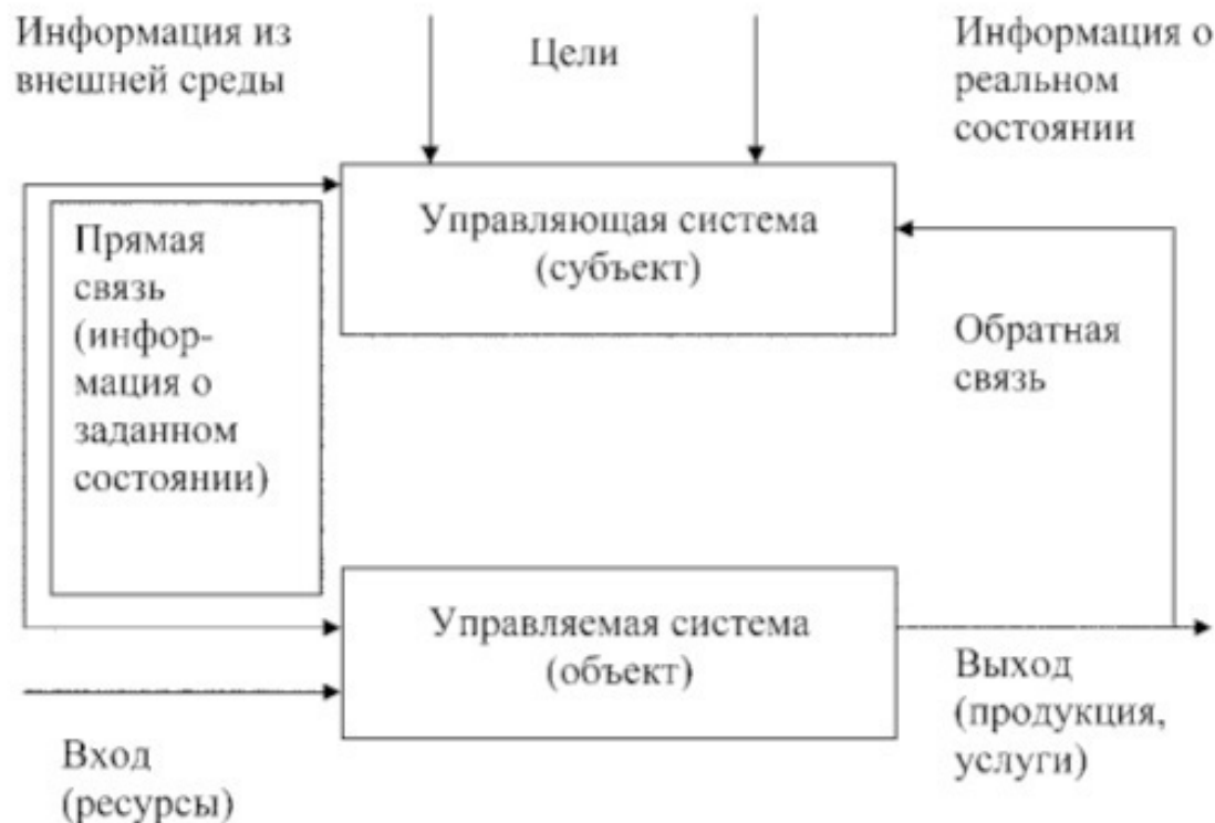
Рис. 1.6. Схема системы управления организации

Очевидно, что именно система управления организации имеет возможность адекватно реагировать на внешние и внутренние воздействия, что придает организации способность к адаптации в изменяющихся условиях, делает ее саморегулируемой.