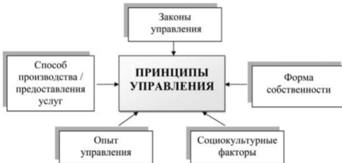
Рис. 1.3. Механизм формирования принципов управления

Как видно из схемы, на содержание принципов управления оказывают существенное влияние не только известные современной науке законы управления и накопленный опыт, но и существующие на данный момент времени способы осуществления производственной деятельности, форма собственности на средства производства, а также социокультурные факторы.