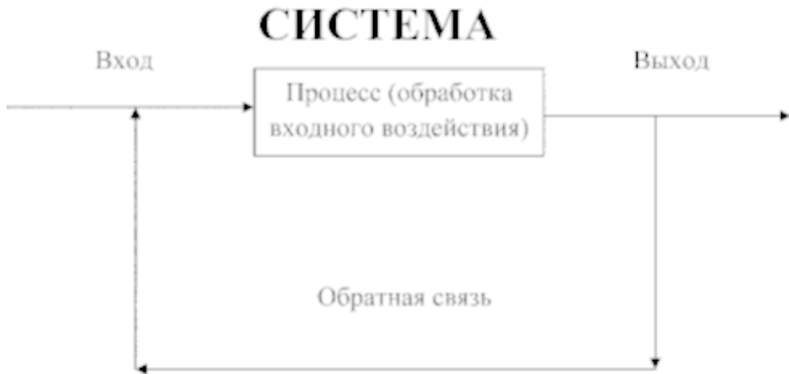
Рис. 1.4. Схема функционирования системы

Управление – это процесс воздействия на систему с целью поддержания заданного состояния или перевода ее в новое состояние. Система управления это: