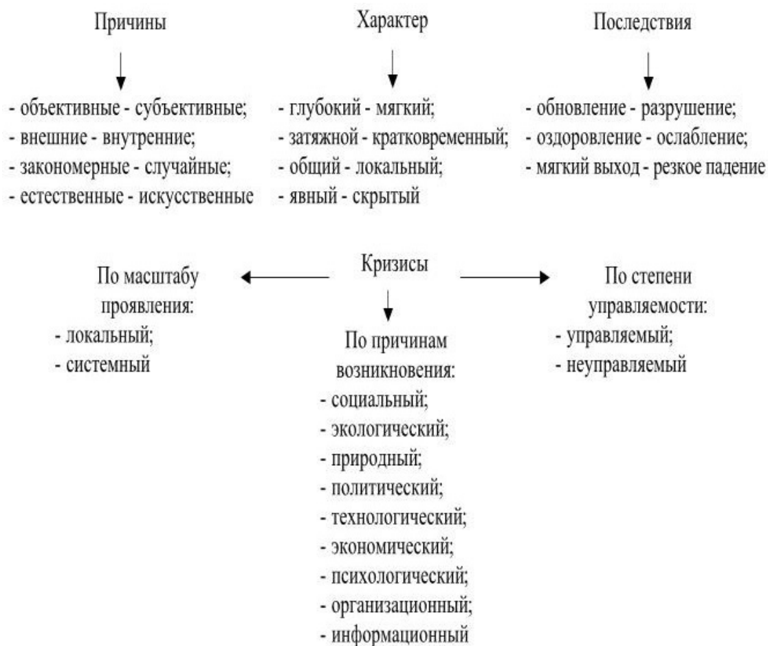
Рис. 1. Типология кризисов 2

В 90-х гг. XIX в. Российская империя переживала бурный рост. Появлялись новые промышленные предприятия, активно строились железные дороги, в страну пришли иностранные инвесторы. Рост экспорта сельскохозяйственной продукции способствовал притоку в Россию валютной выручки. Была успешно проведена конверсия облигаций государственных займов. В 1895–1897 гг. в России была осуществлена денежная реформа. Рубль начал обмениваться на золото, он стал устойчивой конвертируемой валютой. Это привлекло зарубежных биржевых игроков.