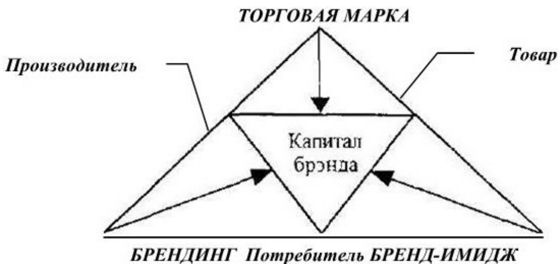
Рис. 1. Аспекты, характеризующие сущность бренда

Под брендом следует понимать отображение продукта (фирма, товар или услуга), имеющего уникальное название и символические идентификаторы (торговая марка, логотип, дизайн упаковки) в массовом сознании. Современное понимание бренда включает в себя несколько аспектов: механизм дифференциации товаров; механизм сегментации рынка; образ в сознании потребителей (бренд-имидж); средство взаимодействия (коммуникации) с потребителем; средство индивидуализации товаров, компаний 8 ; система поддержания идентичности; правовой инструмент; часть корпоративной культуры компании; концепция капитала бренда; элемент рынка, развивающийся во времени и пространстве. Вышеперечисленные аспекты позволяют понять бренд как нечто сложное, многогранное, хотя предложенные аспекты не отражают бренд как единое и целостное явление. Аспекты, характеризующие маркетинговую сущность бренда, можно представить в виде логической схемы (рис. 1).