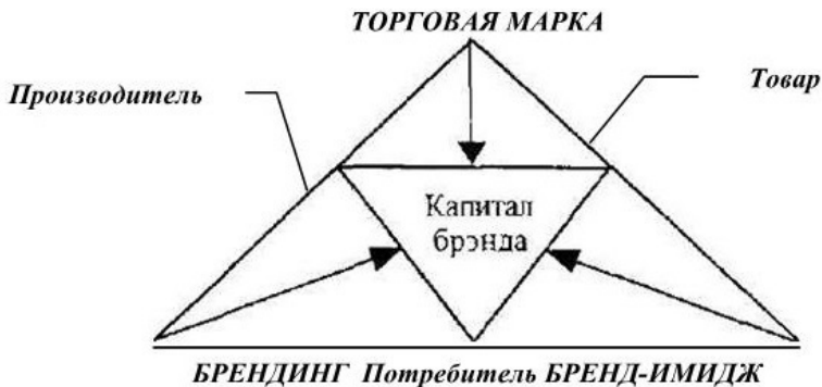
Рис. 1. Аспекты, характеризующие сущность бренда

ной культуры компании; концепция капитала бренда; элемент рынка, развивающийся во времени и пространстве. Вышеперечисленные аспекты позволяют понять бренд как нечто сложное, многогранное, хотя предложенные аспекты не отражают бренд как единое и целостное явление. Аспекты, характеризующие маркетинговую сущность бренда, можно представить в виде логической схемы (рис. 1).