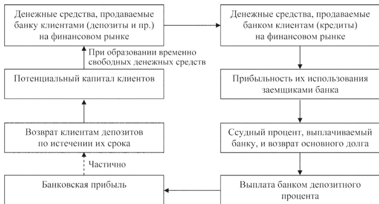
Рис. 2. Взаимосвязь депозитных и ссудных операций коммерческого банка

ния базовых основ кредитования: возвратности, платности, срочности, обеспеченности и по возможности целевой направленности предоставляемых банком кредитов.