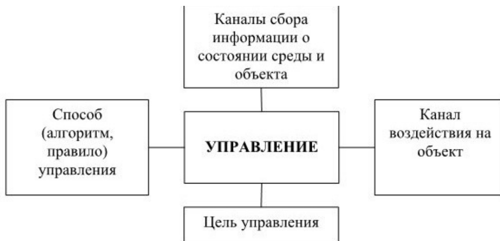
Рисунок 1.1. Элементы процесса управления.

Первоначальное понятие содержания диссертации, которое является базовой компетенцией самой организации, устанавливает элементы процесса управления (рисунок 1.1).