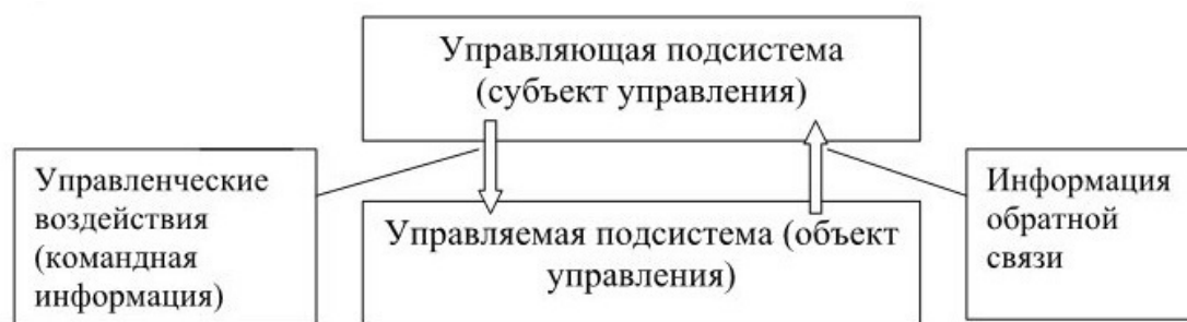
Рисунок 1.2. Структура управленческого процесса.

Любая система рассматривается как единство управляющей подсистемы (субъекта управления) и управляемой – объекта управления, основанная на принципе обратной связи, характеризующем информационную и пространственно-временную зависимость (рисунок 1.2).