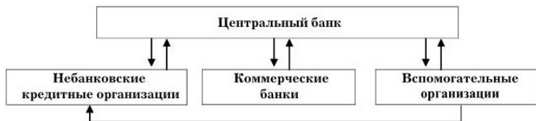
Схема 1.1. Структура банковской системы

Сказанное схематически можно представить следующим образом.