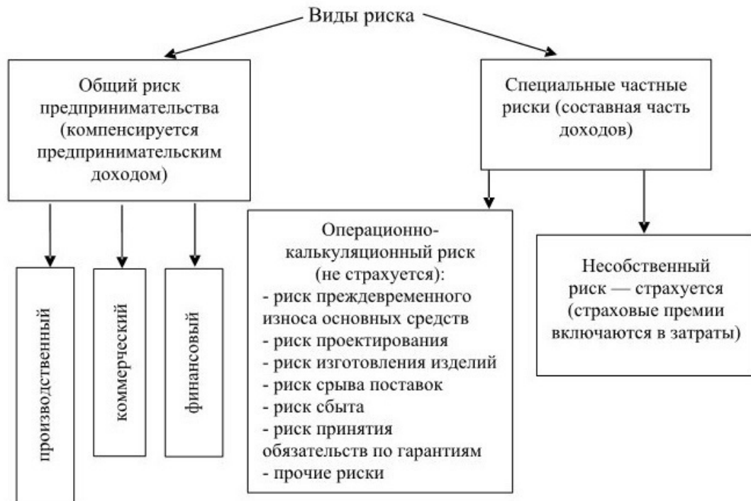
Рис. 1.1. Классификация рисков

Особенно важен в предпринимательской деятельности учет финансового риска (рис. 1.2).