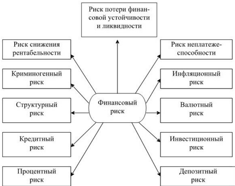
Рис. 1.2. Основные виды финансового риска

Снижение риска осуществляется при помощи механизмов нейтрализации (рис. 1.3).