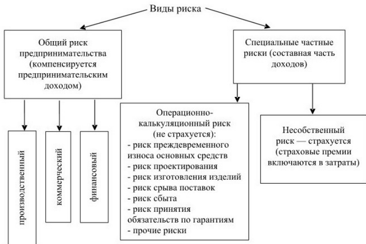
Рис. 1.1. Классификация рисков

Особенно важен в предпринимательской деятельности учет финансового риска (рис. 1.2).