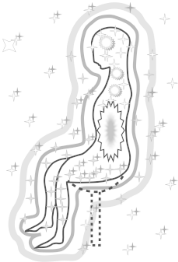
Рис. 1. Медитация «Внутренний алмаз» и «Энергетический кокон»