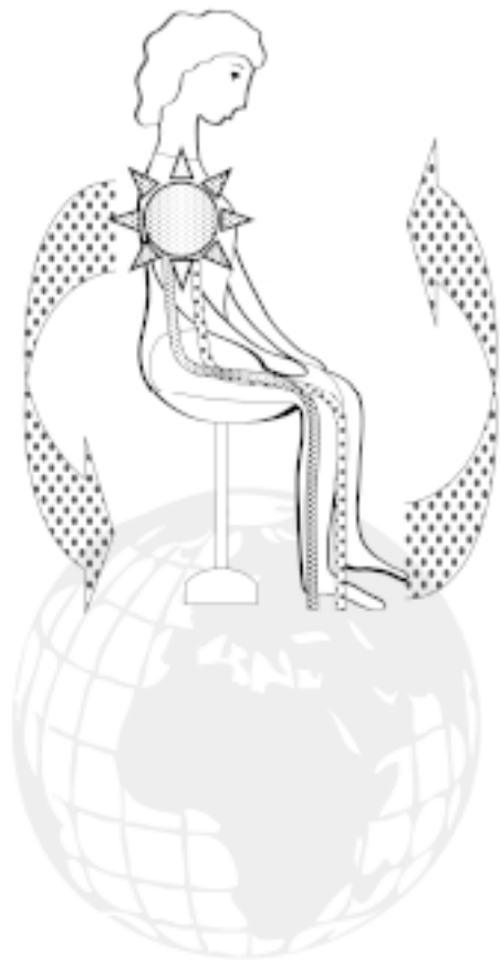
Рис. 3а. «Лотосовое дыхание»

Во время следующего вдоха втяните прохладную голубую энергию земли по корням лотоса в почки, на выдохе отдайте