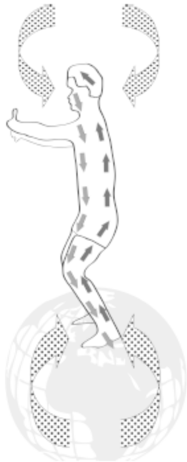
Рис. 3б. Цигун «Железная рубашка». «Обхватывание дерева»