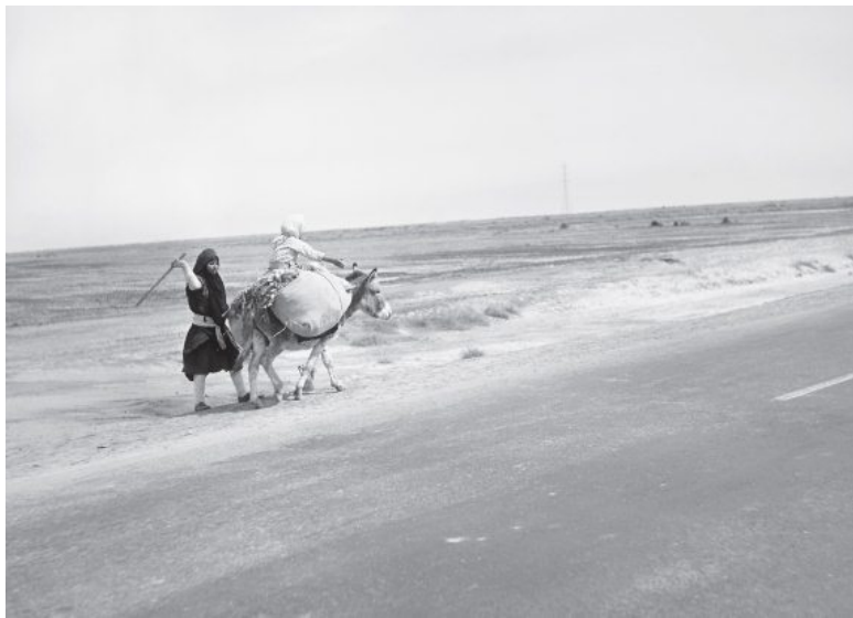
Илл. 4. Месопотамская равнина близ города Бейджи (Ирак)

Это хорошо показал в своей краткой, но эмоционально насыщенной характеристике своеобразных природно-климатических условий Ирака немецкий историк Э. Церен. «Когда на севере в горах Армении, – пишет он в «Библейских холмах», – весной начинает таять снег, вода в реках прибывает. Половодье на Тигре начинается обычно в марте, на Евфрате – в апреле.