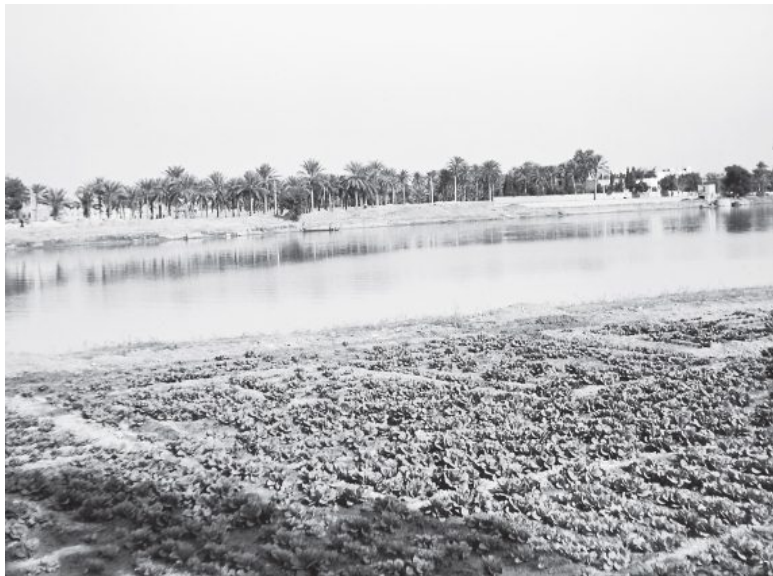
Илл. 1. Река Евфрат в нижнем течении, в районе современного города Эн-Насирии, близ древнего Ура

Разлив рек начинается в Месопотамии весной, в марте-апреле, когда в горах тает снег и обильно идут дожди. Первым разливается Тигр, на две недели позже – Евфрат. В отличие от Нила, наибольший паводок на месопотамских реках приходится на период созревания основной части зерновых культур, и поэтому нормальный цикл земледельческих работ возможен здесь лишь в том случае, если речная вода будет