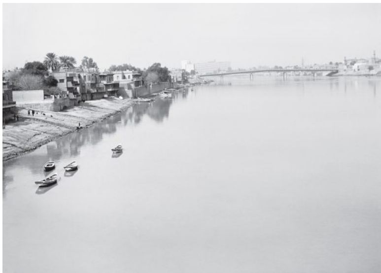
Илл. 2. Река Тигр в районе Багдада

лодно, время от времени налетают ураганные ливни. Реки, однако, не наполняются до самой весны, когда их притоки начинают питаться за счет таяния снегов в горах Загроса и Тавра. Наступает пора весеннего разлива.