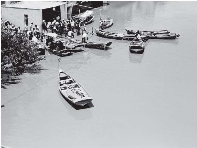
Илл. 3. Рыбачьи лодки на Тигре

Эти явления природы шумеры издревле объясняли действиями богов и борьбой между ними. Кто как не Энлиль, бог, живущий в горах, бог земной тверди, создает сушу, борется за ее торжество над водной стихией?