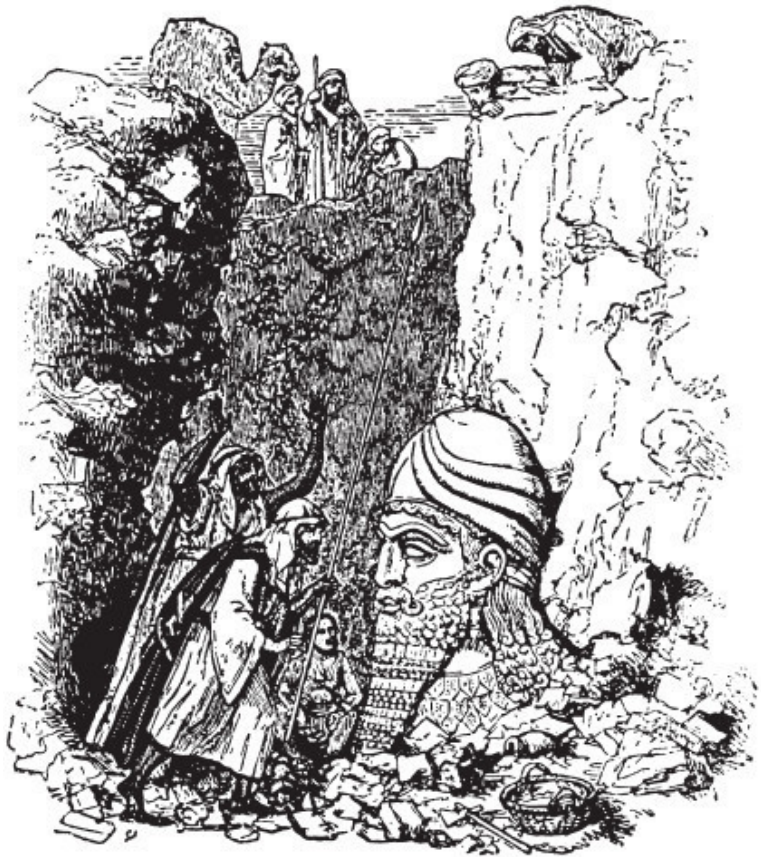
Илл. 9. «Голова Нимрода». Раскопки О.Г. Лэйярда в Ним- руде