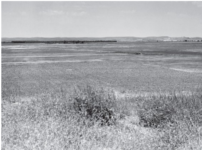
Илл. 5. Синджарская долина на северо-западе Ирака

Утро встретило нас обложным дождем и холодом. Температура не больше 10 градусов, но к полудню дождь перестал, вышло солнце, и началась изнуряющая, хуже сухой жары, парилка – выпаривание избытков влаги из окрестных полей.