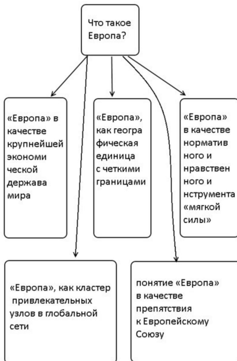
Схема 1. Трактовки европейской идентичности

Итогом анализа комплекса исследований идентичности европейцев, проведенных в разные годы европейскими аналитическими центрами, стало возможным выделить уже рассмотренные принципы формирования идентичности «европейца», а также сформулировать две базовые платформы формирования идентичности – культуралистскую и структуралистскую.