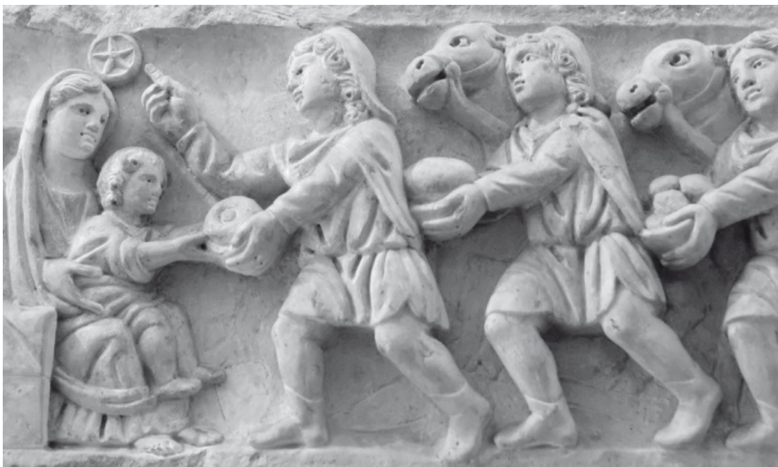
Поклонение волхвов. Римский горельеф, IV век

Но все это впереди. Пока Иисус – младенец, нежно любимое дитя Марии и Иосифа. Он родился в яслях для скота, его посетили волхвы и принесли драгоценные дары, а теперь он бежит от Ирода и от Рима 10 .