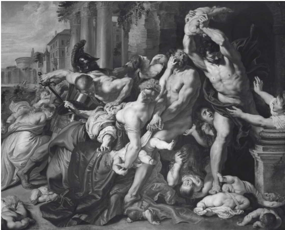
Избиение младенцев. Питер Пауль Рубенс. 1609–1610 гг.

Избавляться от младенцев войны намерены ударами мечей. Все они вооружены иудейской разновидностью острых, как бритва, pugio и gladius , какими пользуются в римских легионах; сейчас меч висит у каждого на поясе. Впрочем, мечами или кинжалами никакие правила их не ограничивают. Любой воин может, если пожелает, раздробить младенческую головку камнем, сбросить ребенка со скалы или просто придушить голыми руками.