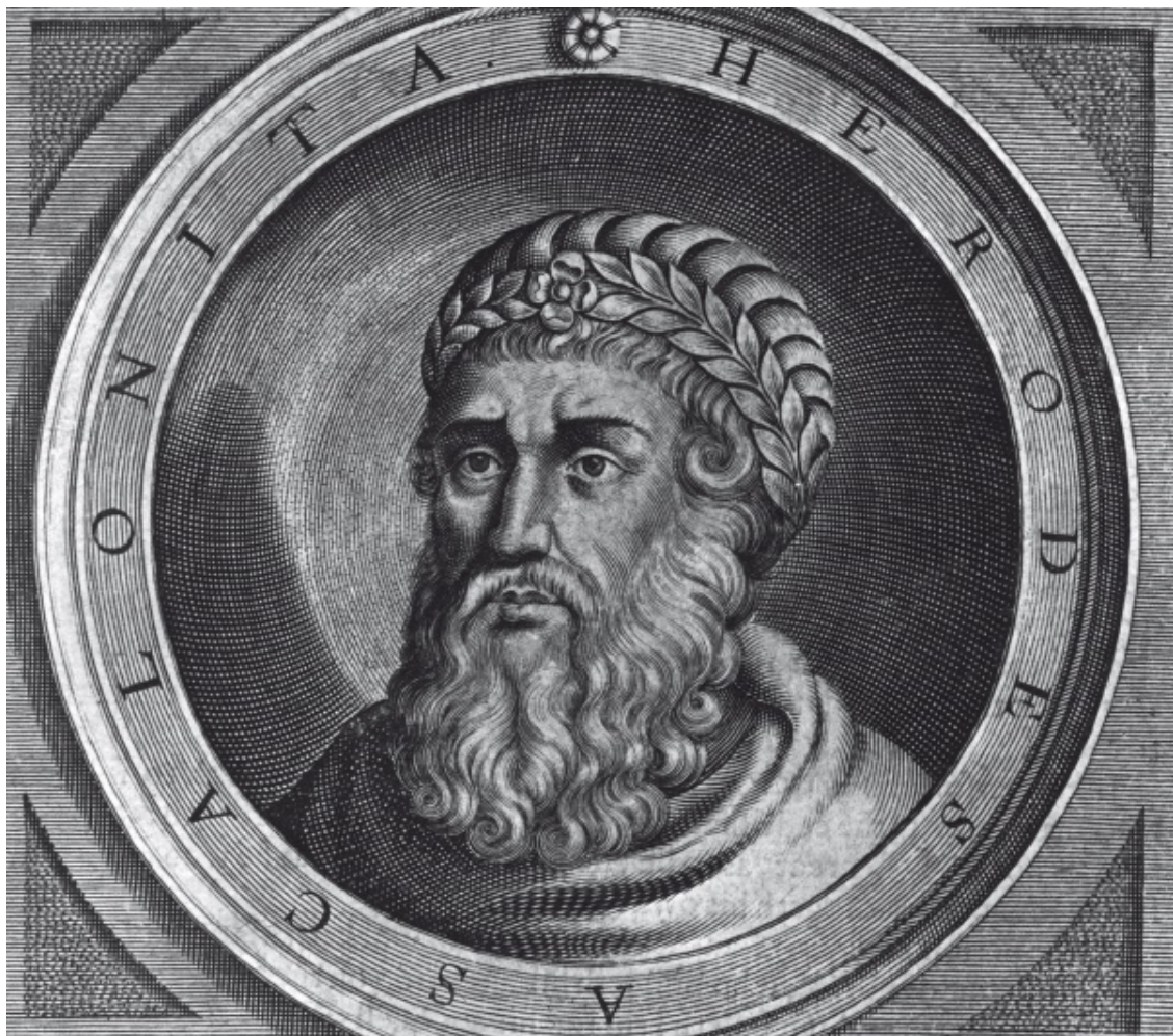
Ирод Великий. Гравюра

руками. Но Ирод уже не тот, что прежде. Ему шестьдесят девять лет. Он безобразно тучен и очень болен – болен так, что уже не выходит из дворца, не говоря уж о том, чтобы садиться в седло. Уродливое раздутое лицо его окаймлено бородой, едва прикрывающей адамово яблоко. Сегодня он одет на римский манер: белая шелковая туника с короткими рукавами, а поверх нее – пурпурная царская мантия. Обычно на ногах у Ирода мягкие кожаные сапожки, но сегодня прикосновение даже мягчайшей материи к воспаленному большому пальцу ноги причиняет ему нестерпимую боль. Так что Ирод, самый могущественный человек в Иудее, ковыляет по своему дворцу босиком.