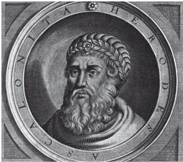
Ирод Великий. Гравюра

Но подагра – самый меньший из недугов Ирода. Царь иудеев (так любит он себя называть, хотя давно уже не выполняет предписаний иудейской религии) страдает от болезни легких, проблем с почками, болезни сердца, глистов, венерических заболеваний, а также от кошмарной гангрены, из-за которой его гениталии загноились, почернели и кишат паразитами, так что Ирод не может даже сесть в седло, не