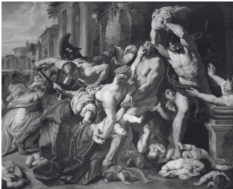
Избиение младенцев. Питер Пауль Рубенс. 1609–1610 гг.

но. Не спрашивают себя, хватит ли им духу вырвать плачущего ребенка из рук матери и совершить над ним казнь. Когда придет время, они выполняют приказ и сделают то, что должны сделать, – иначе сами будут казнены на месте за неповиновение.