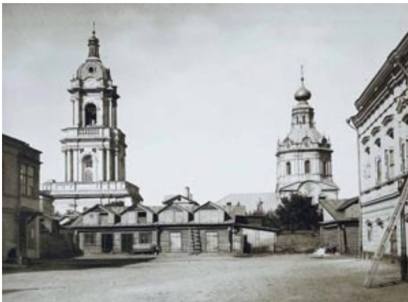
Церковь Параскевы Пятницы за Ленивым рынком.

Интересно выражение «семь пятниц на неделе». Оно связано с невыполнением обязательств, которые купцы клялись исполнить в очередную пятницу – в день ярмарки.