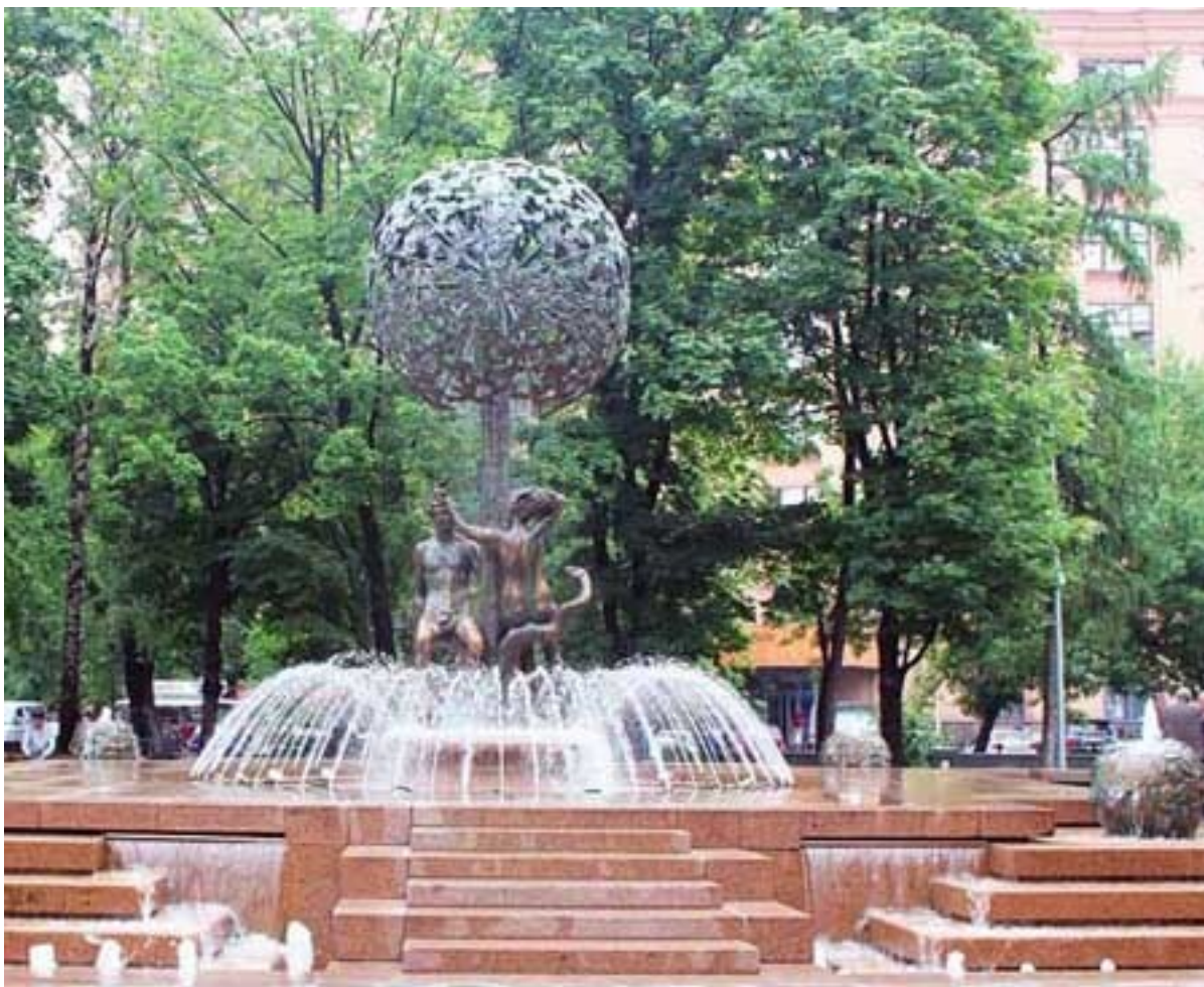
Современный вид площади.

Весной 2008 года на площади зашумел фонтан «Адам и Ева под Райским деревом» 5 .