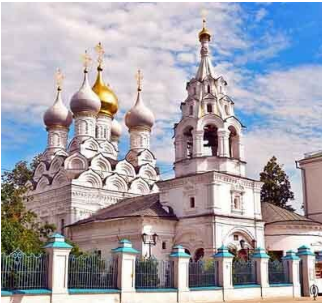
Храм Святителя Николы в Пыжах.

Храм – прекрасный образец русского узорочья, свидетельствующий о мастерстве каменщиков, создавших удивительный по красоте живописный декор фасада: наличники окон и порталы входа в храм. Белокаменные кокошники напоминают бегущие вспененные волны, по которым мирно плывут купола. Храм создает впечатление не архитектурного, а скульптурного произведения. В стройной шатровой колокольне 16 слуховых окон в два ряда, дабы колокольный звон храма был слышен издалека.