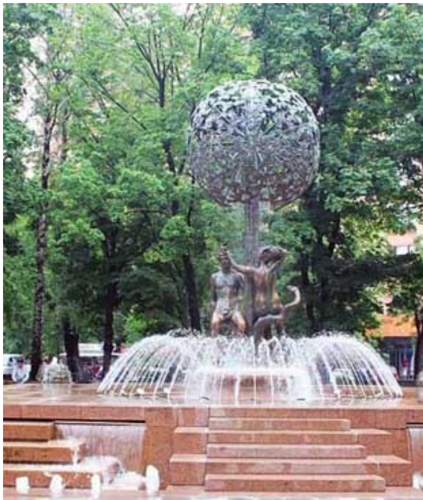
Современный вид площади.