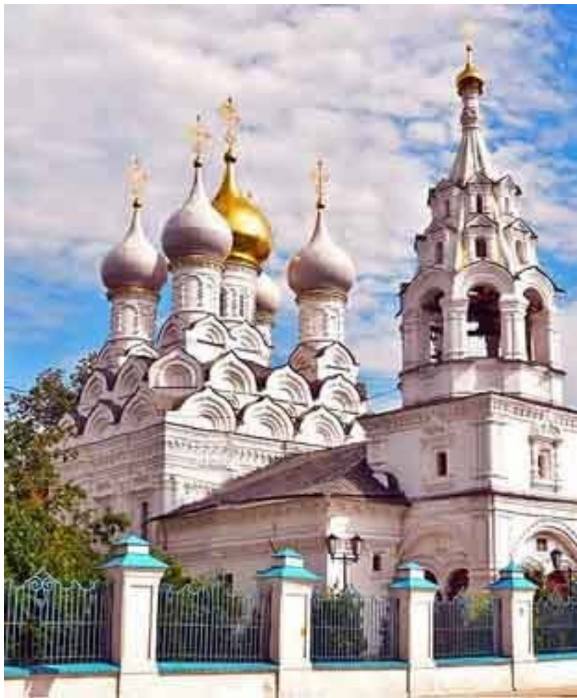
Храм Святителя Николы в Пыжсах.