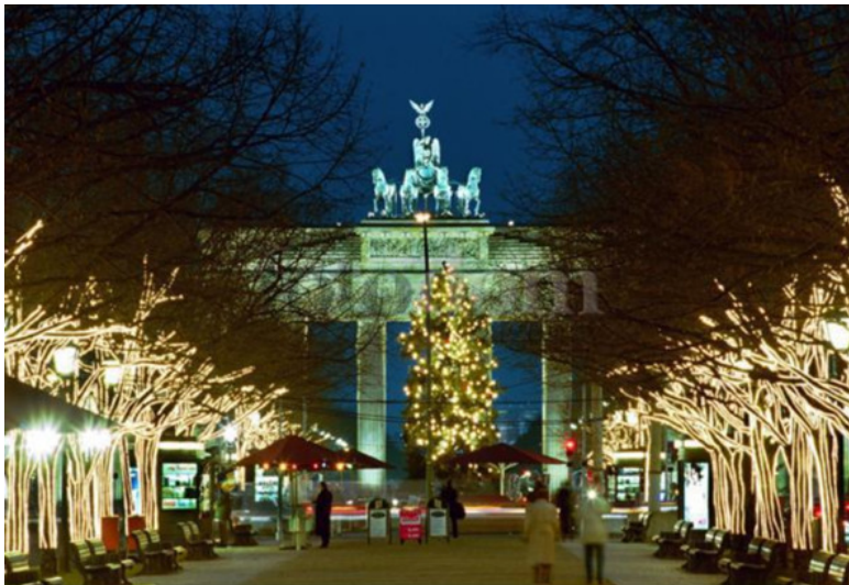
Улица Унтер-ден-Линден в Рождество

Перед Рождеством улица Унтер-ден-Линден стала сияющей. Голые ветви деревьев были усыпаны огонечками, электрогирлянды пересекали улицу, подмигивали цветные фонарики. Бранденбургские ворота светились, иллюминированные под цвета национального флага. На площади перед ними переливалась огнями праздничная ёлка. Вдоль аллеи стояли милые павильончики с разной новогодней чепухой.