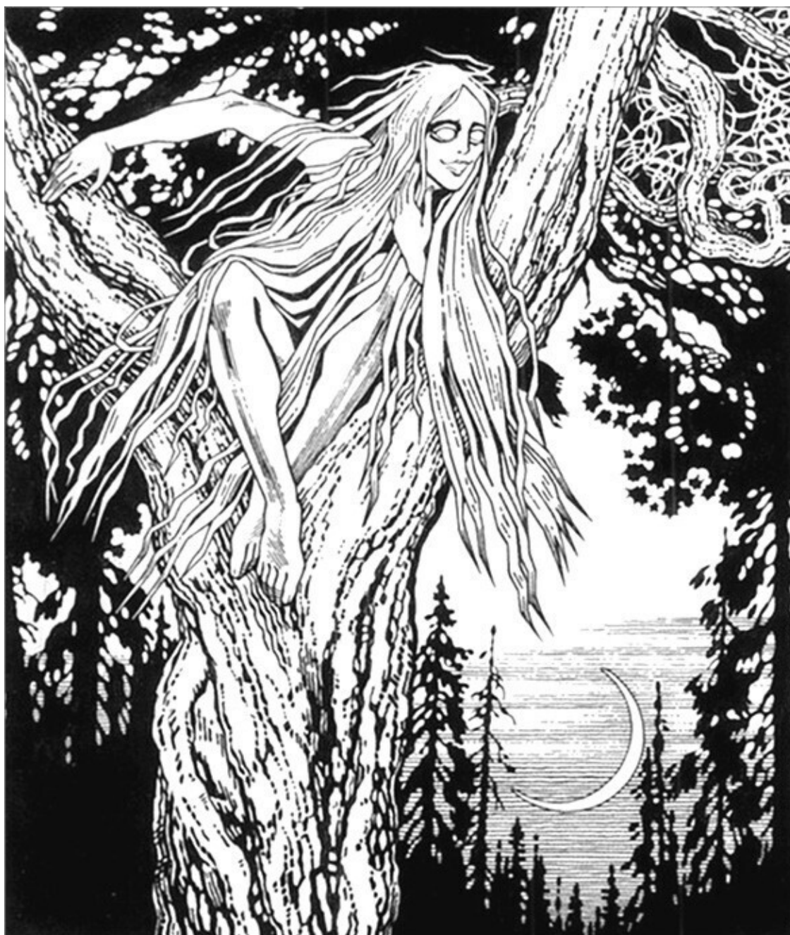
Русалка. Иллюстрация И.Я. Билибина (1934). Одно из немногих изображений настоящей русалки

В XX столетии привидение отделяется от видения, но призрак остается в близком родстве с ним. В словаре Д.Н. Ушакова слову «призрак» придается некое возвышенное значение (ведь именно в таком виде бродил по Европе коммунизм) – «видение, образ чего-либо», а отделенное от него «привидение» третируется как измышление людей суеверных. Вместо «милых теней», «младых призраков» (А.С. Пушкин) и упомянутого европейского бродяги эти невежи лицезреют всяких «отсутствующих существ». Характеристика «бесплотное сверхъестественное существо» накрепко привязывается к понятию «дух», а к духу религиозному милостиво добавляются теософские и спиритические духи.