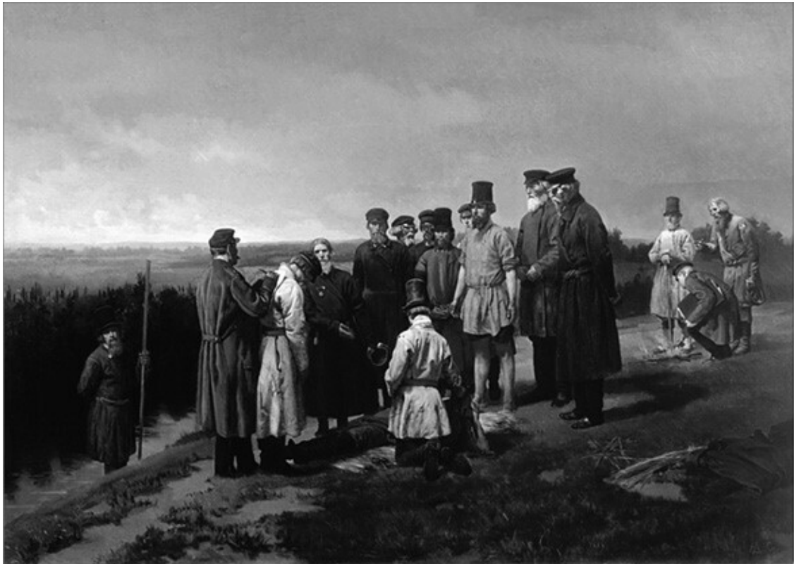
Утопленник в деревне.

Не к этим ли обрядам восходит обычай «кормить» и ублажать гостей из иного мира? Призывы к предкам в поминальные дни напоминают заговоры. Например, крик в печную трубу или в окно: «Деду, иди к обеду!» или: «Вся умершая родня – сколько вас есть – приходите ужинать!». После трапезы столь же чинно и «деду», и вся неисчислимая родня выпроваживаются восвояси: «Деда святые, вы ели и пили, идите же теперь к себе» или: «Кыш, душечки, кыш, большие через дверь, маленькие через окно». Избави Бог послать в окно большую душу! Выломанной рамой ущерб не ограничится. Одна женщина, справляя годовщину свадьбы с покойным мужем, забыла налить ему стакан и чуть было не получила люстрой по голове.