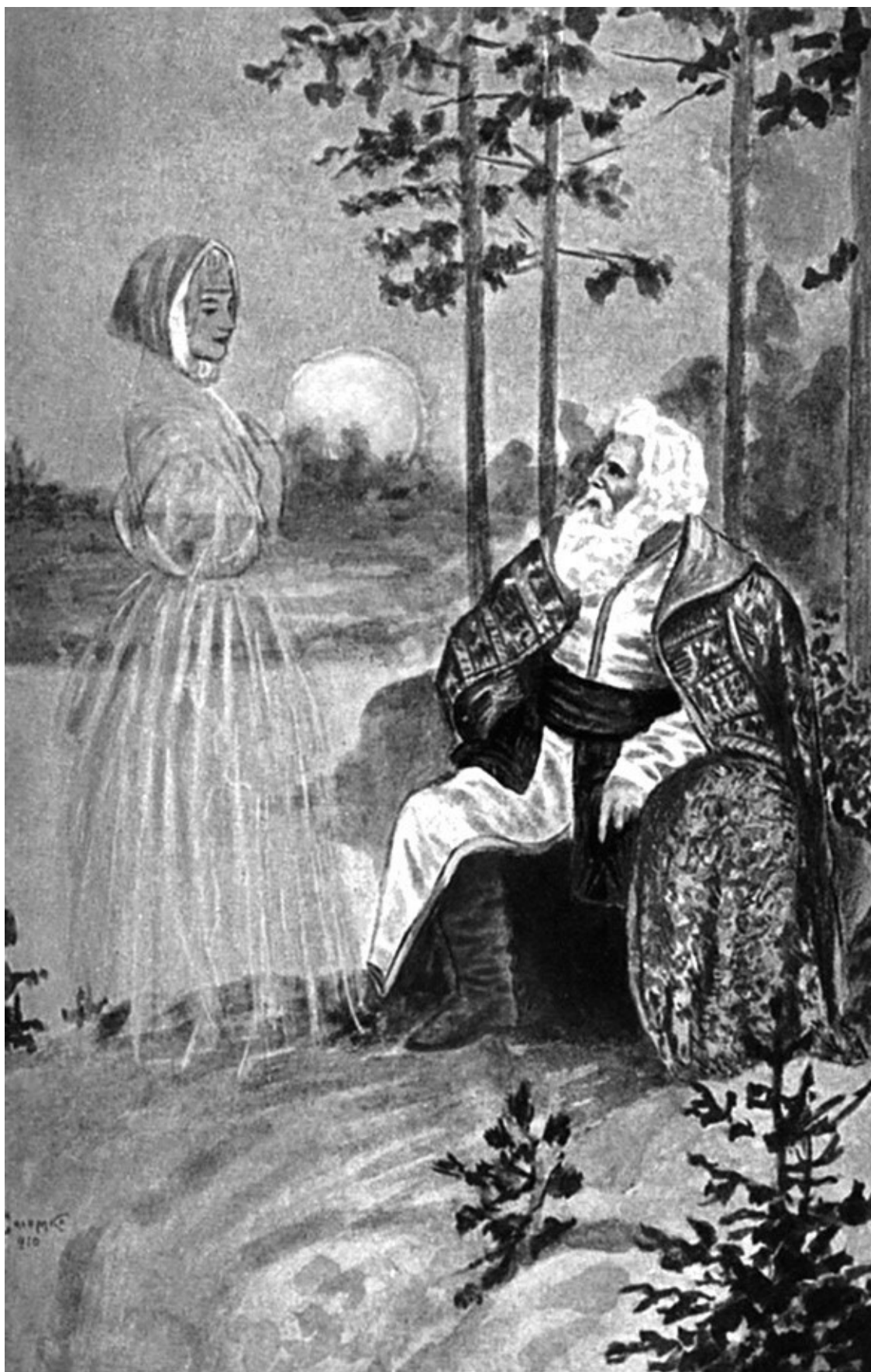
Воспоминание. Картина С.С. Соломко (1910).