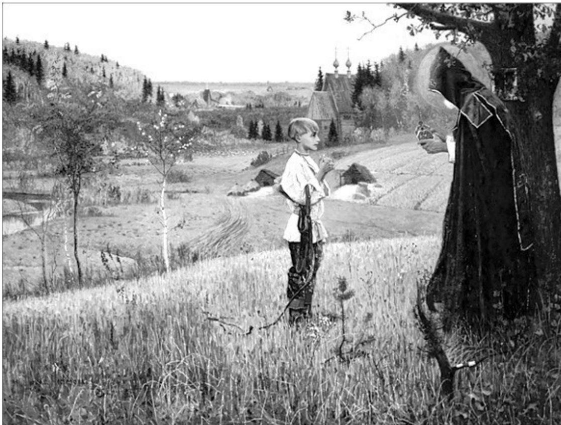
Видение отроку Варфоломею. Картина М.В. Нестерова (1890).

каком-нибудь промежуточном состоянии вроде «забытья» больного серебряника. А реальность сна при необходимости можно оспорить.