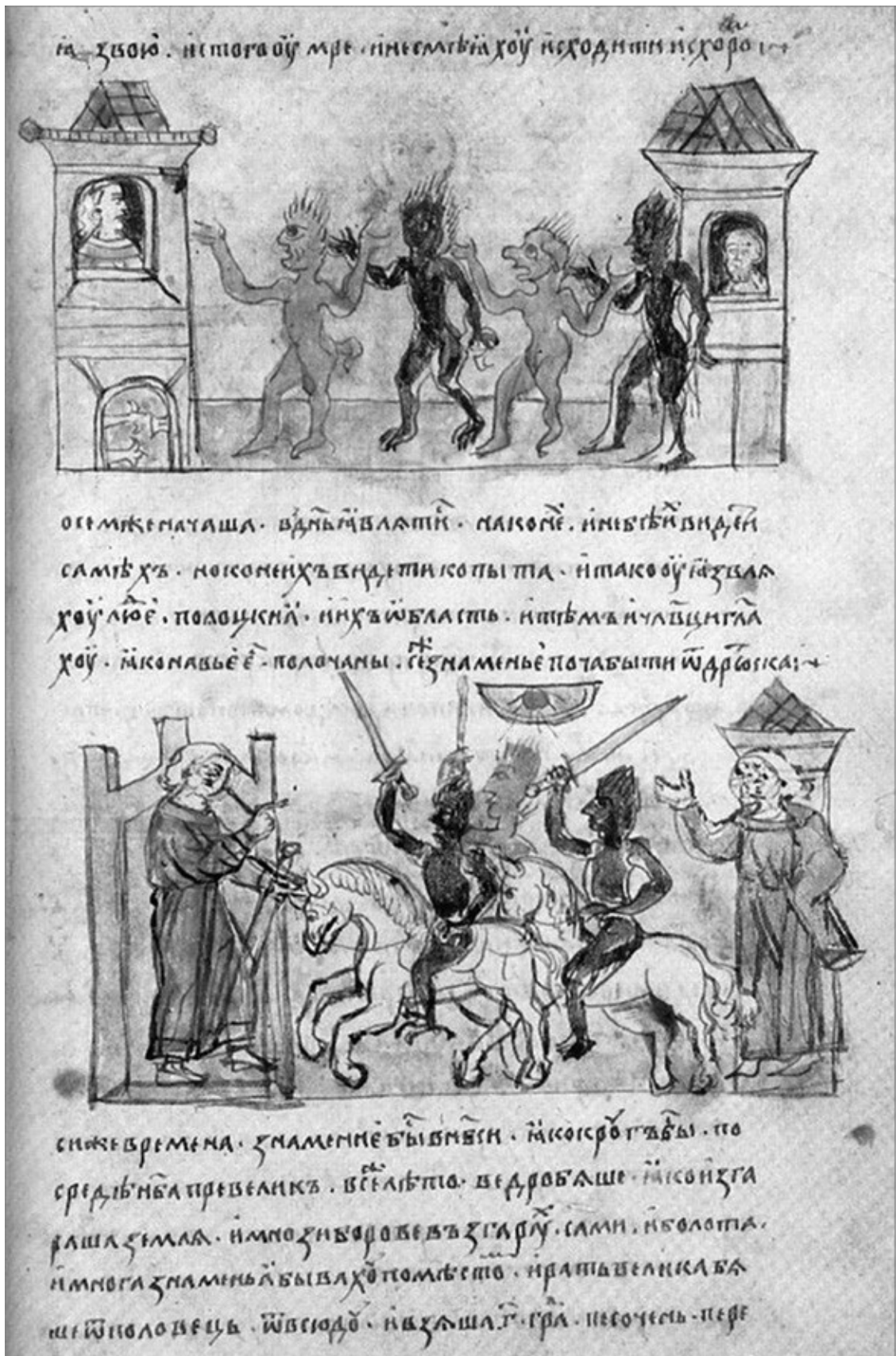
Мертвые бьют полочан. Миниатюра Радзивилловской летописи (XV в.)