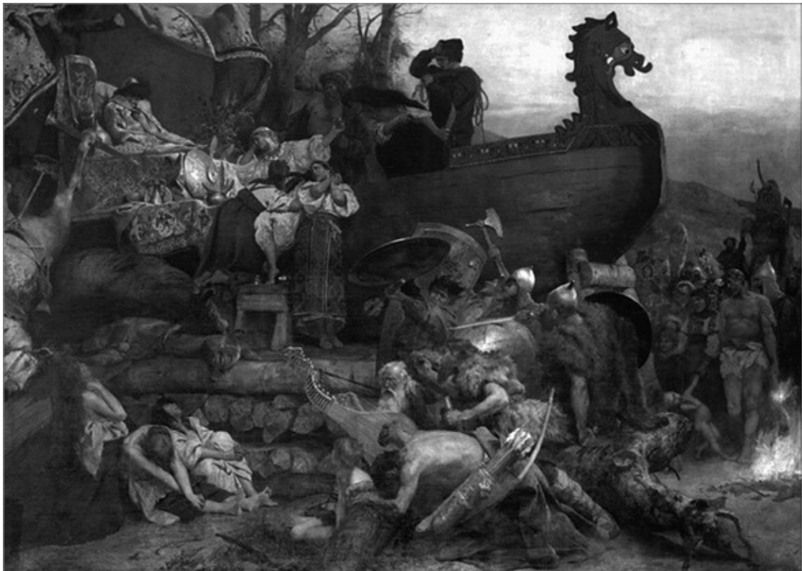
Похороны знатного руса. Картина Г.И. Семирадского (1883)

В заметках Ахмада ибн Фадлана, путешествовавшего по Руси в X столетии, содержится описание обряда погребения знатного руса, который завершается так: «Потом подошел ближайший родственник (этого) мертвеца, взял деревяшку и зажег ее у огня, потом пошел задом, затылком к кораблю... зажженная деревяшка в одной его руке, а другая его рука (лежала) на заднем проходе, (он) будучи голым, пока не зажег сложенного дерева (деревяшек), бывшего под кораблем». По заключению этнографов, родственник разделся для того, чтобы покойник не узнал его. Из тех же соображений он пятился задом и прикрывал самое уязвимое (узнаваемое?) место. Не будем уточнять, чем именно занимались тогдашние призраки, просто констатируем факт наносимого ими вреда.