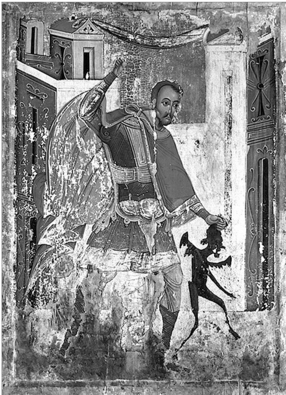
Икона «Святой мученик Никита побивает беса».

В иконописи бес имеет не белый цвет, как у ангела и человека, а черный, выражающий неполноту и ущербность