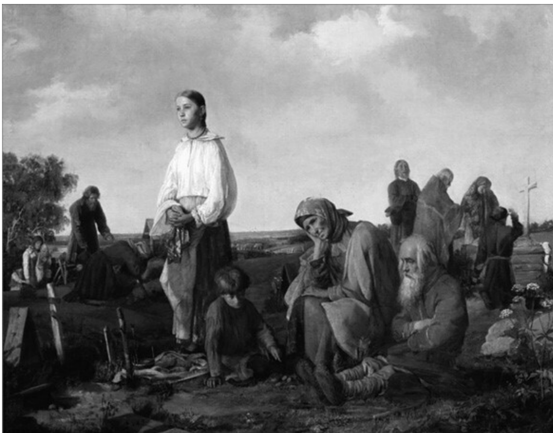
Поминки на деревенском кладбище.

Русский вариант западного чистилища – так называемые мытарства (хождение по мукам) души в течение сорока дней после смерти. В это время душа пребывает в различных частях дома – окно, стены, красный угол, печь, труба, порог, чердак (последнее очень близко английскому фольклору) – или на кладбище, а также скитается по оврагам и горам, искупая собственные прегрешения. Такая душа либо недоступна взорам живых – о ее присутствии возводят звуки или чувство беспокойства, либо имеет облик смутной бестелесной фигуры, в которой угадываются знакомые черты.