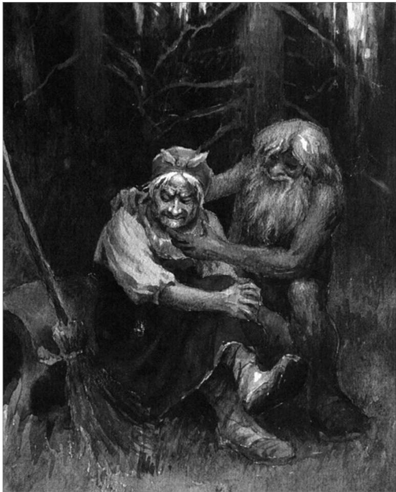
Леший и Баба яга. Картина Н.А. Сергеева.