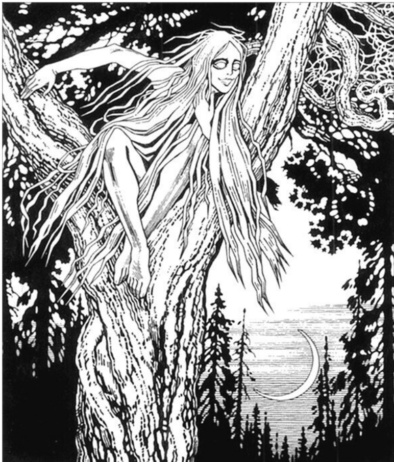
Русалка. Иллюстрация И.Я. Билибина (1934). Одно из немногих изображений настоящей русалки