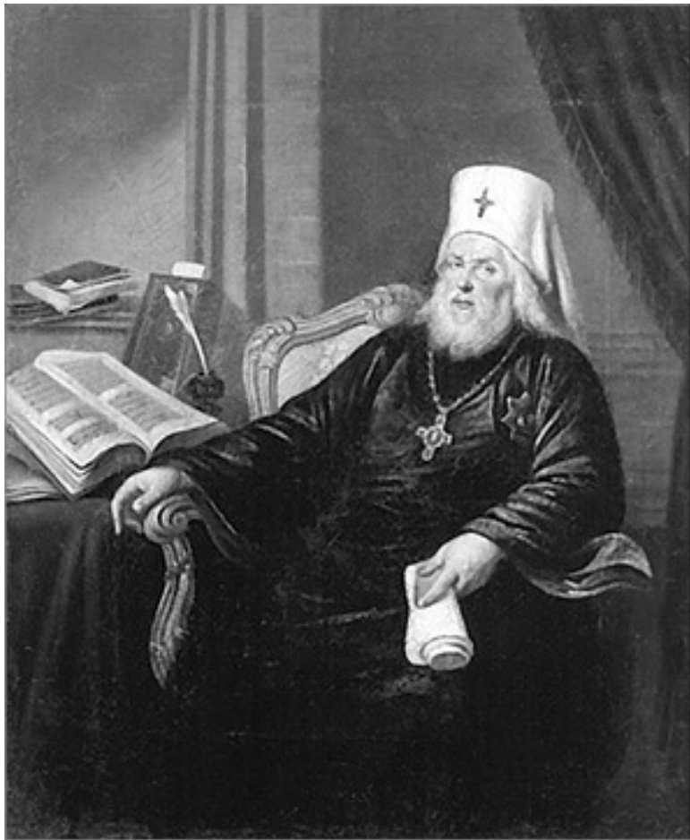
Митрополит Платон (Левшин).

Портрет работы неизвестного художника (начало XIX в.).