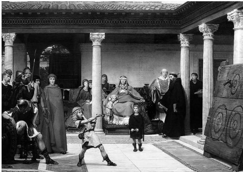
Лоуренс Альма-Тадема. Воспитание детей Хлодвиг. XIX в.

Она родила второго ребенка – Хлодомера. Снова крестила. Он начал болеть. Хлодвиг сказал: «Ты видишь, что творит твой бог!» Но мальчик выжил.