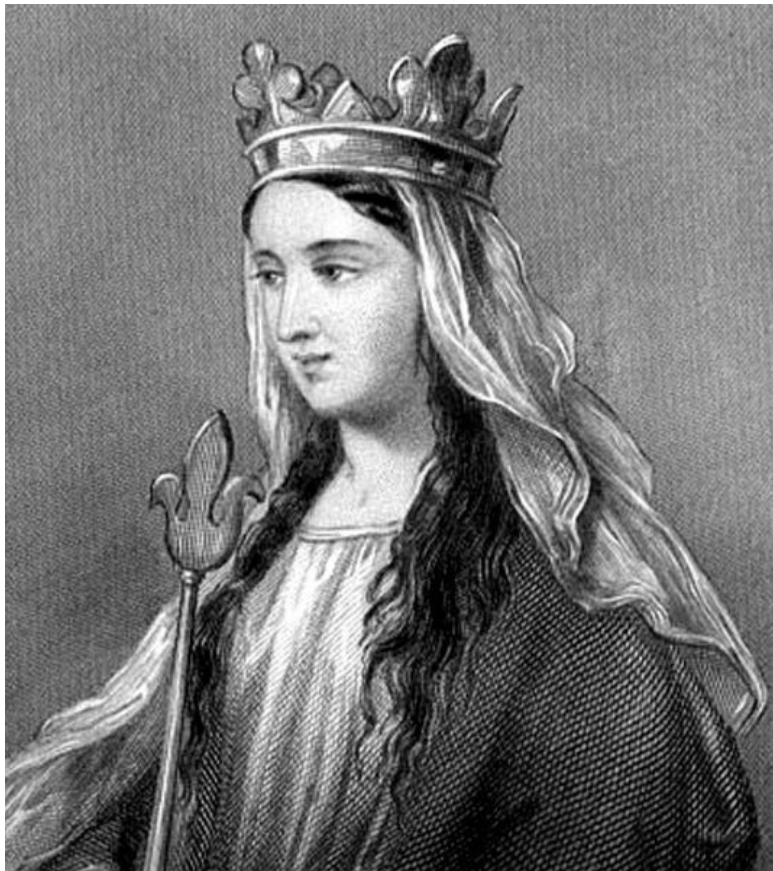
Матильда Фландрская, жена Вильгельма. Иллюстрация XIX в.

Гарольд побывал на континенте. Иногда нам кажется, что