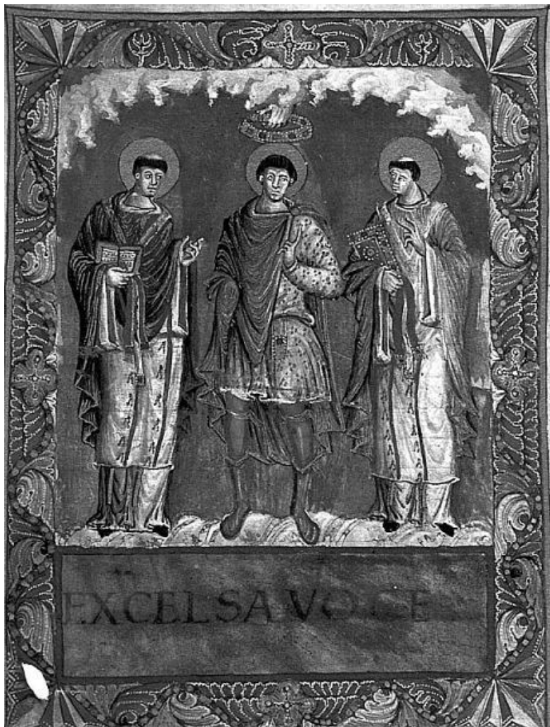
Карл Великий и Папы Римские Геласий I и Григорий I.