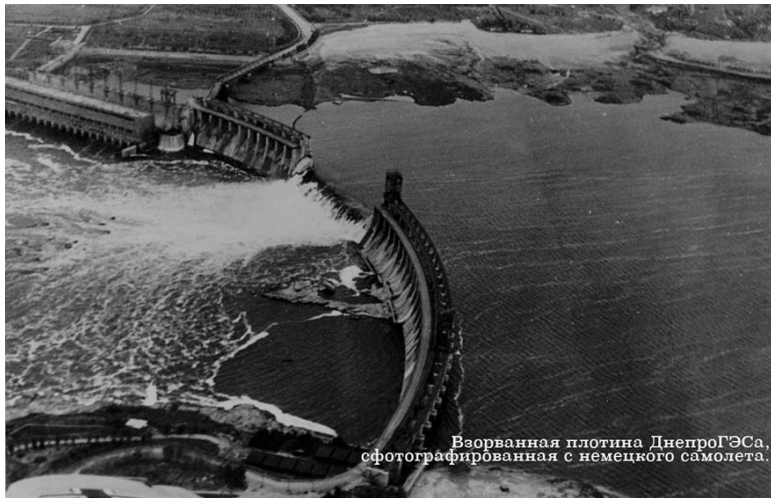
Взорванная плотина ДнепроГЭСа, сфотографированная с немецкого самолета.

От кого: Северо—Осетинская АССР село Дзуарикау Газданова Асахмета