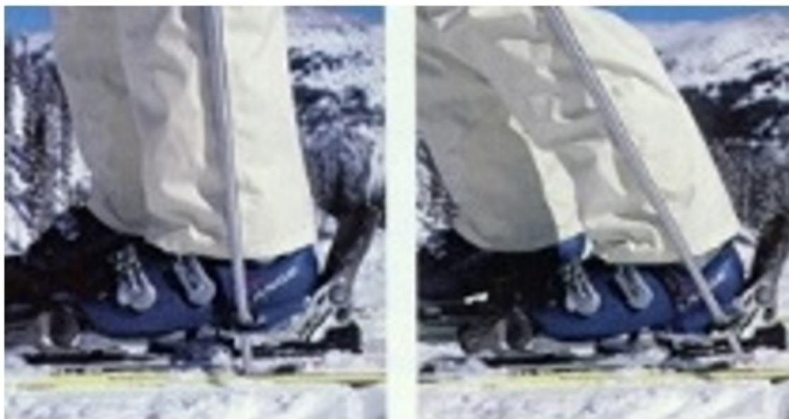
Голеностоп выпрямлен Лыжа не загружена

Особое внимание обратите на сгибание голеностопов.